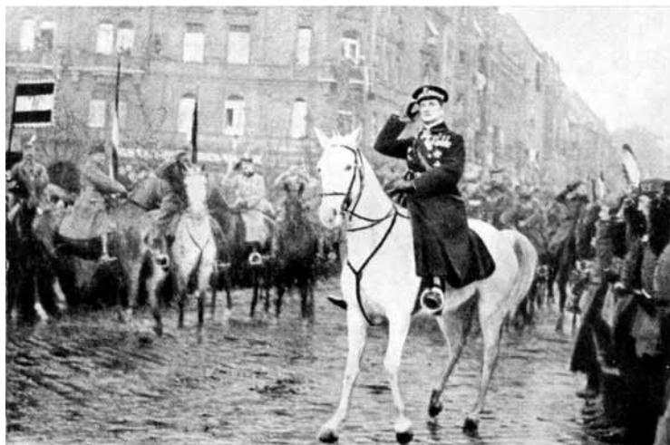
5. kép A nemzeti hadsereg élén, 1919.

a lakosság öröme, hogy a vörös terror szenvedései alól felszabadult. Budapest polgármestere a Gellért-szálló előtt fogadta és üdvözölte hivatalosan a nemzeti hadsereget. Válaszom, amely, – ma is úgy érzem, – az akkori hangulat hű kifejezője volt, így szólt: