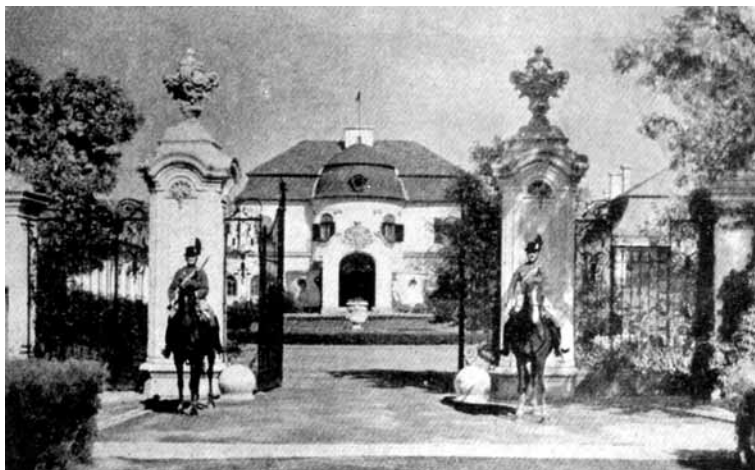
1. kép A Horthy család otthona Kenderesen