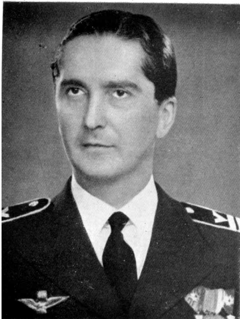
9. kép Horthy István kormányzóhelyettes

vánt kormányzóhelyettségé. Az ülést felfüggesztették arra az időre, amíg az én írásbeli hozzájárulásom megérkezett. Újabb szünet alatt meghívták fiamat, aki repülőtishti egyenruhájában jelent meg és magasra emelt kézzel letette esküjét.