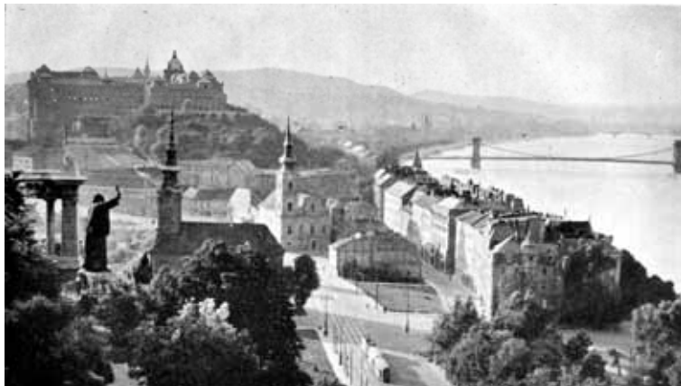
8. kép A királyi vár

nyos, hogy Budapesten mindenkinek, katolikusnak, vagy nemkatolikusnak egyaránt ez volt a véleménye Pacelli bíborossal való találkozása után.