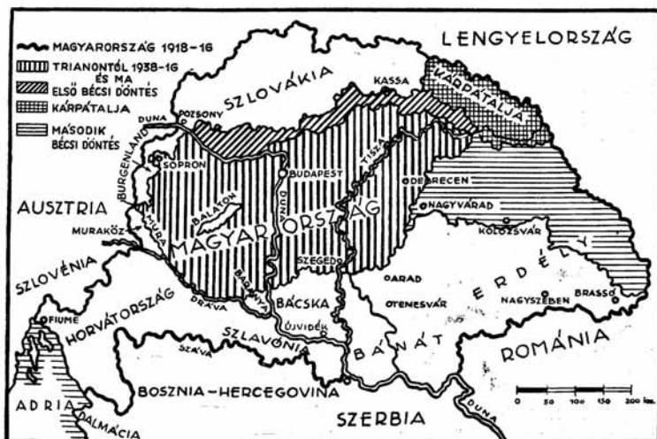
12. kép Magyarország térképe

Az 1947 februári párisi békeszerződés megint visszaszorította Magyarországot a trianoni határok mögé, sőt Csehszlovákia javára Pozsonytól délre a Duna jobb partján még 3 falura terjedő „határkiigazítást” is tett.