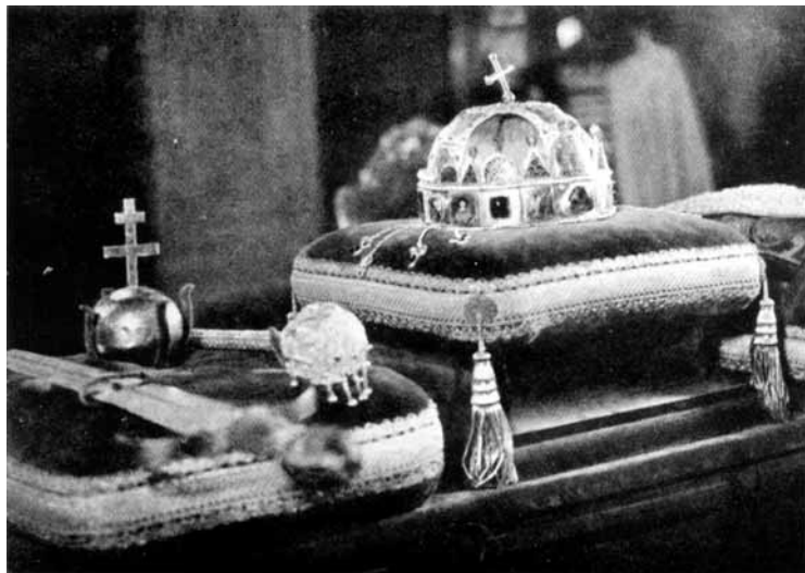
7. kép A magyar koronázási jelvények

kább a miatt, mert a viszonyok időközben Németországban gyökeresen megváltoztak. Ez ránk és Európára, sőt az egész világra messzeható következményekkel járt.