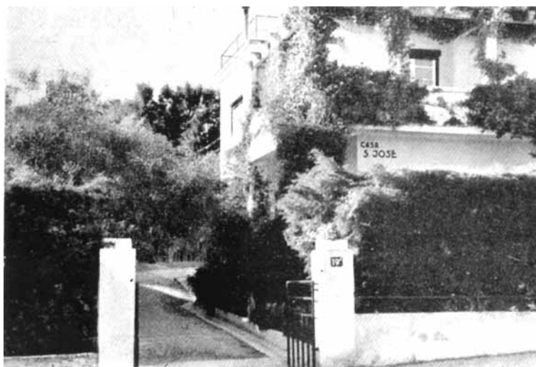
2. kép Az Estoril-i lakhely