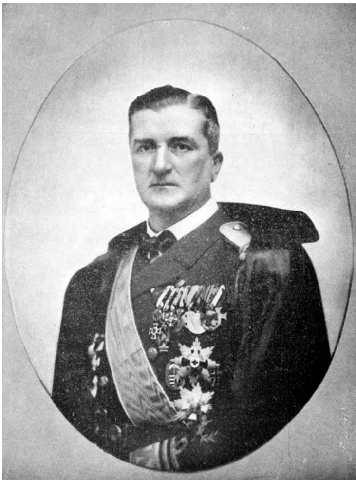
6. Nagybányai Horthy Miklós kormányzó

Az első világháborúban az ellenség jelszava úgy hangzott, hogy „ a világot éretté kell tenni a demokráciára ”. Ezért szorították Magyarországot arra, hogy a szocialistákat is bevegye a kormányba, ámbár mivel a szociáldemokraták és kommunisták összeolvadtak, a magyar nép a munkáspárt képviselői-