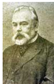
2 Serge Alexandrovitch Nilus, écrivain mystique et orthodoxe, premier éditeur des Protocoles.