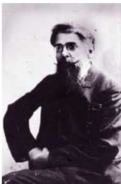
1 Le « fabricant des Protocoles » Mathieu Golovinski, à Paris, en 1907