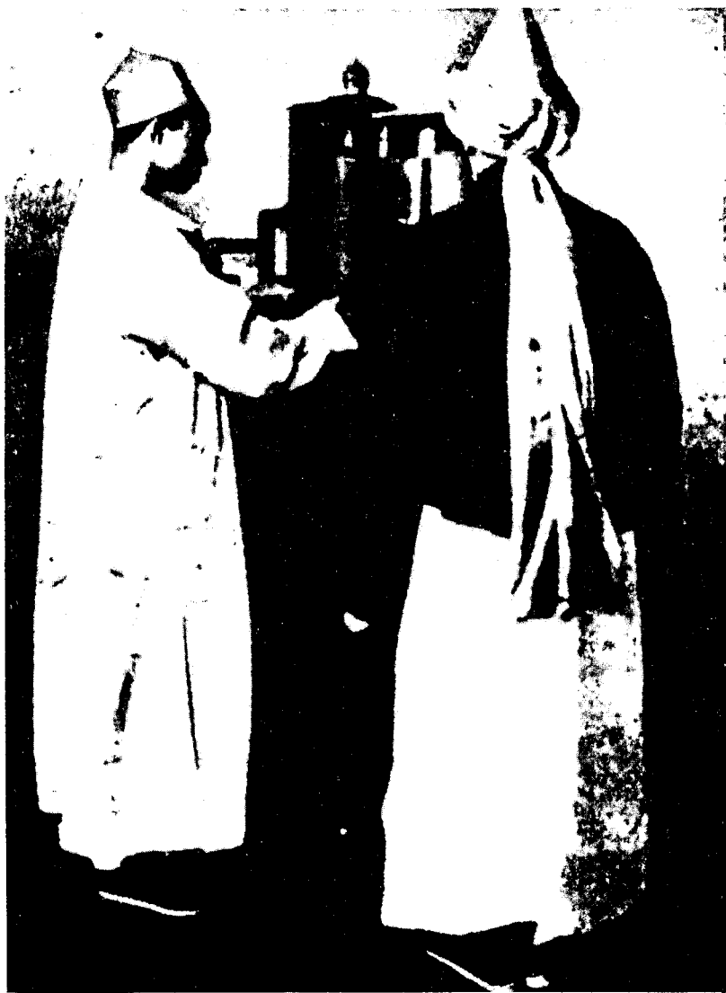
CEREMONIA DE JUDIOS CHINOS DE LECTURA DE LA TORAH.

Continúa texto de la fotografía en la página 27.