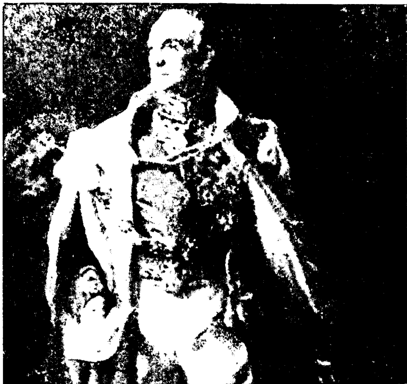
LORD READING, JUDIO INGLÉS. VIRREY DE LA INDIA.

Su nombre judío fue el de Rufus Daniel Isaacs. Nació en Londres en 1860. Su padre era comerciante en frutas. Fue consejero de la reina de Inglaterra. En 1913 fue designado presidente del Tribunal Supremo de Inglaterra. En 1917 le fue concedido el título de nobleza de Conde. En 1921 fue nombrado Virrey de la India. Al terminar en cinco años el desempeño de este alto cargo, como premio a sus servicios al Imperialismo Británico se le concedió el título de Marqués de Reading, que heredan sus sucesores.