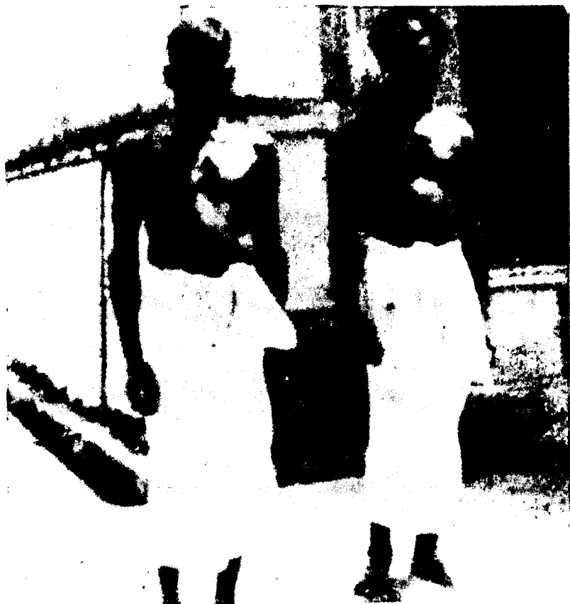
JUDIOS DE SINGAPUR. SIRVIENTES DE UNA SINAGOGA.

Judíos de la India emigraron a Singapur como a otros lugares de Asia y Africa. En Singapur se diluyeron entre la población malaya. Otros judíos llegaron a Singapur procedentes de Bagdad y de Europa, principalmente de Inglaterra. Los judíos en Singapur fueron como en otros lugares, los más firmes sostenes del Imperialismo Británico. Actualmente quieren adueñarse del gobierno cuando Singapur obtenga su independendencia, ojalá que los patriotas de esa estratégica isla puedan impedirlo.