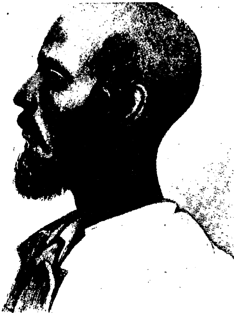
JUDIO NEGRO DE LA INDIA DE LA SECTA DE LOS JUDIOS NEGROS DE COCHIN.