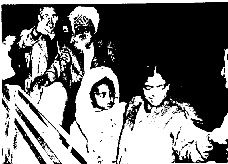
FAMILIA DE JUDIOS NEGROS DE COCHIN, DE LA INDIA, A SU LLEGADA AL AEROPUERTO DE LOD EN ISRAEL.

Los judíos de esta secta de la India son por lo general pescadores, fruteros, obreros, empleados, leñadores y almazareros.