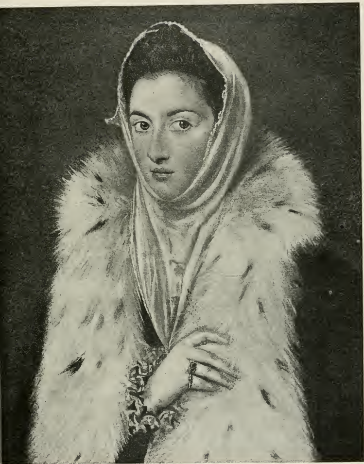
La dame à l'hermine (Glasgow, coll. Stirling-Maxwell)