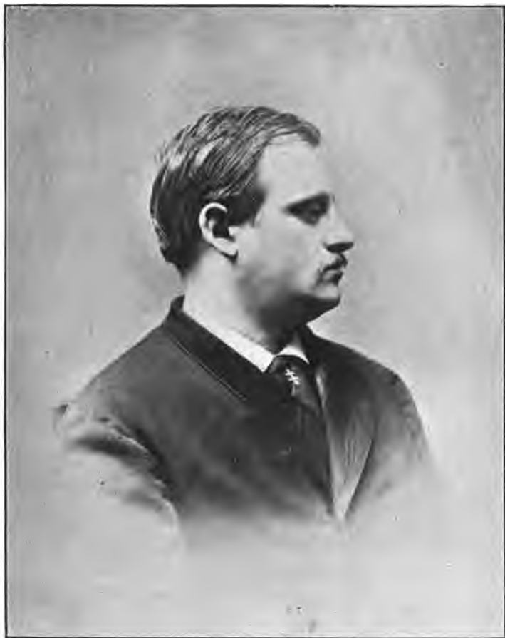
STANISLAS DE GUAITA, DANS SES DERNIÈRES ANNÉES