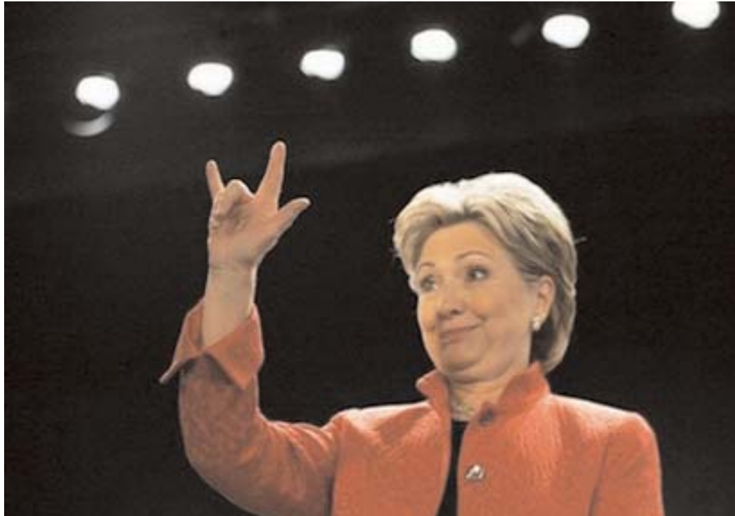
À partir d'en haut, en sens horaire: l'ex président américain Bill Clinton , sa femme Secrétaire d'État, Hillary Clinton , l'ex président américain George Bush avec sa femme, George Bush avec sa fille, l'ex vice président Dick Cheney , George Bush .