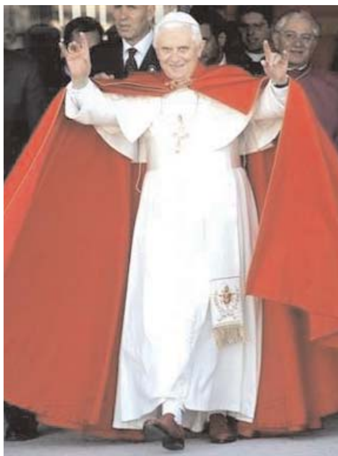
Benoît XVI, dans une photographie du 23 Février 2009.

Devil» (J’aime le Diable) . Ce “signe” est fréquemment utilisé dans le monde de la musique rock, du cinéma et du spectacle, mais aussi aux hauts niveaux du pouvoir politique et des Autorités suprêmes . Dans ce cas, son sens profond est la manifestation extérieure de l’appartenance à l’Ordre des Illuminés de Bavière . Les ex présidents américains Bill Clinton et George Bush par exemple, proviennent de deux sociétés élitistes des Illuminés de Bavière qui éduquent leurs futurs hommes du pouvoir.