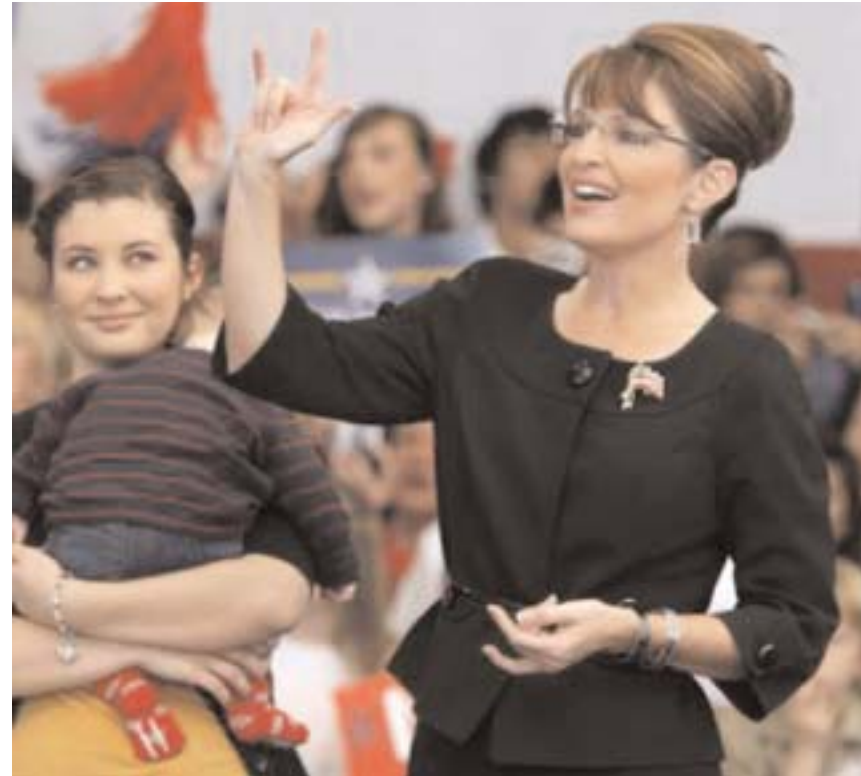
À partir d'en haut en sens horaire: Le président français Sarkozy , le gouverneur de l'Alaska Sarah Palin , le prince William , le président américain Barak Obama , l'ex vice président Dan Quayle .