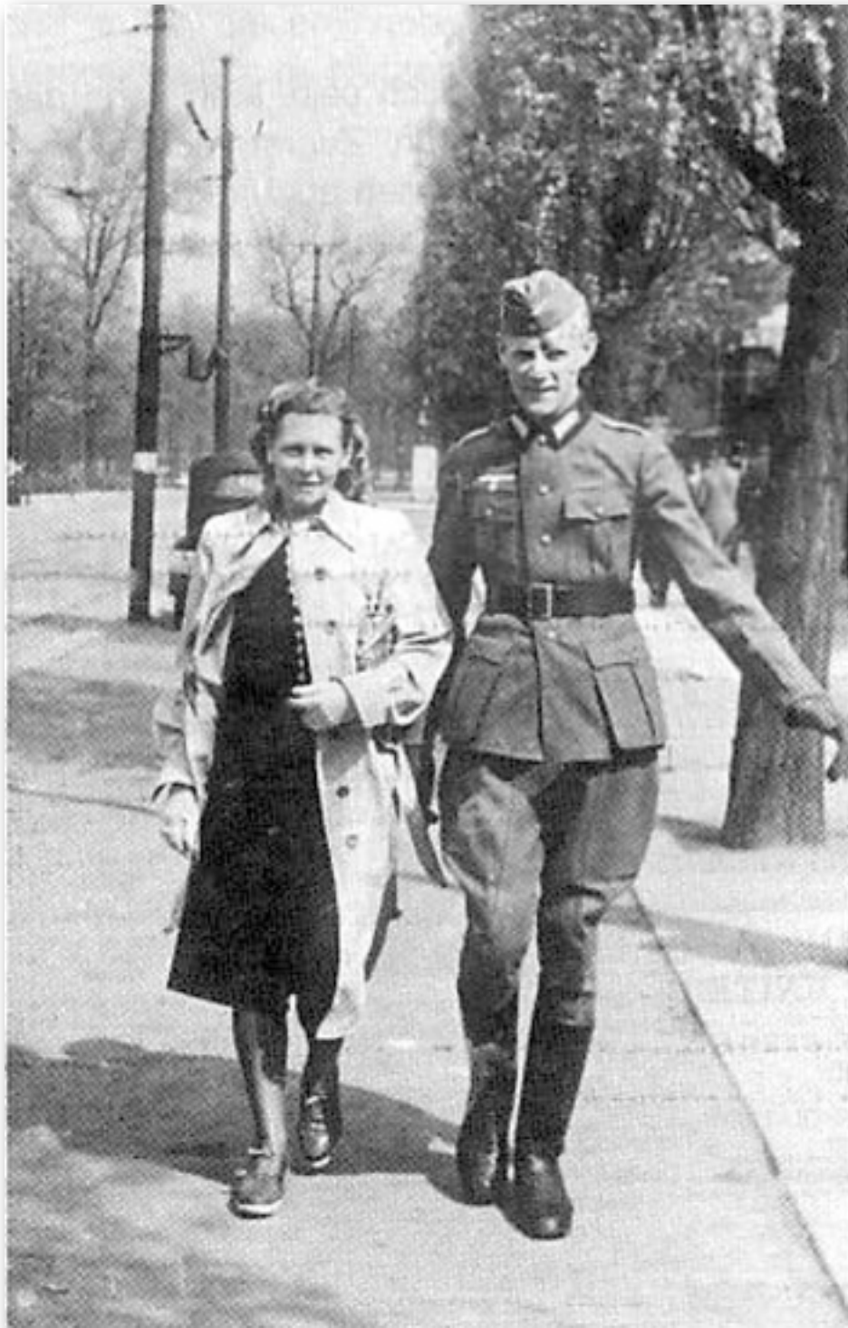
Der Autor mit seiner Frau im Jahre 1944

Ich war in Auschwitz, und zwar von Januar 1944 bis zum Dezember 1944. Nach dem Kriege hörte ich von den Massenmorden, die angeblich von der SS an den gefangenen Juden ausgeübt wurden.