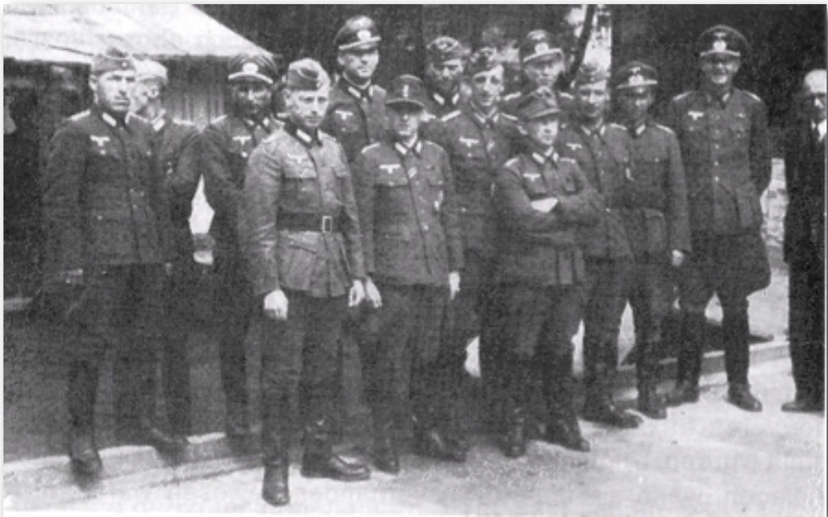
Eine Besuchergruppe von landwirtschaftlichen Sonderführern

In Auschwitz wurde natürlich nicht nur Pflanzenzucht betrieben. Es gab unzählige andere Forschungsaufträge. Wegen der dort zur Verfügung stehenden ungenutzten Arbeitskräfte wurde immer mehr