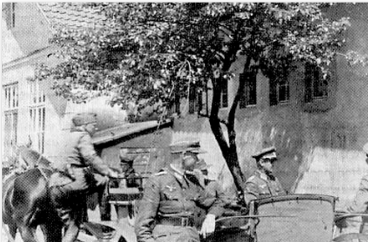
Der Autor (Mitte) und Offiziere bei einer Besichtigungsfahrt durch das Lager

Offiziere, und auch die SS-Soldaten grüßten uns mit soldatischer Ehrenbezeugung.