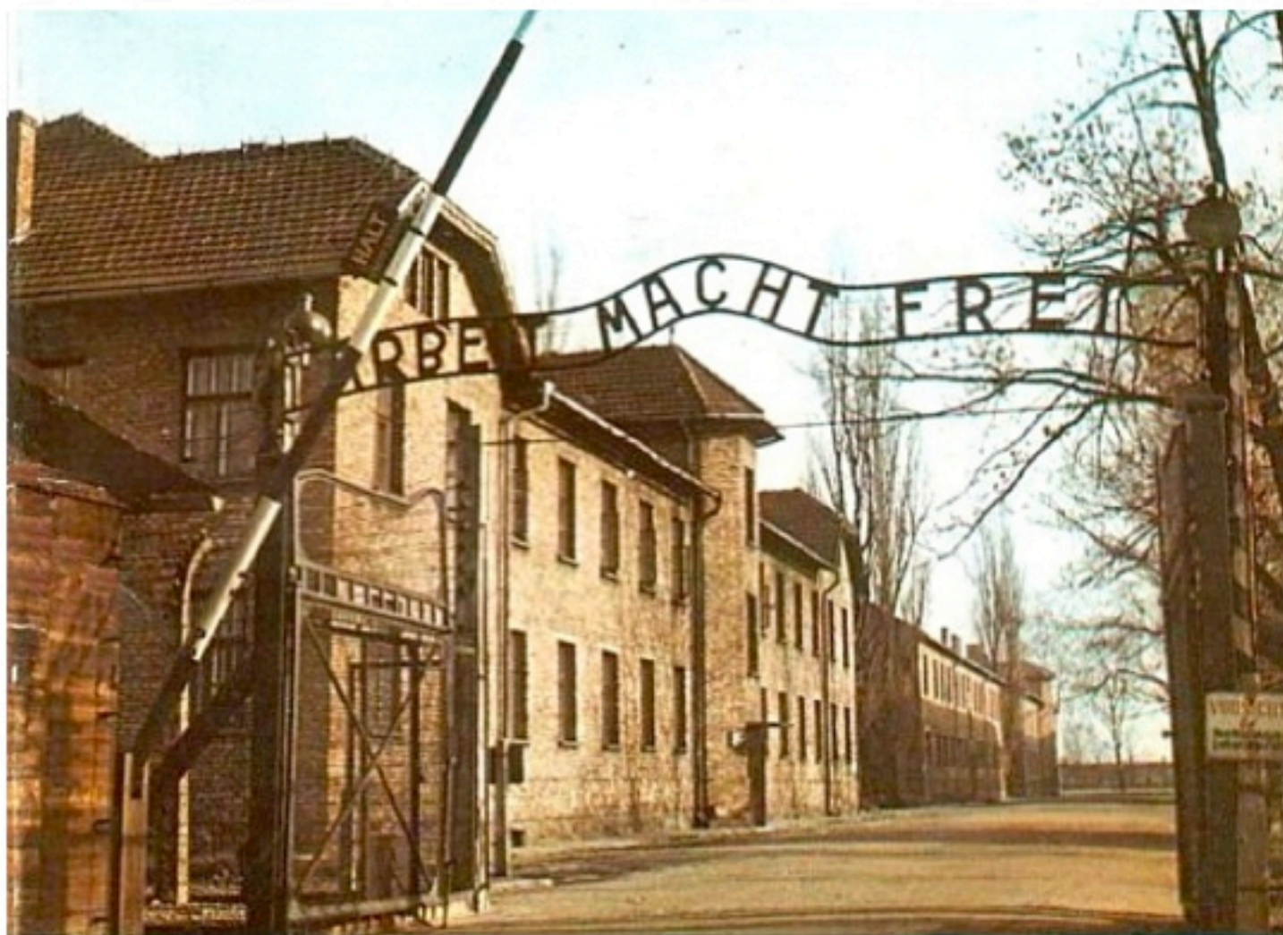
Das Tor zum Konzentrationslager in Auschwitz