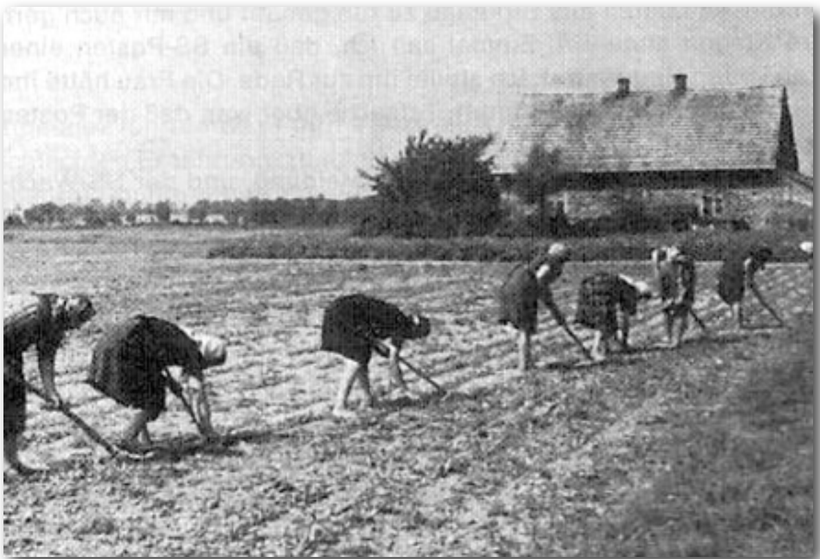
Häftlinge aus Birkenau auf den Kok-Sagis-Feldern

“Ich teile Ihre Meinung — aber ich kann es nicht ändern.”