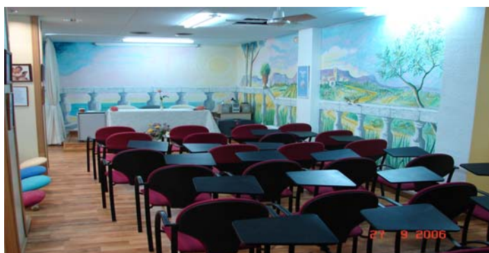
Centre OMRAAM Sala conferencias

Cuando el Sol brilla, la tierra sale de su sueño, las aguas burbujan en cascadas y empiezan a fluir, los vientos soplan, las flores se abren, los árboles ofrecen sus frutos y el hombre despierta y comienza a pensar.