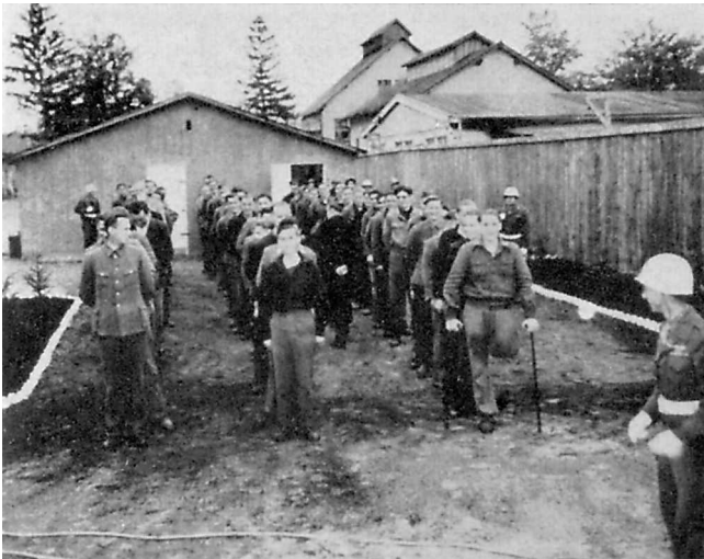
Die Angeklagten im Malmedy-Prozeß treten zur Gerichtsverhandlung an. — Dachau Mai 1946.