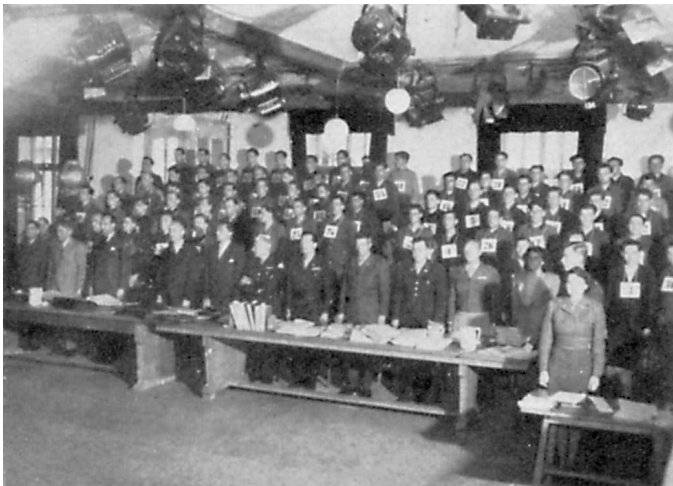
Die Angeklagten mit ihren Verteidigern im Dachauer Gerichtssaal.