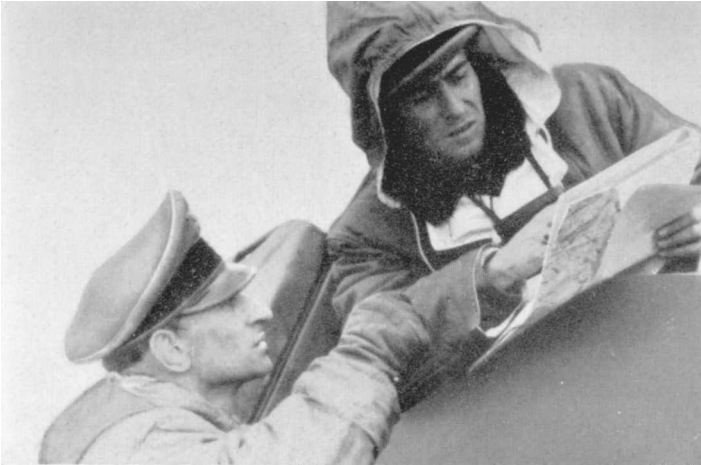
Jochen Peiper im Befehlspanzer. Ardennenoffensive Dezember 1944.