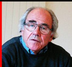
Jean Baudrillard La simulación en el arte e Ilusión y desilusión estéticas