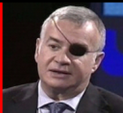
José Javier Esparza Los ocho pecados capitales del arte contemporáneo