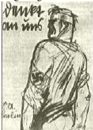
Denkt an uns! SA. Berlin! Postkarte von Mjölner

Manchmal und oft zog die Berliner SA. an einem klirrendkalten Wintersonntag aus Berlin heraus. Dann marschierte sie in fest aufgeschlossenen Kolonnen in Schnee und Regen und Kälte durch versteckte, einsam liegende märkische Flecken und Dörfer, um auch in der Umgebung von Berlin für die nationalsozialistische Bewegung zu werben und zu agitieren.