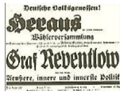
Plakat zu einer getarnten Versammlung 4

vor der Öffentlichkeit zu rechtfertigen. Man suchte also, sich ein Alibi zu verschaffen. Die Öffentlichkeit sollte mit Fingern auf uns weisen. Es sollte sich die Meinung festsetzen, daß diese Partei wirklich nur eine Zusammenrottung von verbrecherischen Elementen sei und die Behörden nur ihre Pflicht täten, wenn sie ihr jede weitere Lebensmöglichkeit unterbanden.