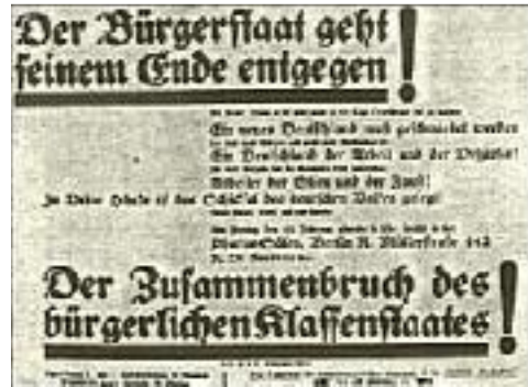
Plakat zu der Versammlungsschlacht in den Pharussälen 1

Das war allerdings eine Provokation, die man bisher in Berlin noch nicht erlebt hatte. Der Marxismus empfindet es bekanntlich schon als Anmaßung, wenn ein nationaldenkender Mensch in einem Arbeiterviertel seine Gesinnung offen zur Schau trägt. Und gar am Wedding?!