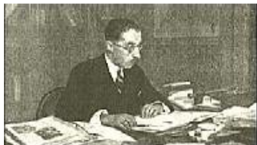
Herr Dr. Bernhard Weiß, Vizepolizeipräsident von Berlin

Er hatte sich aus der Verwaltungskarriere allmählich hochgearbeitet, trat später in den Polizeidienst über, wurde in jungen Jahren Leiter des Hauptressorts am Alexanderplatz, der politischen IA, war intimer Mitarbeiter Severings bei seiner ersten Ministerschaft im preußischen Innenministerium und avancierte dann nach dem