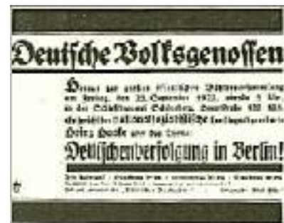
Plakat zu einer blutigen Versammlung in Schöneberg 6