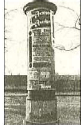
Plakat zur zweiten großen Spandauer Versammlung gegen die KPD.

Wir hatten einen Ausgangspunkt gewonnen. Im blutigsten Terror, den man gegen uns ansetzte, bekannten wir uns zum Widerstand. Es sollte nicht lange mehr dauern, daß diese Front des Widerstandes, die ihre ersten Positionen verteidigte, zum politischen Angriff auf der ganzen Linie vorging!