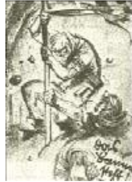
Das Banner steht! Postkarte von Mjölneur

Die eigentliche Stärke der SA. beruht darin, daß sie sich im wesentlichen aus proletarischen Elementen zusammensetzt. Diese Tatsache ist aber auch ein Unterpfand dafür, daß die SA. und damit die ganze Bewegung nie in bürgerlich-kompromißlerisches Fahrwasser abgleitet. Das proletarische Element, vor allem der SA., gibt der Bewegung immer wieder jenen ungebrochenen, revolutionären Elan, den sie sich bis auf den heutigen Tag gottlob erhalten hat. Viele Parteien und Organisationen sind seit Ende des Krieges entstanden und nach kurzem Aufstieg wieder in bürgerliche Niederungen versunken. Der Kompromiß hat sie alle verdorben. Die nationalsozialistische Bewegung besaß in der revolutionären Aktivität