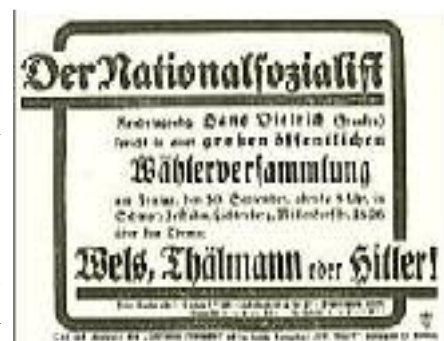
Versammlungsplakat während des Verbots 5

Die politische Kritik wird sich immer nach den Fehlern des zu kritisierenden Systems richten. Sind die Fehler leichter Natur und kann man dem, der sie macht, den guten Willen nicht absprechen, dann wird die Kritik sich immer in gesitteten und fairen Formen bewegen. Sind die Fehler aber grundsätzlicher Art, bedrohen sie die eigentlichen Fundamente des staatlichen Gefüges, und hat man darüber hinaus noch Veranlassung zu dem Verdacht, daß