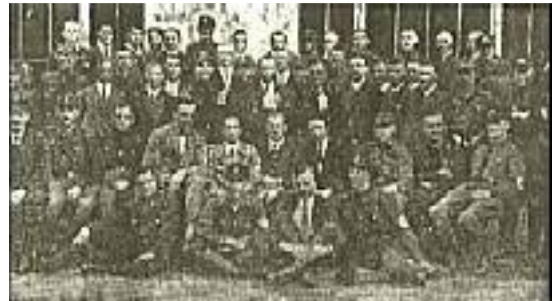
Die Berliner Führerschaft (1927)

Das war in unserer damaligen Situation allerdings leichter gesagt als getan. Wir verfügten zwar über ein ansehnliches Korps von ausgebildeten und erfolgreichen Parteagitatoren.