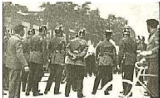
Im Interesse der Ruhe und Ordnung

Der Bürger will den Frieden um des Friedens willen, auch wenn er der Leidtragende eines faulen Friedens ist. Wie der Marxismus die Straße eroberte, zog er sich feige in seine vier Pfähle zurück, und verschüchtert und ängstlich saß er hinter den Gardinen, als die SPD. die bürgerliche Weltanschauung aus der Öffentlichkeit vertrieb und in massivem Angriff das monarchische Staatsgefüge zum Sturz brachte. Die bürgerliche öffentliche Meinung steht mit der jüdischen Journaille in einer einheitlichen Front gegen den Nationalsozialismus. Sie gräbt sich damit ihr eigenes Grab und begeht aus Angst vor dem Tode Selbstmord.