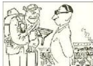
Wem Gott ein Amt gibt - - -