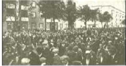
Marsch durch Spandau

Der Marxismus empfindet es schon als freche Anmaßung, wenn eine nicht marxistische Partei überhaupt an die Massen appelliert, überhaupt Volksversammlungen veranstaltet, überhaupt auf die Straße geht. Die Masse, das Volk, die Straße, das sind, wie der Marxismus glauben machen möchte, unbestrittene Vorrechte der Sozialdemokratie und des Kommunismus. Man überläßt den anderen Parteien Parlament und Wirtschaftsverbände. Das Volk aber soll dem Marxismus gehören.