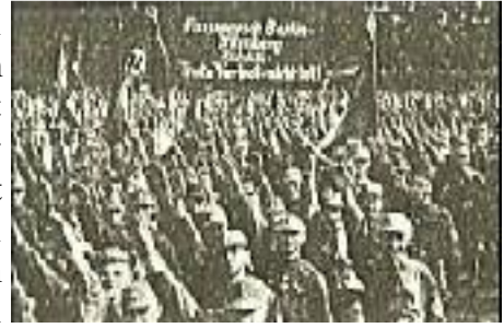
Fußmarsch Berlin - Nürnberg

Es mag einem Spießer unverständlich erscheinen, daß es möglich war, trotz des Parteiverbots drei Sonderzüge von Berlin nach Nürnberg zusammenzustellen und diesen Massenabmarsch bis zum letzten Augenblick den Augen der Behörden zu entziehen. Und doch war das möglich.