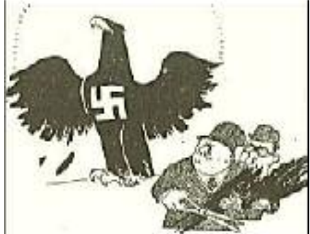
Und die Schwingen wachsen doch wieder...

Die nationalsozialistische Bewegung in Berlin war nun vor die Probe gestellt; sie mußte beweisen, daß ihre Lebenskraft unerschütterlich war. Sie hat diese Probe in einem heroischen, entsagungsvollen Kampf bestanden und in siegreichem Vorwärtsmarsch die Parole, unter der sie begann, wahr gemacht: