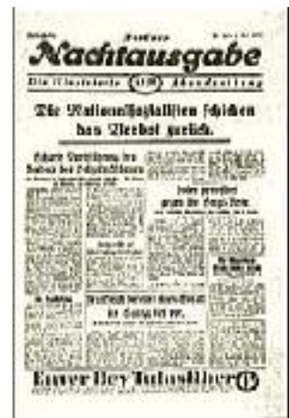
Die Berliner Presse zum Verbot der NSDAP.

Die nationalsozialistische Bewegung in Berlin hatte aufgehört, gesetzmäßig zu existieren. Das war ein Schlag, den wir nur schwer verwinden konnten. Wir hatten uns gegen die Anonymität und gegen den Terror der Straße durchgesetzt, wir hatten Idee und Fahne vorwärts getragen, ohne auf die Gefahren, die unser dabei warteten, zu achten. Wir hatten keine Mühe und Sorge gescheut, der Bevölkerung der Reichshauptstadt unseren guten Willen und die Redlichkeit unserer Ziele zu zeigen. Das war uns auch bis zu einem gewissen Umfang schon gelungen. Die Bewegung setzte eben an, ihre letzten parteipolitischen Fesseln abzustreifen und in die Reihe der großen Massenorganisationen einzurücken, da schlug man sie mit einem mechanischen Verbot zu Boden. Man ahnte allerdings damals nicht, daß auch dieses Verbot keineswegs die Bewegung endgültig vernichten, daß es im Gegenteil