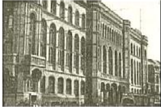
Der Berliner Alex

Um so übler aber wurde das am Alexanderplatz vermerkt; und da man nur sehr wenig gegen uns ausrichten konnte, weil wir die Lacher auf unserer Seite hatten, zog man sich, anstatt sich sachlich zu verteidigen, in die Sicherheit des Amts zurück und suchte mit behördlichen Maßnahmen das zu ersetzen, was dort an geistigen Mitteln offenbar zu fehlen schien.