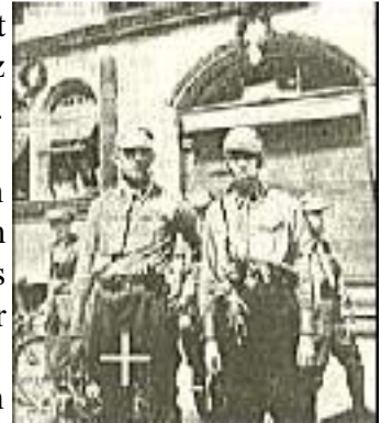
Gau-SA.-Führer Daluege (X) und sein Adjutant

Ein heiteres Erlebnis, das diesem blutigen Zusammenstoß gewissermaßen doch noch einen versöhnlichen Abschluß gab, soll nicht unerwähnt bleiben. Als nach dem Referat zur Diskussion aufgefordert wurde, meldete sich ein mickriger Spießer, der angab, Mitglied des Jungdeutschen Ordens zu sein. Er ermahnte mit pastoralem Pathos zu Brüderlichkeit und Ständefrieden, stellte uns in beweglichen Klagen die zwecklose Unmoral dieses Blutvergießens vor Augen und erklärte, daß Einigkeit allein stark mache. Als er dann noch nach einer tiefen Verbeugung vor der Versammlung zum Vortrag eines patriotischen Gedichtes ansetzen wollte, um damit seinen hohen Edelquatsch zu beendigen, antwortete ihm