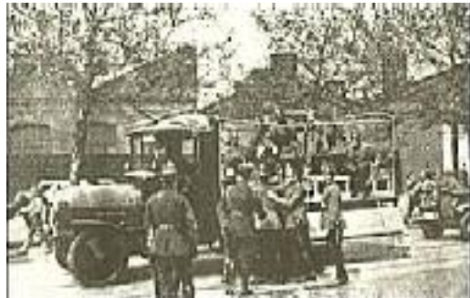
Verhaftung eines nationalsozialistischen "Schwerverbrechers"

Die Sozialdemokratische Partei hat vor dem Kriege mit bierehrlichem Eifer das System der Pickelhaube bekämpft. Die Pickelhaube fiel als Erstes der Revolution von 1918 zum Opfer. Wir haben dafür den Gummiknüppel eingetauscht. Der Gummiknüppel scheint in der Tat das Hoheitsabzeichen der Sozialdemokratischen Partei zu sein; unter dem Regime des Gummiknüppels ist im Laufe der Jahre in Deutschland eine Zwangsgesinnung und Gewissensfesselung eingetreten, die jeder Beschreibung spottet. Gerade wir haben sie in ausgiebigem Maße am eigenen Leib zu verspüren bekommen. Wir konnten dabei Theorie von Praxis unterscheiden lernen und sind manchmal allerdings zu anderen Schlüssen gekommen,