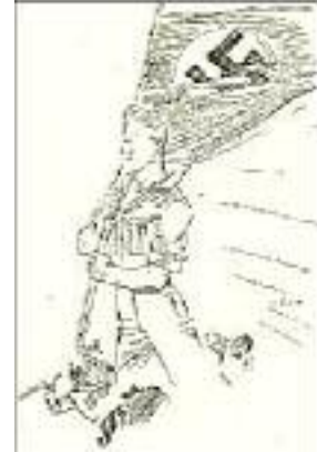
Uns kann keiner!

Den Abend dieses denkwürdigen Tages verbrachte ich bei einem alten Kampfgenossen. Ich wurde dort mit geheimnisvoller Miene zu einem Spaziergang eingeladen, von dem aus wir, ohne daß ich das als verdächtig empfand, in irgendeinem Etablissement draußen in einem Vorort Berlins landeten.