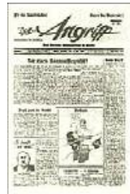
Die erste Nummer des "Angriff"

Der Leser sollte den Eindruck gewinnen, als sei der Schreiber des Leitartikels eigentlich ein Redner, der neben ihm stünde und ihn mit einfachen und zwingenden Gedankengängen zu seiner Meinung bekehren wollte. Das Ausschlaggebende war, daß dieser