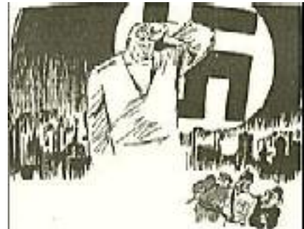
Berlin erwacht langsam!

Am 29. Oktober 1927 mußte es auch dem Schwarzseher und Skeptiker klar werden, daß eine neue Phase in der Entwicklung der nationalsozialistischen Bewegung in Berlin eingesetzt hatte. Jener SA.-Mann, der da mit umflorter Fahne stark und trotzig vor eine ergriffene Gemeinde hintrat und in hinreißenden und aufrüttelnden Versen seinem Zorn und Ingrimme Luft machte, hatte das ausgesprochen, was in dieser großen Stunde das heiß schlagende Herz der alten Parteigarde bis zum Überlaufen ausfüllte: