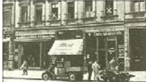
Lützowstraße 44 (XX): Zweite Geschäftsstelle der NSDAP. in Berlin

In den damaligen Wochen wurde auf einer Berliner Bühne mit großem Erfolg das Götzsche Schauspiel "Neidhard von Gneisenau" viele hundert Male zur Aufführung gebracht. Es war für mich das erste große Theatererlebnis in der Reichshauptstadt. Ein Satz jenes