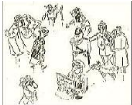
Faschingsaufakt: Diese Maske (DRP. angem.) garantiert dem Träger Schutz vor dem Gummiknüppel und sieht stark demokratisch aus