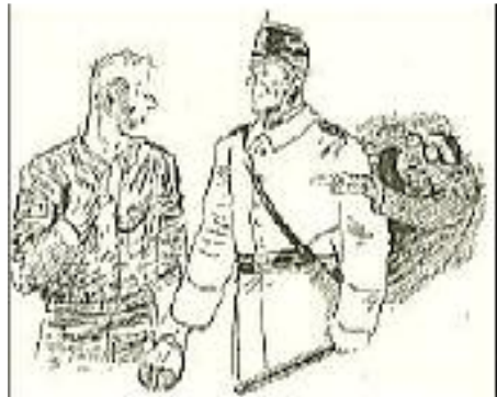
Bruder, wen verfolgst Du?

Dem Jungen traten die Tränen in die Augen. Er stellt sich plötzlich hoch und aufrecht unter seine Kameraden und beginnt zu singen. Sein Nebenmann stimmt ein, und dann mehr und mehr, bis schließlich alle singen. Das ist kein Gefangenentransport mehr, der da in dreißig, vierzig Lastautos durch die Straßen des eben aus seinem Schlaf erwachenden Berlin hindurchgeführt wird - das ist ein Zug von jungen Helden.