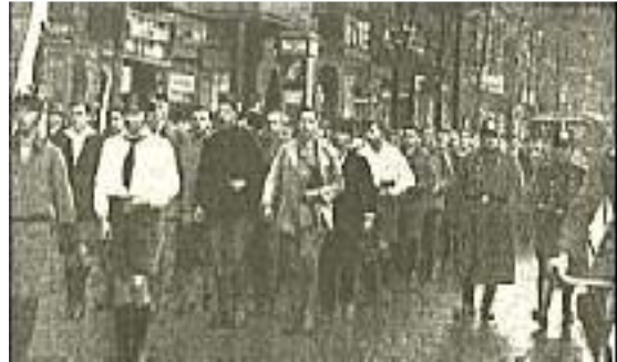
Hitler-Jugend marschiert durch den roten Südosten

Diese himmelschreiende Verantwortungslosigkeit mußte sich vor allem in Berlin selbst furchtbar und folgenschwer auswirken. Diese Vier-Millionen-Stadt bietet für lichtscheue politische Elemente den bequemsten Unterschlupf. Hier sitzt der Marxismus seit Jahrzehnten fest verankert in sicheren Positionen. Hier hat er seine geistige und organisatorische Zentrale. Von hier aus ist das Gift ins Land hineingegangen. Hier hat er die Massen in der Hand und eine weitverzweigte politische Presse zur Verfügung. Hier steht die Polizei in seinen Diensten. Hier kann man den Nationalsozialismus mit allen Mitteln niederhalten, und man ist letzten Endes ja auch dazu gezwungen; denn wenn der Nationalsozialismus Berlin erobert, dann ist es um die marxistische Vorherrschaft in ganz Deutschland getan.