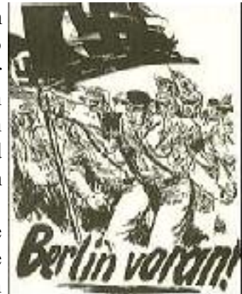
Berlin voran! Postkarte von Mjöltnir

Dieser junge Künstler hat das seltene Talent, nicht nur die bildnerische Darstellung, sondern auch die schlagkräftige Wortformulierung mit genialer Virtuosität zu meistern. Bei ihm entstehen Bild und Parole in derselben einmaligen Intuition, und beide zusammen ergeben dann eine mitreißende und aufrührerische Massenwirkung, der sich auf die Dauer weder Freund noch Feind entziehen können.