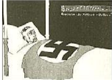
Horst Wessel Ein Toter ruft zur Tat!

Der SA.-Mann ist dazu ausersehen, die plastische Stärke und die volksverbundene Kraft der nationalsozialistischen Bewegung vor aller Welt und Öffentlichkeit zu zeigen, und wo man dagegen zum Angriff vorgeht, sie mit allen Mitteln zu verteidigen. Das war zur damaligen Zeit zwar leichter gesagt als getan; denn der Marxismus nahm für sich allein das Recht auf die Straße in Anspruch, und er empfand es