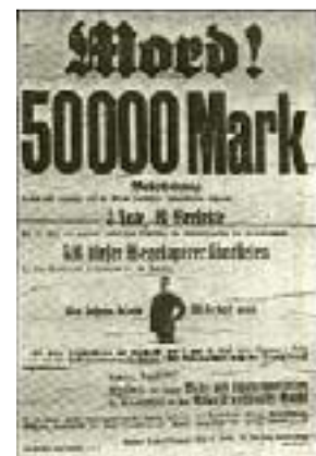
So arbeitet Rot-Mord! 2

Ein blinder Zufall wollte, daß in demselben Zug, der die SA. von Trebbin nach Lichterfelde-Ost transportieren sollte, größere Kommandos des Roten-Frontkämpfer-Bundes saßen, die von einer politischen Kundgebung in Leuna zurückkehrten. Die IA, die sonst immer so hurtig bei der Hand ist, wenn es gilt, Nationalsozialisten zu überwachen oder eine unserer politischen Reden nach Gesetzesverletzungen hin zu überprüfen, hatte sich der sträflichen Fahrlässigkeit schuldig gemacht, die extremsten politischen Gegner für eine nahezu einstündige Fahrt in einen gemeinsamen Zug hineinpfuschen zu lassen. Damit waren blutige Zusammenstöße bei der Hochspannung der politischen Atmosphäre in Berlin unvermeidlich geworden. Schon beim Besteigen des Zuges in