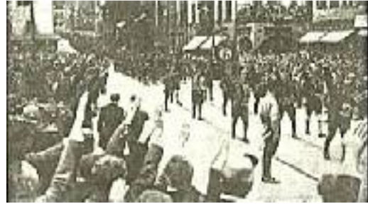
Die sturmerprobte Berliner SA. im Vorbeimarsch in Nürnberg (August 1927).

Und dann kommt der Abend, müde und schwer. Es beginnt zu regnen. In einer hinreißenden Schlußkundgebung des Delegiertenkongresses wird noch einmal die gesammelte