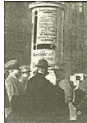
Plakat zur Versammlung am 4. Mai 1927

Ich persönlich hatte dem ganzen Vorgang keine Bedeutung beigemessen. Ich sah nur von meinem erhöhten Platz aus, wie der Provokateur unter etwas unsanfter Nachhilfe den Saal verließ. Ich fuhr dann in aller Ruhe mit meiner Rede fort, indem ich das eigentliche Thema begann. Die Rede dauerte danach noch anderthalb Stunden, und da sich niemand zur Diskussion meldete, wurde die Versammlung darauf geschlossen. Eben wollten die Zuhörer in freudiger Begeisterung den Saal verlassen, als Polizei hereindrang, die natürlich von den friedlichen Besuchern mit Johlen und Pfeifen empfangen wurde. Ein Polizeioffizier bestieg