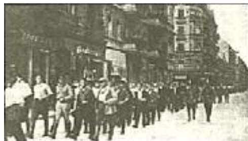
Die SA. marschiert!

Solange er für sich allein das Mandat beanspruchen konnte, die Massen zu führen und unter dem Druck der Straße politische Entscheidungen nach seinem Belieben zu erzwingen, hatte er keinerlei Anlaß, mit blutigen Mitteln gegen die bürgerlichen Parteien, die sich das ja schweigend gefallen ließen, vorzugehen. Als aber die nationalsozialistische Bewegung