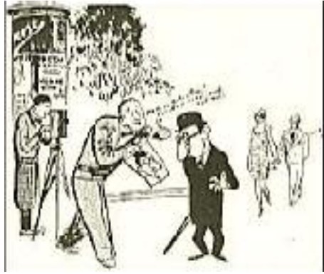
(Spruchtext: "Famos getroffen! Dutzend bedeutend billiger!")