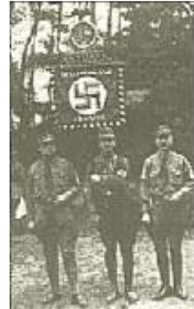
SA. Spandau (Standartenträger)

Das war das erstemal, daß das Pflaster der Reichshauptstadt vom Marschtritt der SA.-Bataillone erklang; die SA. war sich der Größe dieses Augenblicks voll auf bewußt. Quer durch Lichterfelde, Steglitz, Wilmersdorf erreicht der Zug das Zentrum des Westens und mündet zur Hauptverkehrsstunde mitten in die Judenmetropole, auf den Wittenbergplatz, ein.