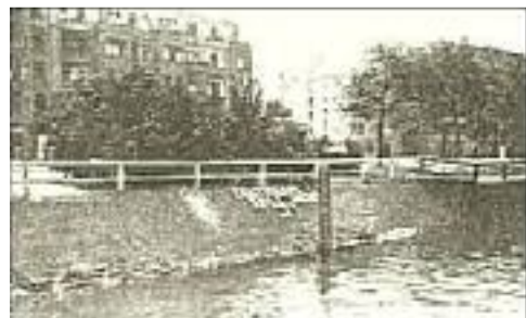
Ein stummer Appell

daß sein Normalzustand die, ob es sich hier nur um einen Akt der Trunkenheit oder um eine bezahlte Lockspitzelei handelte. Aber was nutzte das, nachdem die Partei verboten und die Pressekampagne abgeebbt war. Die Journaille hatte ihr Ziel erreicht, die Kanonade auf die öffentliche Meinung hatte diese zur Kapitulation gezwungen, man hatte einen lästigen politischen Gegner mit den Mitteln der Staatsgewalt aus dem Weg geräumt und durch eine künstlich