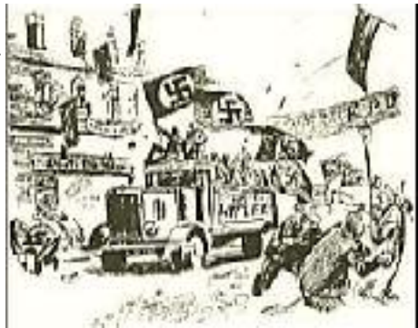
Her zu Hitler!

Wir haben vor den Widerständen nicht kapituliert. Wir haben die Widerstände gebrochen, und zwar immer mit den Mitteln, mit denen man sich uns entgegenstellte. Unerbittlich und hart wurde die Bewegung in diesem Kampf. Das Schicksal selbst hat sie mit schwerem Hammer eisern geschmiedet. In jungen Jahren schon war sie einer Verfolgung preisgegeben, unter der jede andere Partei in Deutschland zusammengebrochen wäre.