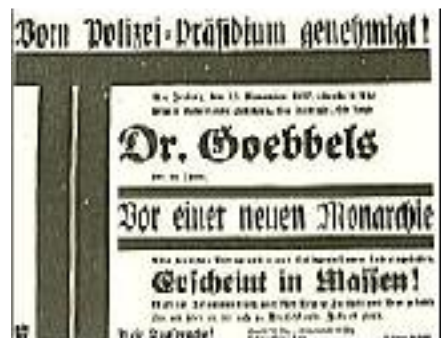
Vom Polizeipräsidium genehmigt!

Herbeigeeilt von Schraubstock und Maschine, von Kontorschemel und Fabriktsch, aus den hellen Häusern des Westens und den finsternen Höfen der