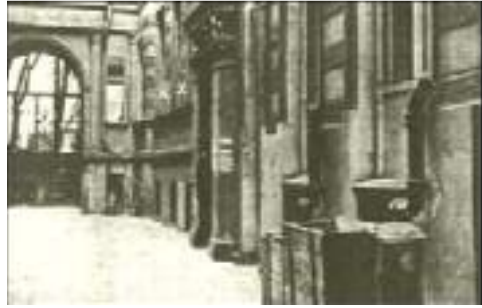
Die "Opiumhöhle" (XX) Erste Geschäftsstelle der NSDAP. in Berlin, Potsdamer Straße 109

Wir nannten diese Geschäftsstelle die "Opiumhöhle". Und diese Bezeichnung schien in der Tat absolut zutreffend zu sein. Sie war nur mit künstlichem Licht zu erhellen. Sobald man die Tür aufmachte, schlug einem der Schwaden von schlechter Luft, Zigarren-, Zigaretten- und Pfeifenqualm entgegen. An ein solides und systematisches Arbeiten war hier selbstverständlich gar nicht zu denken.