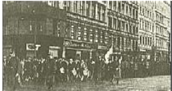
Die Hitler-Jugend marschiert

Er bediente sich von früh auf moderner Propagandamittel: des Flugblattes, des Plakates, der Massenversammlung, der Straßendemonstration. Dabei mußte er sehr bald dem Marxismus begegnen. Zwangsläufig ergab sich die Notwendigkeit, ihn zum Kampf herauszufordern; und es blieb uns am Ende nichts anderes übrig, als uns derselben Mittel zu bedienen, die der Marxismus zur Anwendung brachte, wollten wir den Kampf erfolgreich zu Ende führen.