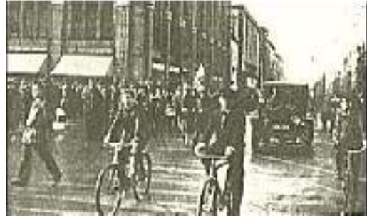
Marsch durch das rote Neukölln

Wie oft mußten wir es erleben, daß unsere SA.-Männer, die nur das primitivste Recht der Notwehr, das jedem Menschen zusteht, für sich in Anspruch genommen hatten, vor die Gerichte gestellt und als Landfriedensbrecher zu schweren Gefängnis- und Zuchthausstrafen verurteilt wurden. Man kann verstehen, daß unter diesen Umständen auf die Dauer die Empörung in der nationalen Opposition bis zur Siedehitze steigt. Man nimmt dem nationalen Deutschland die Waffen, mit denen es sich selbst gegen den Terror zur Wehr setzen könnte. Die Polizei versagt ihm den ihm staatsbürgerlich zustehenden Schutz für Leben und Gesundheit; und verteidigt der friedliebende Mensch schließlich in der letzten Verzweiflung sein Leben mit den blanken Fäusten, dann wird er obendrein noch vor den Richter geschleppt.