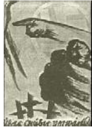
Über Gräber vorwärts Postkarte von Mjölneur

Selbstverständlich nahmen die marxistischen Parteien das nicht kampf- und widerspruchslos hin. Sie setzten sich dagegen zur Wehr, und da sie unserer scharf durchdachten, logischen politischen Beweisführung nichts an geistigen Argumenten entgegenzustellen hatten, mußten sie an die rohe Gewalt appellieren. Die Bewegung wurde von einem blutigen Terror bedroht, der bis zum heutigen Tage nicht nur nicht nachgelassen hat, sondern sich von Monat zu Monat und von Woche zu Woche verstärkt. Vor allem damals, als die Partei in Berlin noch klein und unansehnlich war, hatte die SA. als Trägerin des aktiven Kampfes unserer Bewegung Unerträgliches zu erdulden. Der SA.-Mann war schon damit, daß er das Braunhemd anzog, für die Öffentlichkeit zum politischen Freiwild gestempelt. Man schlug ihn auf den Straßen blutig und verfolgte ihn, wo er sich nur zu zeigen