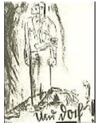
Und doch! Postkarte von Mjönir

Vielleicht wird das Bürgertum uns noch einmal auf den Knien danken, daß wir das Recht auf freie Meinungsäußerung auch auf der Straße unter blutigem Einsatz in Deutschland wieder erkämpft haben. Vielleicht werden einmal die bürgerlichen Gazetten in uns die wahren