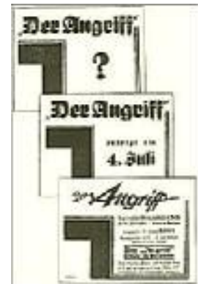
Wirksame Säulenreklame zum Erscheinen des "Angriff"

In der letzten Juniwoche erschienen an den Plakatsäulen in Berlin mysteriöse Anschläge, über die sich manch einer den Kopf zerbrach. Wir hatten unseren Plan so geheim wie möglich gehalten, und es war uns in der Tat gelungen, ihn den Augen der Öffentlichkeit gänzlich zu entziehen. Ein großes Erstaunen ging durch Berlin, als eines Morgens an den Litfaßsäulen auf blutroten Plakaten in lakonischer Kürze zu lesen stand: "Der Angriff" ! Man war betroffen, als ein paar Tage später ein zweites Plakat erschien, auf dem die mysteriöse Andeutung des ersten zwar erweitert wurde, ohne aber dem Uneingeweihten die Möglichkeit zu geben, sich restlos Klarheit zu verschaffen. Dieses Plakat lautete: "Der Angriff erfolgt am 4. Juli."