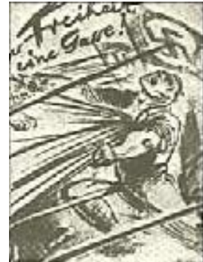
Der Freiheit eine Gasse! Postkarte von Mjölner

Der Kampf um die Reichshauptstadt wurde mit einem Schlag im ganzen Land populär. Die Bewegung des Reiches nahm innigsten Anteil daran und verfolgte mit zitterndem Herzen den atemberaubenden Vormarsch der Partei in Berlin.