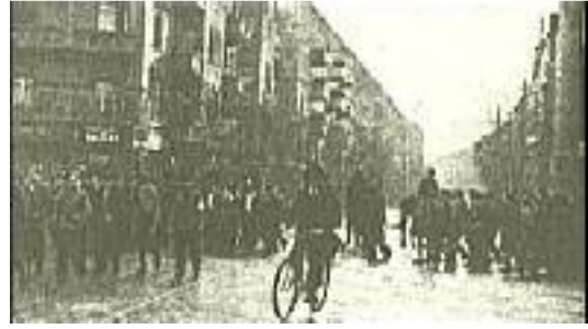
Eine gefährliche Ecke

Man tut das mit ein paar Zeilen in irgendeiner verschwiegene Zeitungsecke ab. Man läßt eine solche Mitteilung ohne jeden Kommentar. Man tut so, als müßte das so sein. Die marxistischen Gazetten bringen meistens überhaupt nichts davon. Sie verschweigen mit System alles, was ihre eigenen Organisationen belastet; und werden sie durch peinliche Umstände zum Reden gezwungen, so drehen sie den wahren Sachverhalt ins glatte Gegenteil um, machen den Angreifer zum Angegriffenen und den Angegriffenen zum Angreifer, schreien Zeter und Mordio, rufen nach der Staatsgewalt, machen die öffentliche Meinung mobil gegen den Nationalsozialismus und wettern gegen einen parteipolitischen Terror, den sie selbst erst erfunden und in die Politik eingeführt haben. Und wird erst einmal einem marxistischen Mörder in der Notwehr ein Härchen gekrümmt, dann heult die ganze Presse auf vor Wut und Empörung. Die Nationalsozialisten werden als gemeine Bluthetzer und Arbeitermörder hingestellt, ja man verleumdet sie, daß sie aus bloßer Lust am Blutvergießen harmlose Passanten zusammenknüppeln und niederschießen.