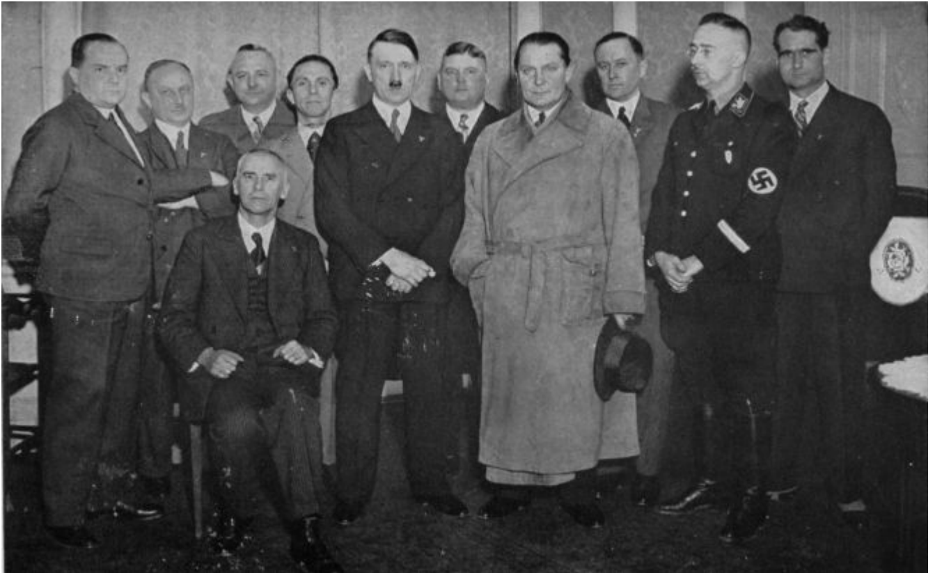
Ilustración 3 - Hitler y sus inmediatos colaboradores en la campaña electoral del Reichstag en 1932. A la derecha Hess.