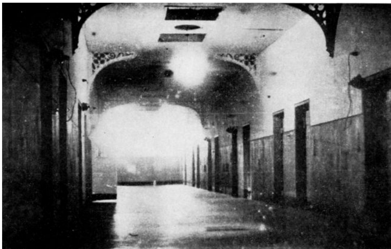
Ilustración 8 - Galería de la cárcel de Spandau y en cuya celda n.º 7 cumple su condena Hess.