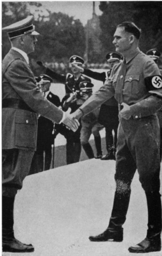
Ilustración 6 - Hitler, es recibido por Hess, a su llegada al estadio de Nuremberg.