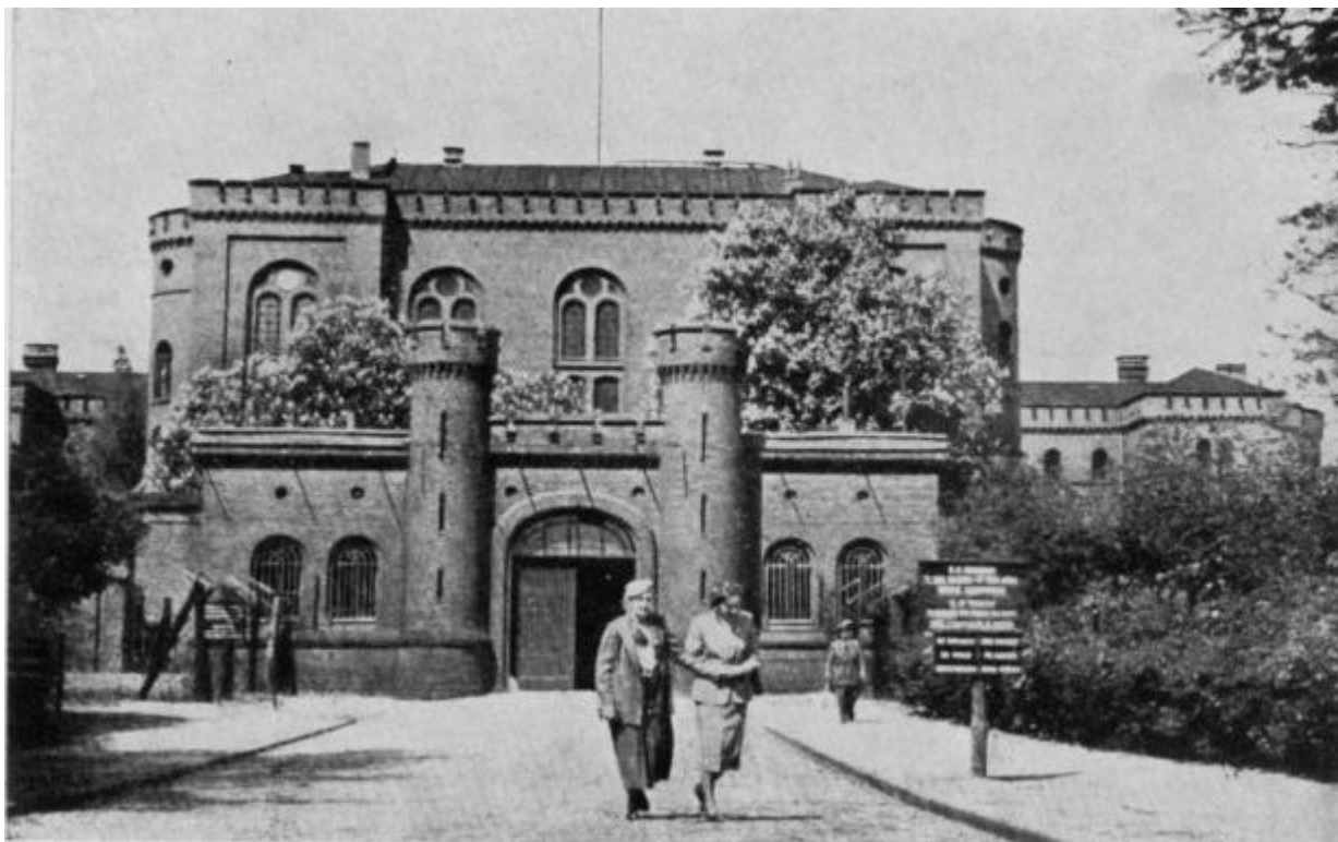
Ilustración 7 - Puerta de la cárcel de Spandau.