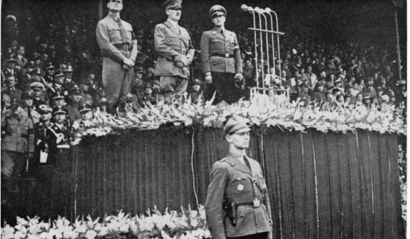
Ilustración 5 - Hess, a la derecha de Hitler, en el «Día de la juventud» en 1938.