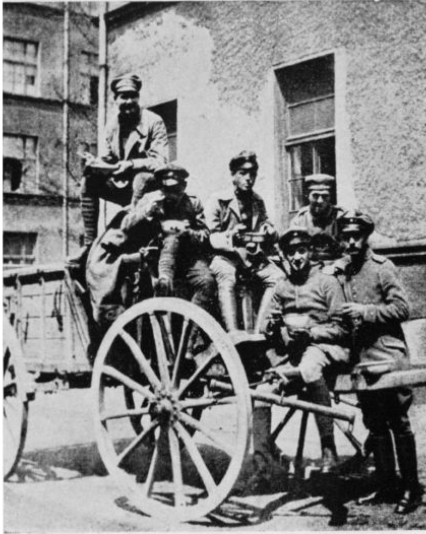
Ilustración 1 - Hess, con un grupo de soldados en 1919.