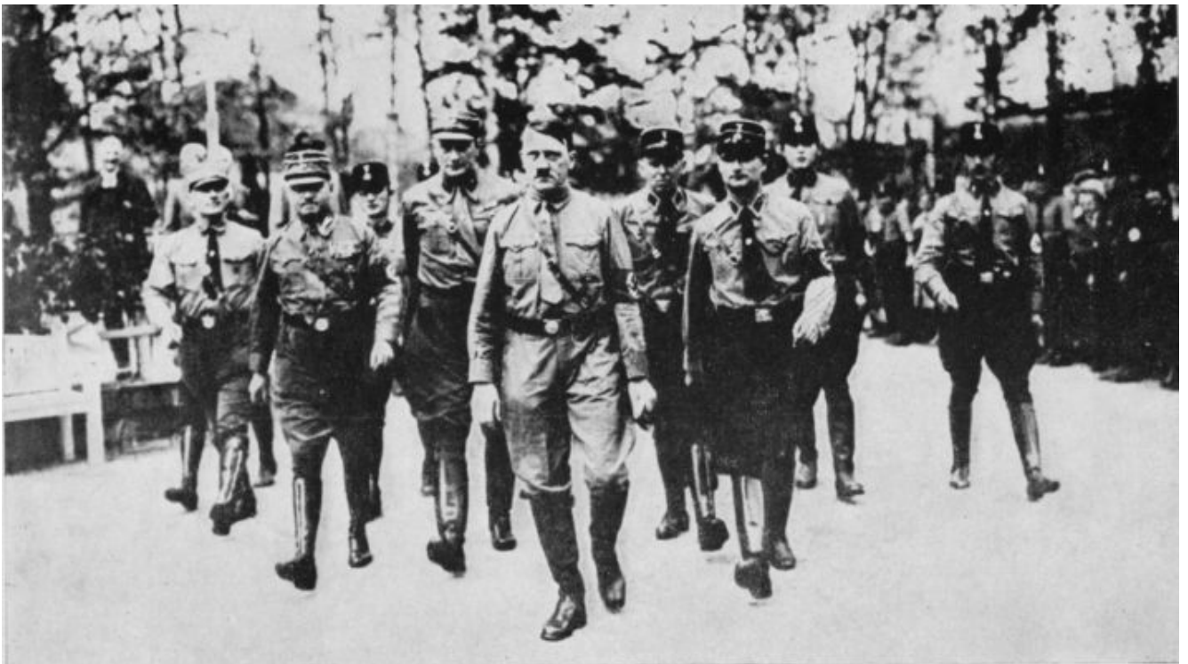
Ilustración 2 - Hitler, seguido de Roehm, Goering y Hess, llegan a Bad Harzburg en 1931.