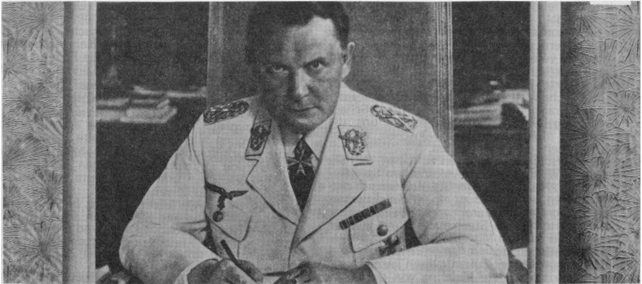
Hermann Görings letzter Brief an Winston Churchill

Daß der nachfolgende Brief Görings an Churchill aus der Todeszelle am 1. Oktober 1946 tatsächlich authentisch ist, hat der britische Historiker David Irving in der "Welt am Sonntag" Nr. 46, 1971 erstmals bestätigt.