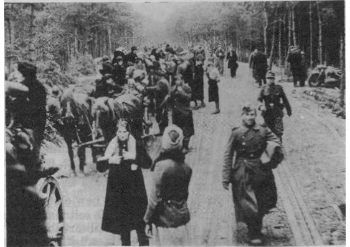
Flüchtlings-Vertreibungstreck Jan./Febr. 1945 im Raum von Braunsberg

Doch wichtig für uns ist zu wissen, daß alle jene Massenmorde, Entrechtungen, Wilderermethoden die "legalen" Maßnahmen jener waren, die auch in Nürnberg dieses gleiche "Recht" sprachen. Moral und Weltöffentlichkeit störten sie dabei nicht, ihre Skrupel waren schon lange vorher abgelegt, - sie hatten ja die Macht, und das reichte.