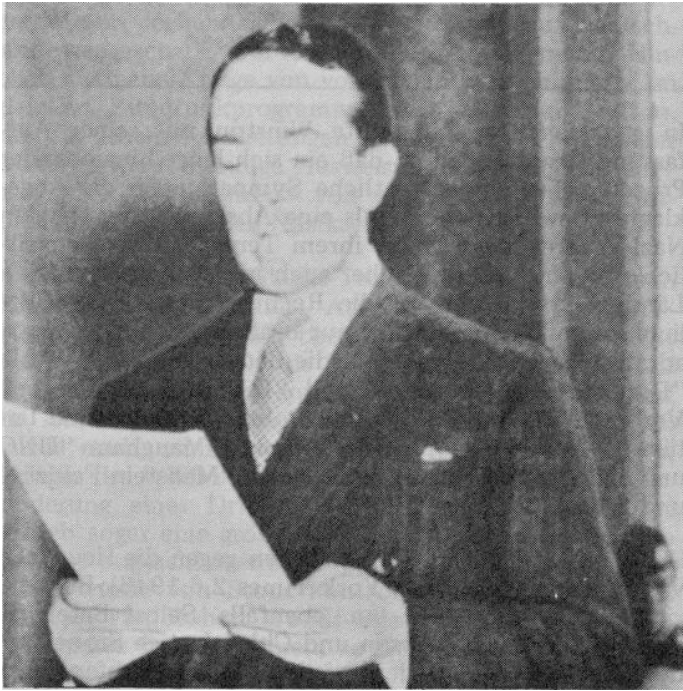
Der britische Hauptankläger Shawcross

ung "bezeichnen" und unter diesem Vorwand gegen Deutschland militärisch vorgehen sollte. Doch es geht noch weiter: England und Frankreich boten am 22.8.1939 den Sowjets den Einmarsch in Estland, Lett-