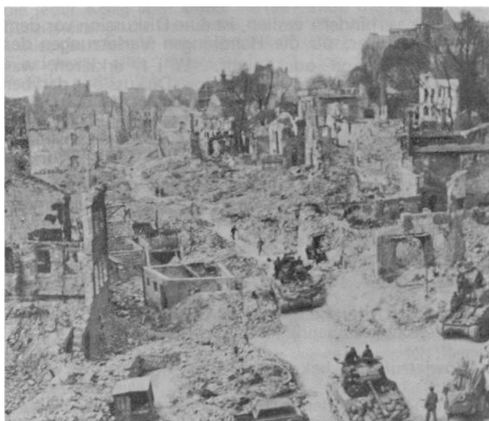
Nürnberg 1945. Erst mit einem so niedergeworfenen Volk konnte man das machen

Nach Version der alliierten Siegermächte: "Kriegsverbrecher" Nr. 1 auf der Auslieferungsliste der Versailler Sieger - Generalfeldmarschall von Hindenburg, seit 1925 Reichspräsident der Weimarer Republik, mit Adolf Hitler "Nr.1" der Nachfolgeliste für den Zweiten Weltkrieg