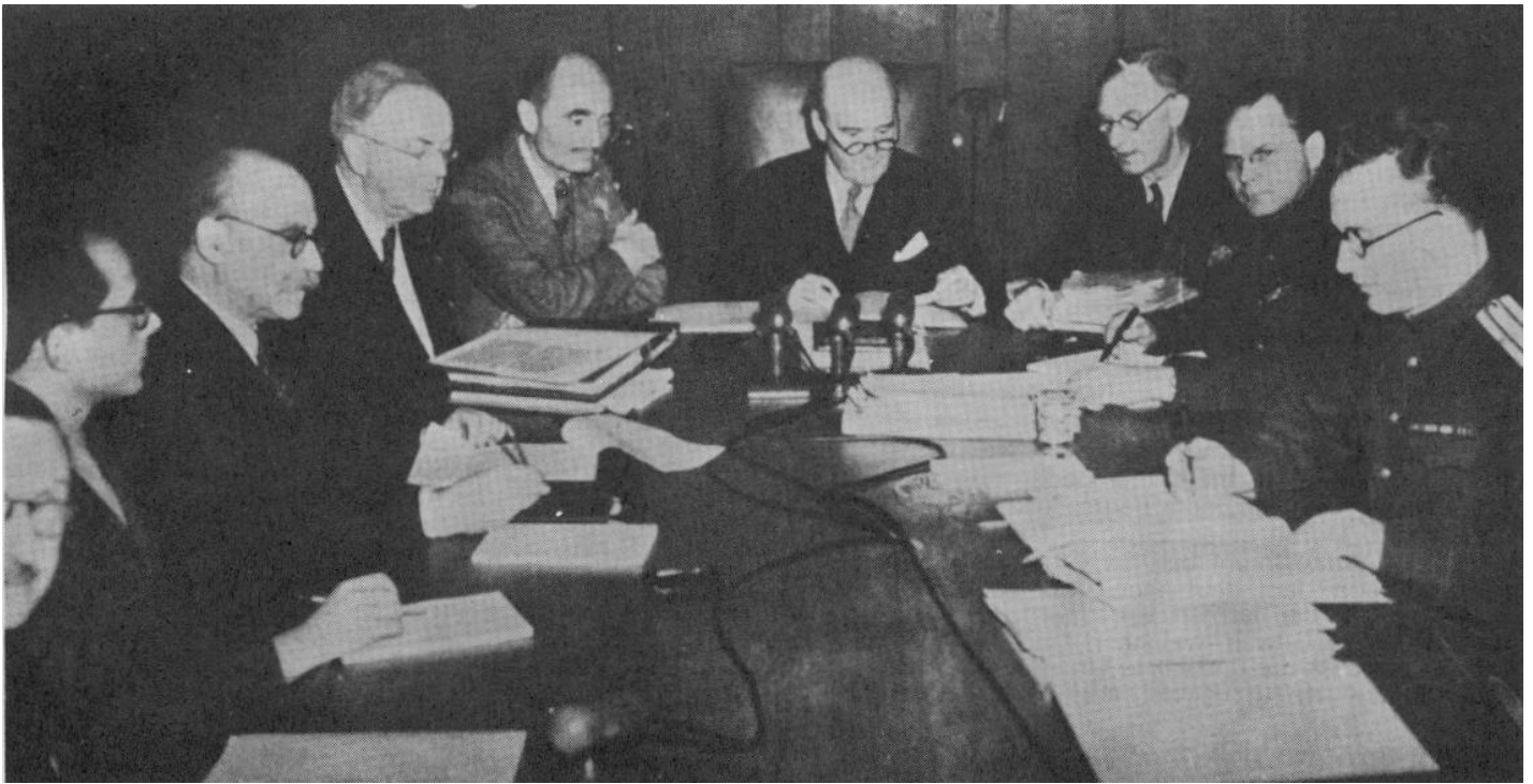
Die Richter des "Internationalen Militärtribunals": v.lks. n. r.: Falco und de Vabres (Frankreich), Parker und Biddle (USA), Lawrence und Birkett (England), Nikitschenko und Volchkow (UdSSR)