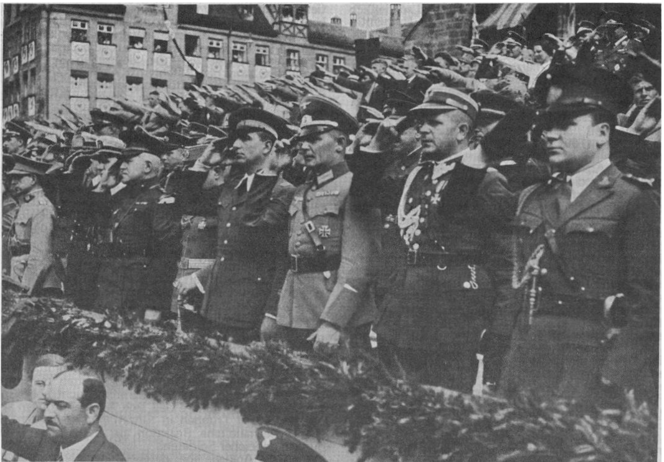
Ausländische Militärattaches auf dem Parteitag in Nürnberg 1934

Das Korps der Politischen Leiter der NSDAP, soweit ihre Mitglieder Leiter von Büros im Stabe der Reichslei-