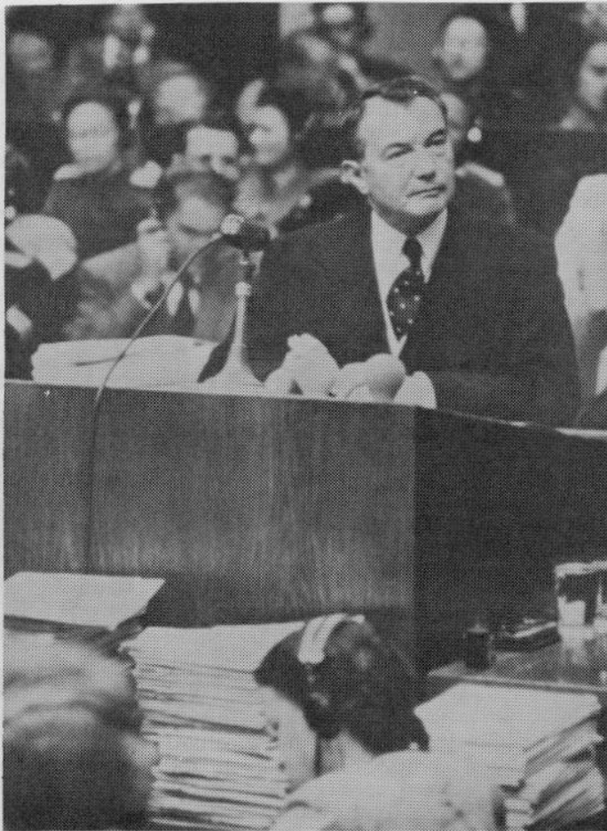
Der amerikanische Hauptankläger Robert H. Jackson