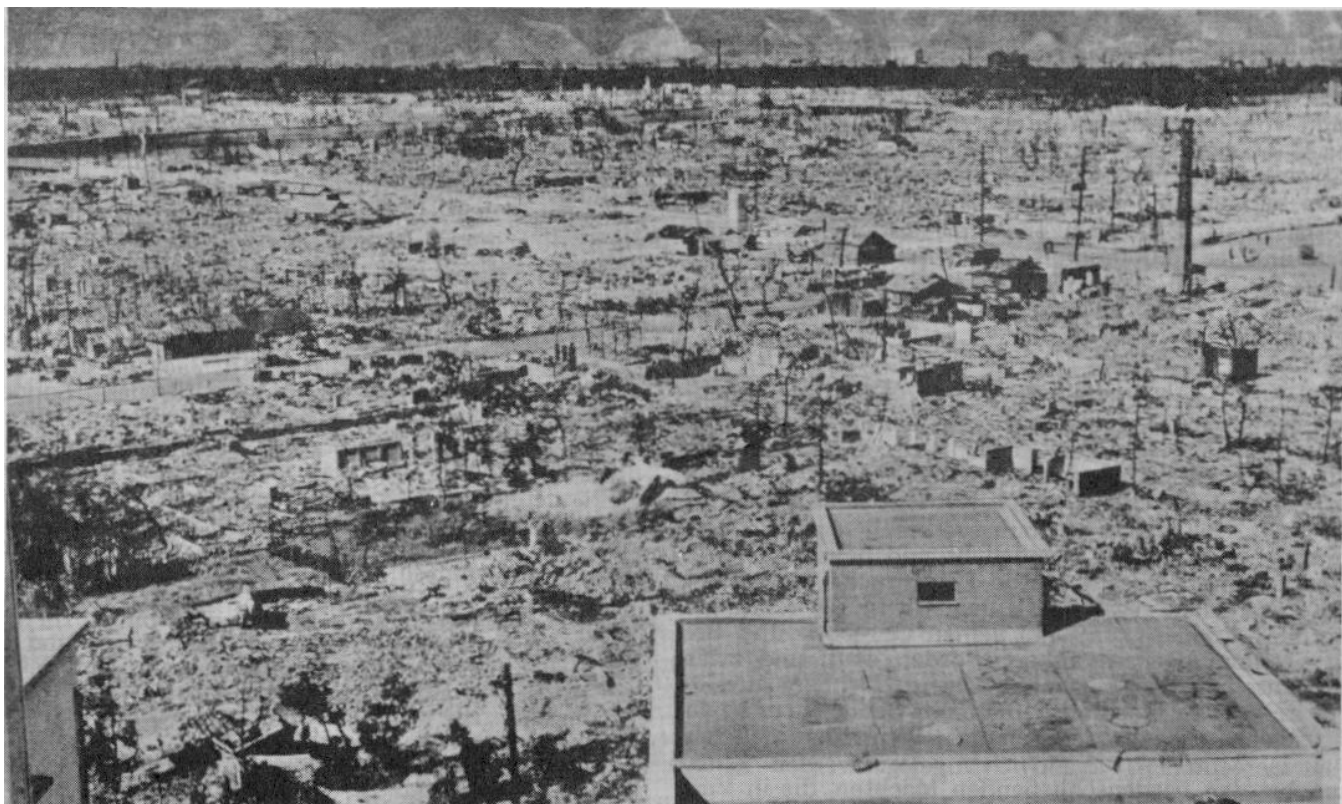
Hiroshima nach dem Atombeschlag im August 1945

Doch in Wirklichkeit hatte das Ganze mit Gerechtigkeit von Anfang an nichts zu tun, dafür umso mehr mit dem umfassenden Programm der "Umerziehung" des deutschen Volkes, wobei es im Prinzip gleichgültig war, wer auf der Nürnberger Anklagebank des "Haupt - Kriegsverbrecher - Prozesses" saß, denn "die ganze Nazi - Philosophie" war angeklagt, und der "Automatic - Arrest" sorgte dafür, daß diese gleiche Art von "Gerechtigkeit" unter grundsätzlicher Ausschaltung jedweder neutralen Beurteilung gegenüber der gesamten Führungselite des deutschen Volkes praktiziert wurde, einschließlich (zum beachtlichen Teil ) auch der Frauen.