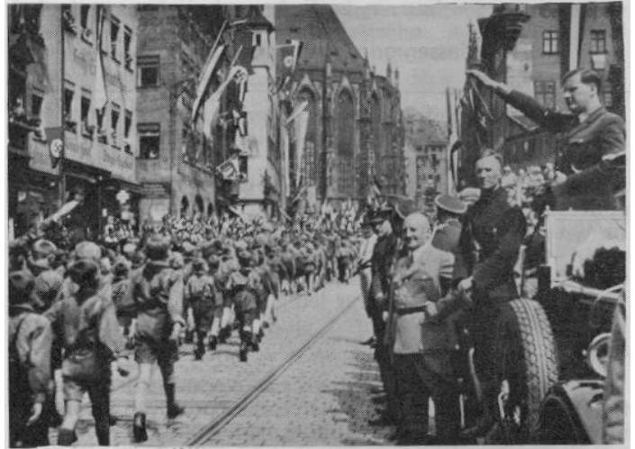
Nürnberg 1933: Pimpfe im Vorbeimarsch vor Baldur v.Schirach und Julius Streicher, beide 1945 unter Anklage vor dem IMT