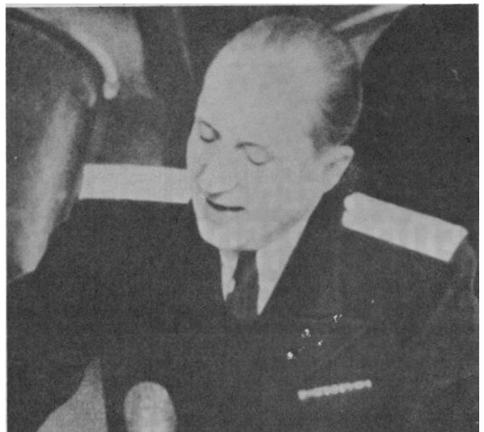
Der sowjetische Hauptankläger Rudenko

Die von der Iswestia verwendeten britisch-französischen Argumente, daß der Krieg verlängert werden müsse, um den Hitlerismus zu vernichten, "lassen uns zu den düsteren Zeiten des Mittelalters zurückkehren, als vernichtende Religionskriege ausgefochten wurden, um Ketzer und Menschen anderer Religion auszurotten"..... "Es ist unmöglich, irgendeine Idee oder eine Meinung mit Feuer und Schwert auszurotten... Man mag den Hitlerismus respektieren oder hassen oder irgendein anderes System einer politischen Meinung. Das ist eine Frage des Geschmacks. Aber einen Krieg zu beginnen zur 'Ausrottung des Hitlerismus' bedeutet, kriminelle Dummheit in der Politik zuzulassen."