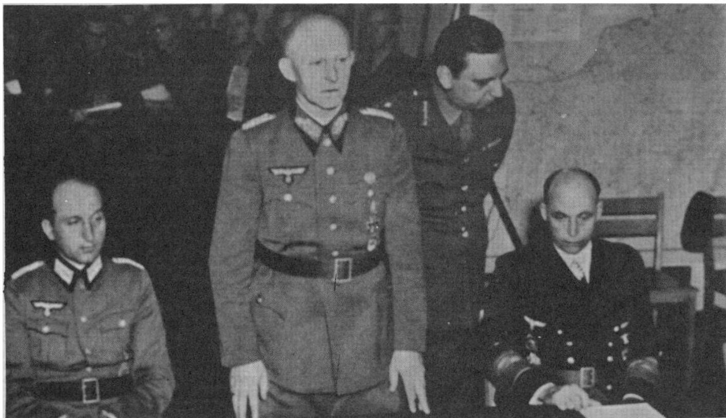
Generaloberst Jodl unterzeichnet die deutsche Kapitulation in Reims