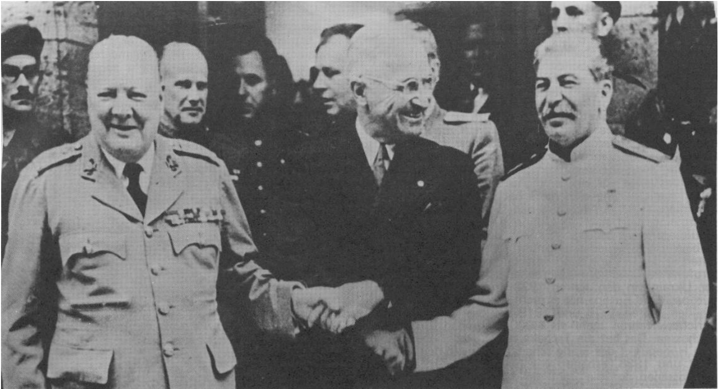
Drei Kriegsverbrecher - Massenmörder beglückwünschen sich zu ihrem Tun in Potsdam 1945: Winston Churchill - Harry Truman - Josef Stalin