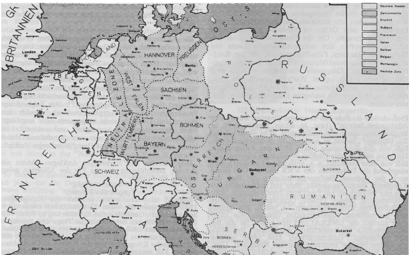
Französische Kriegszielkarte aus dem I. Weltkrieg : "Oder - Neiße" - Linie als Grenze zwischen Deutschland und Polen. Es bedurfte nur noch eines weiteren Vorwandes.

Die ersten Kriegsverbrechen, ja Massenkriegsverbrechen wurden von den Polen und den Sowjets, von letzteren nicht nur gegenüber Deutschen, sondern auch gegenüber Polen, Ukrainern, Balten vornehmlich begangen. Dann schlossen sich die Engländer mit ihrem neuen Premier