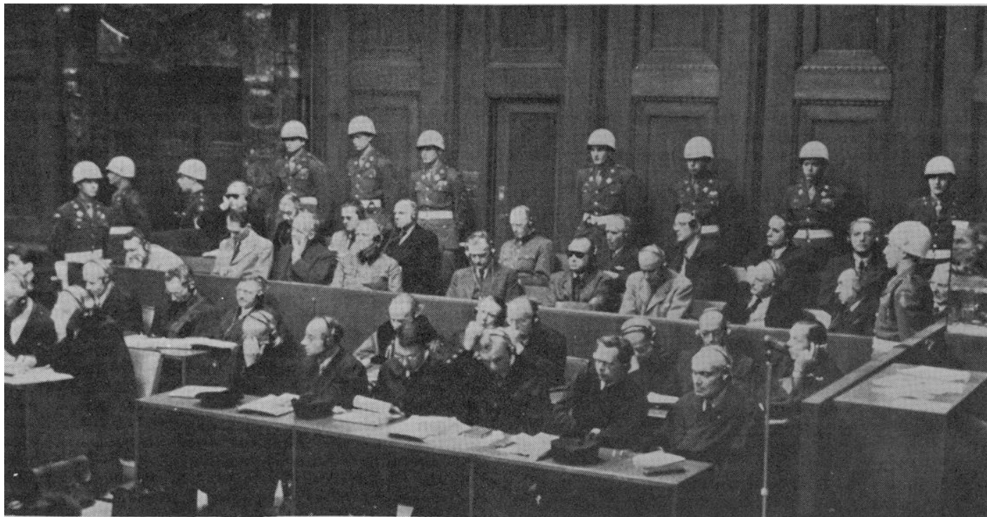
Die Angeklagten im Nürnberger Hauptprozeß: Vordere Reihe v. l. n. r. Göring, Heß, v. Ribbentrop, Keitel, Rosenberg, Frank, Frick, Streicher, Funk, Schacht,

1.) Sein Verteidiger war ein sich freiwillig zur Verfügung stellendes britisches Parlamentsmitglied, Rechts-