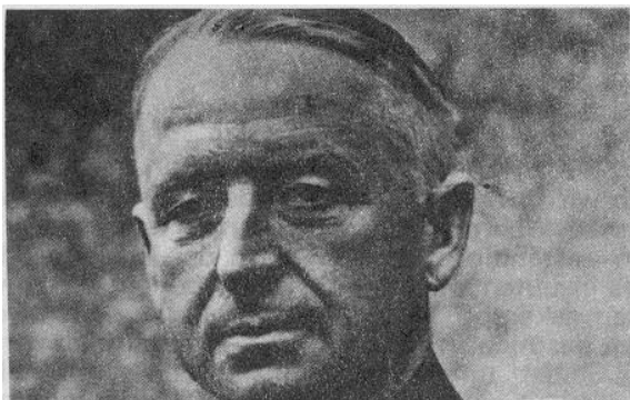
Generalfeldmarschall von Manstein

Wir Historiker sind heute solchen Behinderungen nicht mehr unterworfen wie die Richter des "Internationalen Militär Tribunals". In diesem kurzen Überblick hoffen wir, so umfassend und objektiv wie möglich die irritierende Sachlage von Nürnberg zu prüfen. Wir hoffen, in nüchterner wissenschaftlicher Analyse einen Aspekt der modernen Geschichte zu beleuchten, der schon allzu lange in den Schatten gedrängt war.