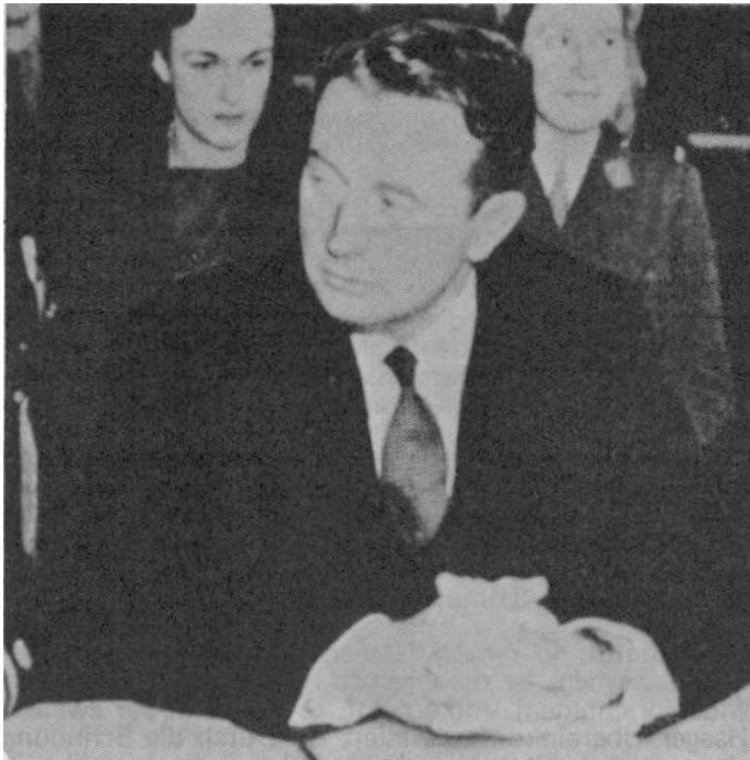
Der französische Ankläger Dubost

Doch das reichte nicht, um alle jene "zu bestrafen", die man zu bestrafen wünschte. Neue, weitere Formulierungen mußten gefunden werden.