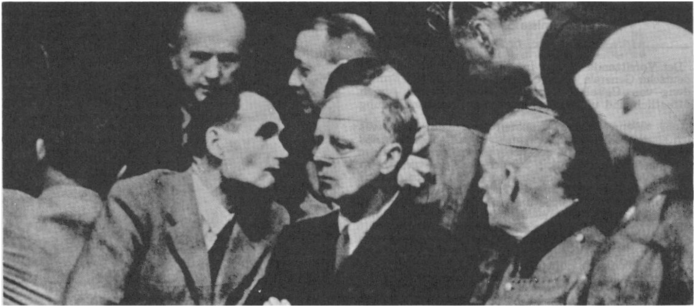
Auf der Anklagebank: v.lks.n.r. Göring, Heß, v.Ribbentrop, Keitel, Dönitz, Raeder, v.Schirach