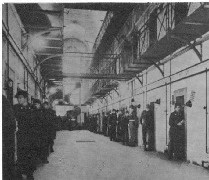
Prominentenbewachung in Nürnberg

..... Sie sollten einmal nach Nürnberg gehen! Dort können Sie einen Justizpalast sehen, in dem 90 % der Anwesenden nur an Strafverfolgung interessiert sind!