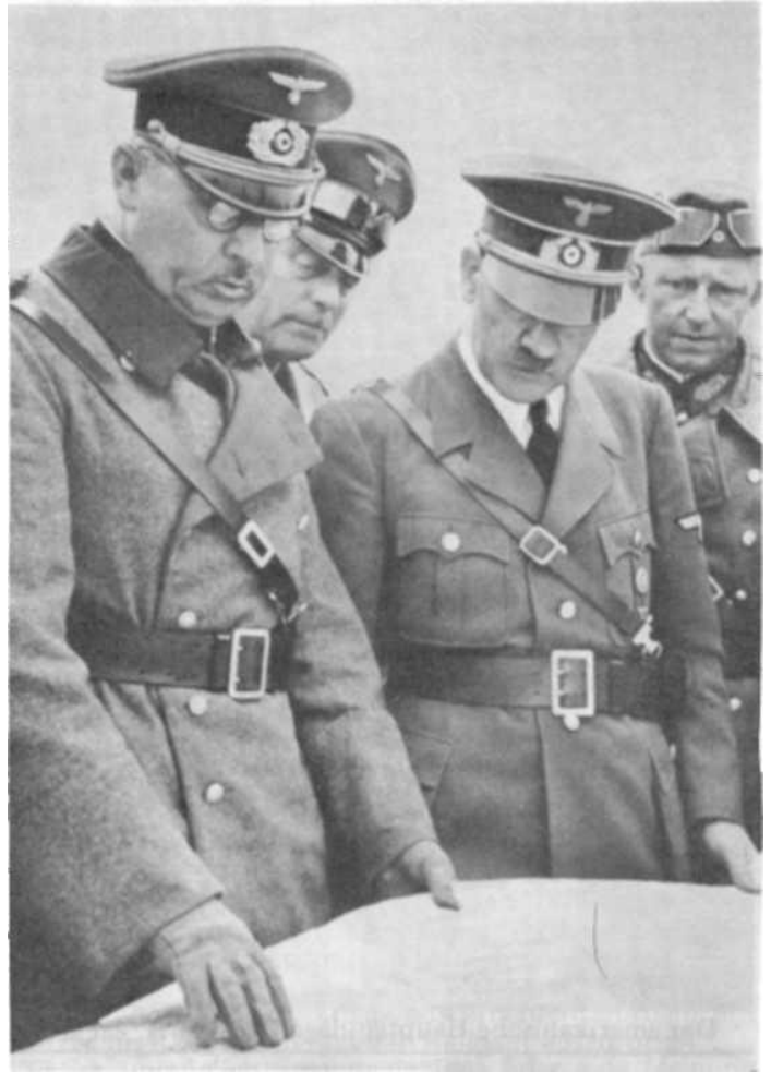
Generaloberst List bei einer Lagebesprechung während des Polenfeldzuges. Anwesend auch die 1946 in Nürnberg hingerichteten Generalfeldmarschall Keitel und Generaloberst Jodl

Um zu einer gerechten Würdigung zu kommen, ist weiter erforderlich, die inneren Verhältnisse zu berücksichtigen, unter denen zu dienen wir gezwungen waren. Wir waren durch unseren Eid und die Gehorsamspflicht gebunden: und wir lebten unter dem Zwang einer sich mehr und mehr dämonisch wie chaotisch gestaltenden Diktatur: in einer Diktatur, in der trotzdem ein starkes Neben- und Gegeneinander herrschte, in der aber dem einzelnen nur geringste Handlungsfreiheit gelassen war; in einer Diktatur, von der sich der Außenstehende keine Vorstellung machen kann, am wenigsten der freie Bürger einer freien Demokratie. Auch können die ganzen Zusammenhänge nicht verstanden werden, ohne einen Blick zu tun auf den Hintergrund des damaligen Geschehens. Gegen uns standen im wesentlichen die glei-