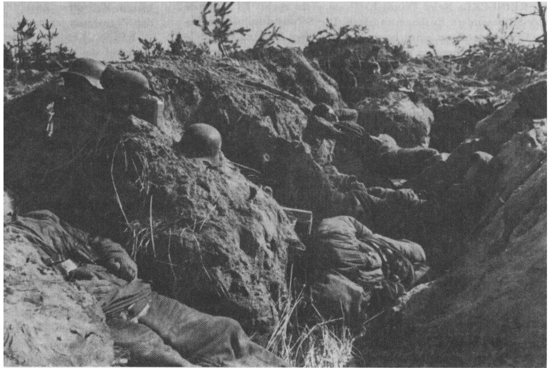
Alltag des deutschen Landsers in Rußland

Der Zuständigkeit des SS-Gerichtswesens waren entzogen die Häftlinge der Konzentrationslager selbst. Für diese war ausschließlich die allgemeine deutsche Justiz zuständig. In gewissem Umfange oblag die Rechtsprechung der SS-Gerichtbarkeit auch bezüglich der in den Konzentrationslagern befindlichen politischen Abteilungen mit der Maßgabe, daß die Untersuchungs-