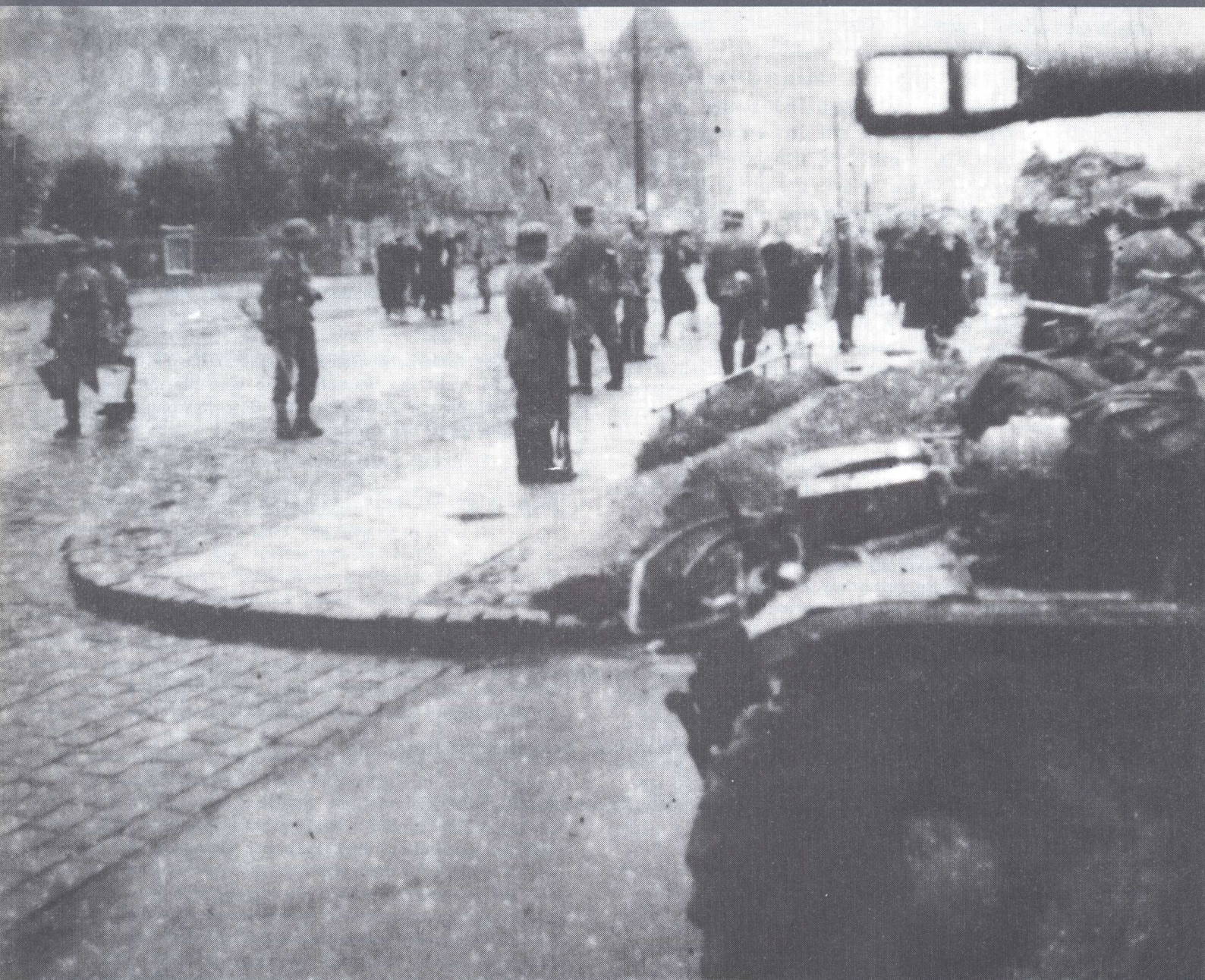
Kampfszene im Warschauer Aufstand, August 1944