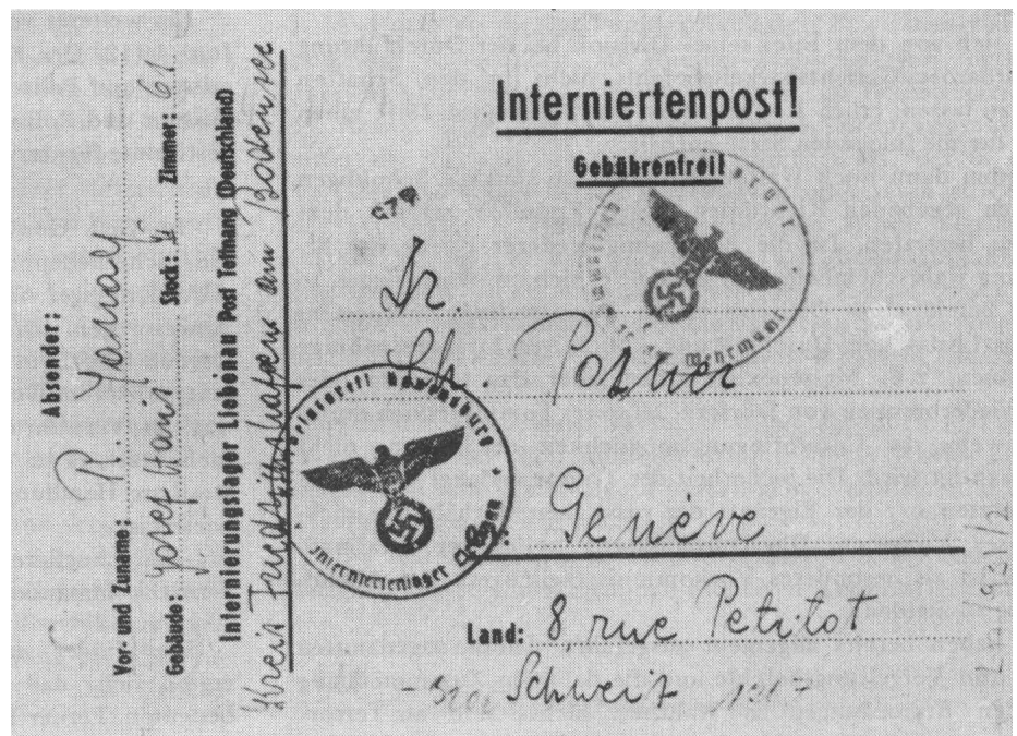
Postkarte eines im Arbeitslager Liebenau (Süddeutschland) internierten polnischen Juden an den Kodirektor des Genfer Palästinabüros; der Absender bittet um die Ausstellung eines Palästina-Zertifikats für seine vierjährige Tochter, deren Fotografie er auf die Rückseite der Karte geklebt hatte. Die Karte trägt sowohl den Stempel der Lagerverwaltung als auch den des deutschen Zensors.