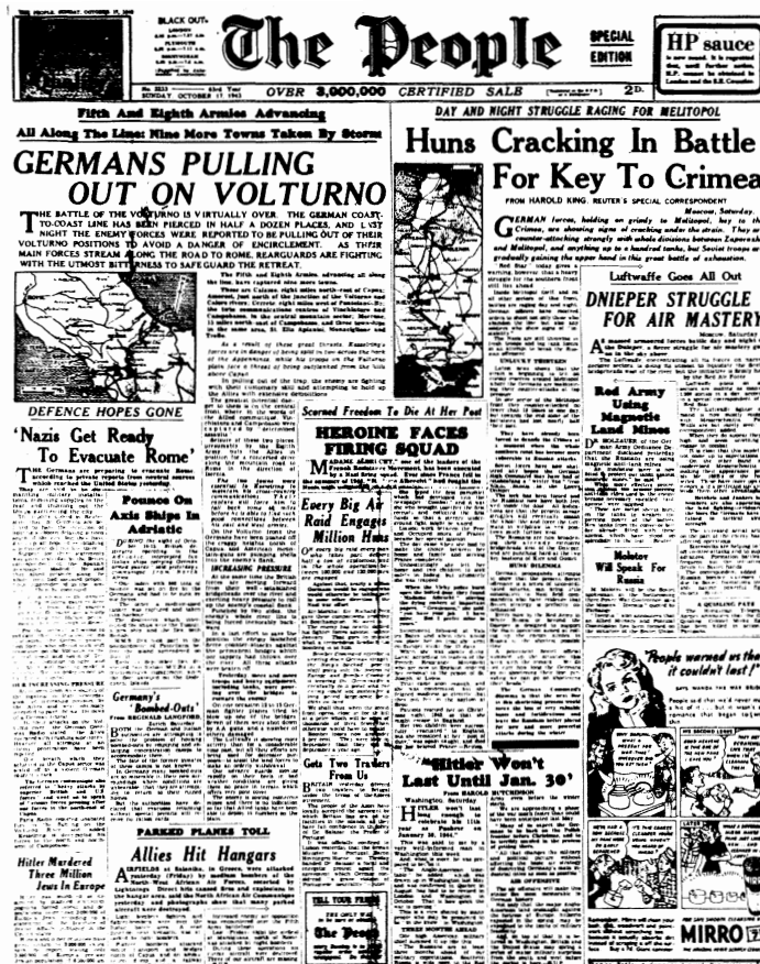
Dieser kleine Ausschnitt ist rechts vergrößert