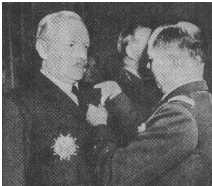
Verantwortlicher für den zivilen Massenmord : Luftmarschall Sir Arthur Harris: wurde Großoffizier der Ehrenlegion. — Ein Kriegsverbrecherprozeß wäre angebracht gewesen.

REINECKE: Die Auswertung ist unter meiner Leitung vorgenommen worden von 15 zum Richteramt befähigten SS-Interneuten. Ausgewertet wurden ca. 170.000 eingereichte Erklärungen. Davon sind 136.213 eidesstattliche Versicherungen und Zeugenschaftsanträge zu einer Dokumentensammlung zusammengestellt worden. Der Rest sind bloße Bitten um Vernehmung und so weiter. Diese 136.000 Erklärungen sind in der zusammengestellten Dokumentenmappe aufgeteilt in verschiedene Teilgebiete, die die Beantwortung der Fragen der Verteidigung von gegen die SS erhobenen Vorwürfen darstellt.