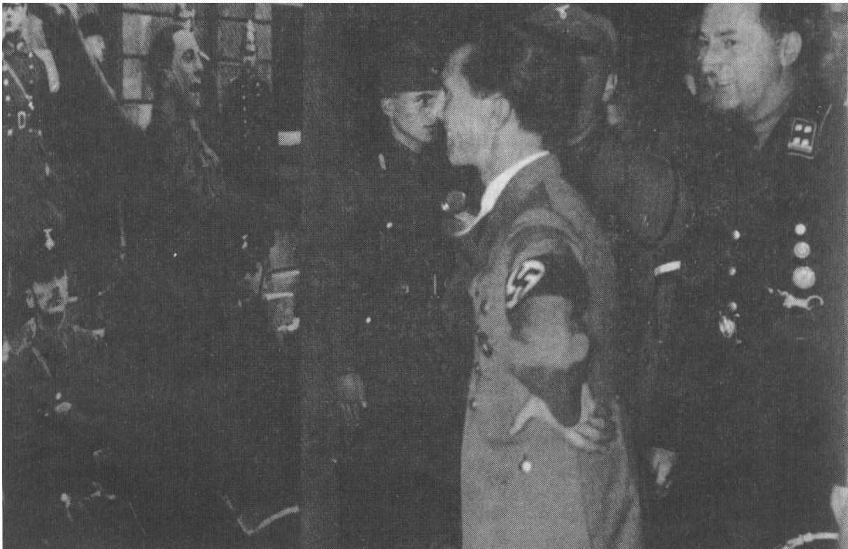
Dr. Joseph Goebbels, Reichsminister für Volksaufklärung und Propaganda, anlässlich einer Ausstellung, in der ein Foto seines Auftretens im Wahlkampf 1931 zu sehen ist, galt für Sefton Delmer, Schwarzmeister seiner Majestät von Großbritannien, als "Propagandazwerg". Er freilich muß es beurteilen können.