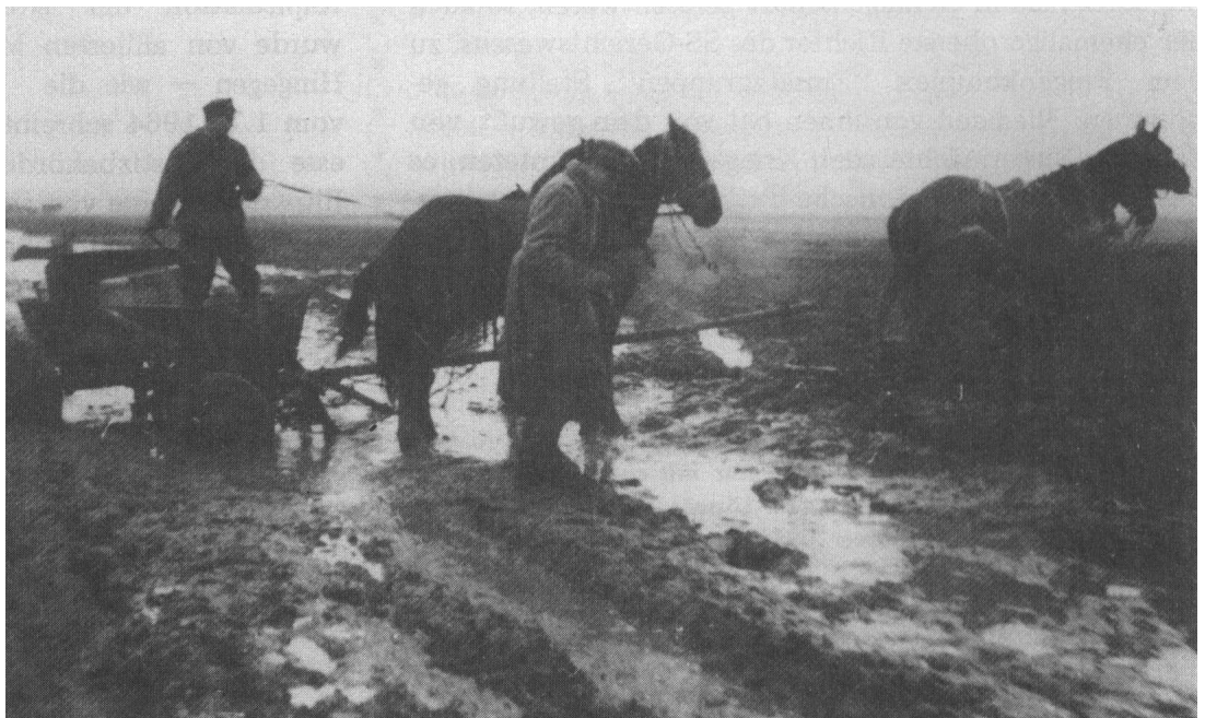
Vielfach tägliche Verhältnisse in Rußland, denen auch die Einsatzgruppen gegenüberstanden

VON MANSTEIN: Bei der Unterstellung, überhaupt bei jeder militärischen Unterstellung, unterscheidet man entweder eine taktische Unterstellung — das ist die Unterstellung für den Kampf an der Front — oder eine wirtschaftliche Unterstellung — das ist die Unterstellung für die Versorgung mit Verpflegung, mit Betriebsstoff und die Unterbringung —, drittens eine truppendienstliche Unterstellung — das heißt also die Unterstellung für die Ausbildung, für die Ausrüstung, in Personalfragen: disziplinar und gerichtlich. Diese letztere truppendienstliche Unterstellung ist uns nie, in keinem Falle — selbst nicht für die Verbände der Waffen-SS — zugebilligt worden. Wirtschaftlich und taktisch, das heißt für den Kampf, war eine solche Unterstellung möglich. Der