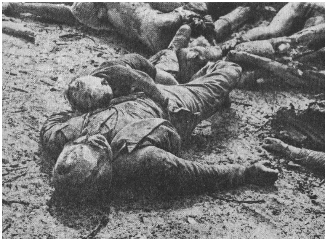
Nachgewiesene Ermordete des zivilen Bombenkrieges – hier in Kassel, Beispiel für tausende –

F.: Ich frage Sie über den SD, angenommen, daß dieser die