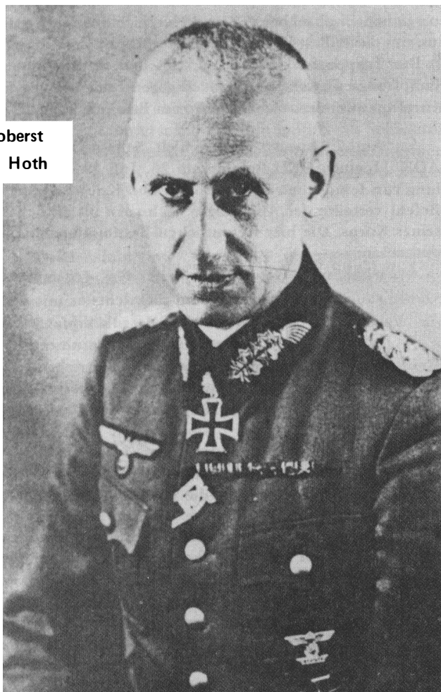
Generaloberst Hermann Hoth