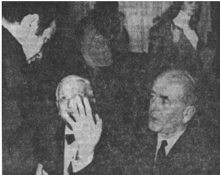
Rüstungsminister a.D. Albert Speer im Schwurgerichtssaal Hannover, Jan. 1971