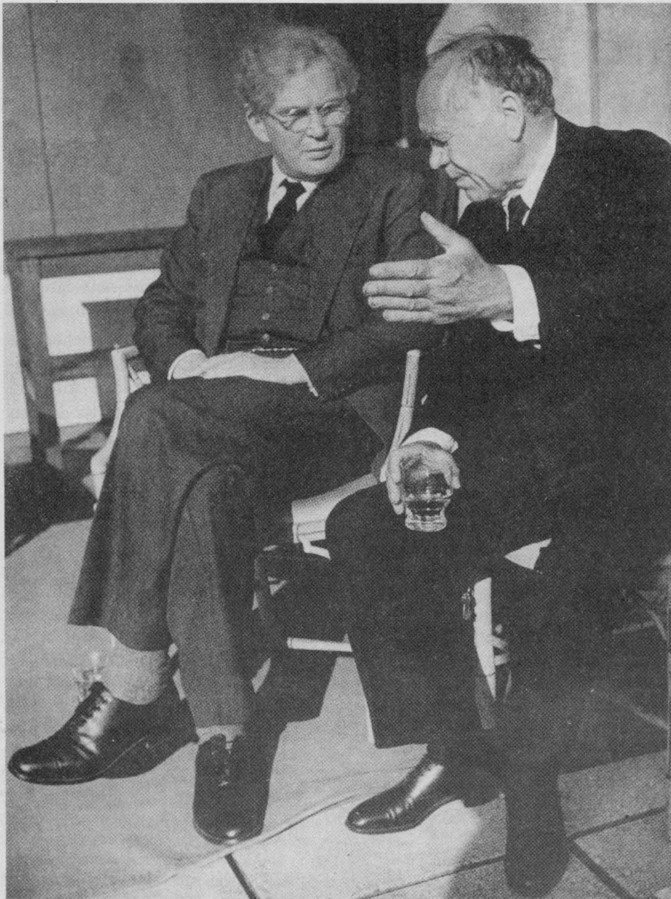
Des britischen Premiers Winston Churchill engste Berater: Links: Informationsminister und Erster Lord der Admiralität, Brendan Bracken (siehe das hier abgedruckte, von ihm veranlaßte Rundschreiben vom 29.2.1944) im Gespräch mit Lord Beaverbrook, dem Besitzer des Londoner Express und Evening Standard , dessen langjähriger Auslandskorrespondent Sefton Delmer war.