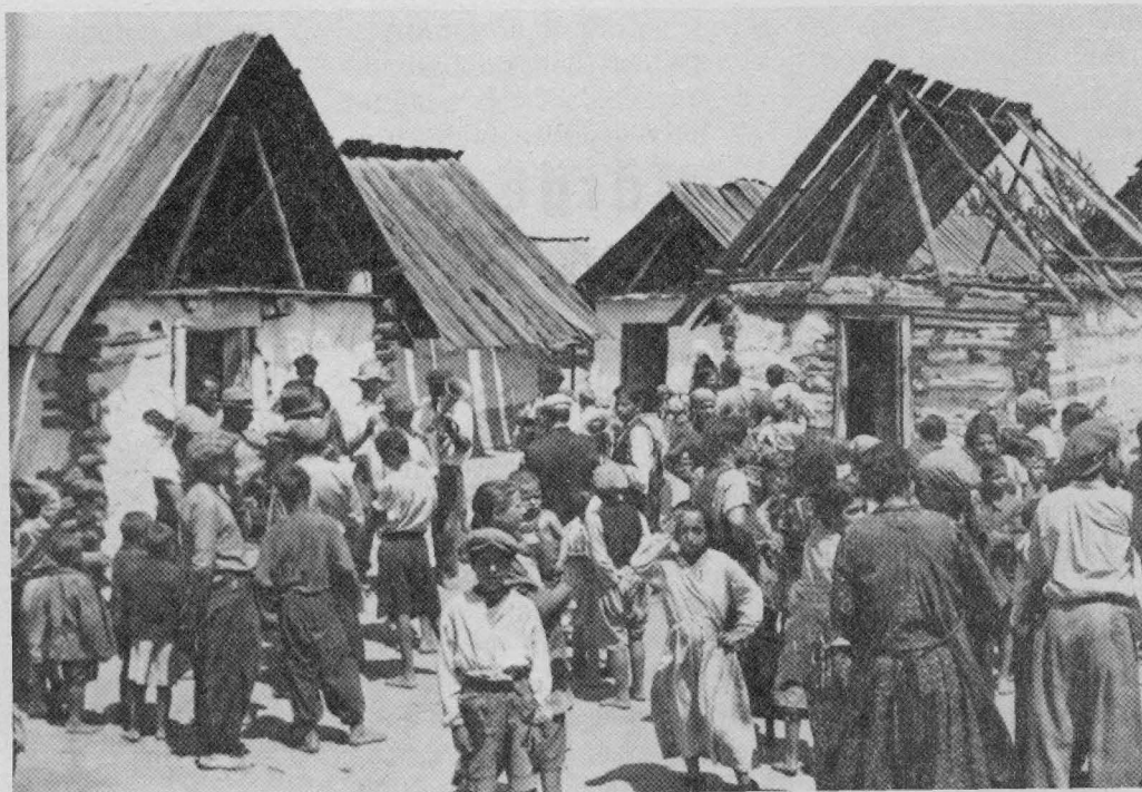
Zigeunersiedlung bei Oberwarth/Burgenland

Aber das gehört ja auch zum System, selbst die deutsche Intelligenz einschließlich der medizinischen Experten als so sadistisch, dumm, ja schizophren darzustellen, daß sie selbst unsinnigste Sachverhalte nicht erkennen. Die deutschen Ärzte waren ja offenbar so dämlich, daß sie erwarteten, daß womöglich diese so “immunisierten Häftlinge” überleben könnten, wenn sie