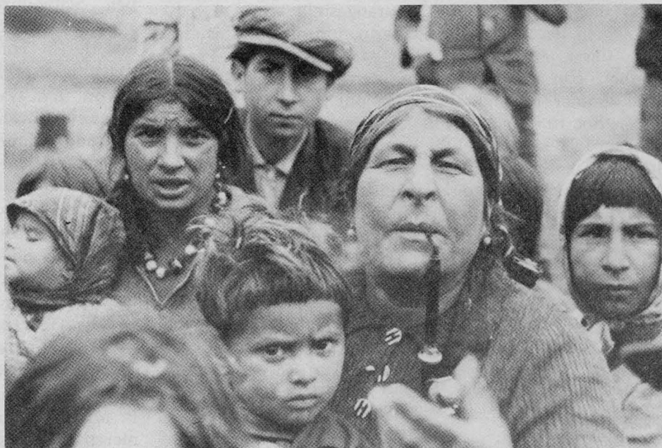
Rom-Zigeuner aus dem Burgenland (um 1939 in Wien)

So war das erste Gesetz zur Verhütung erbkranken Nachwuchses im Jahre 1907 im US-Staat Indiana verabschiedet worden. Zwar hob im Jahre 1919 der dortige Bezirksgerichtshof das Gesetz als verfassungswidrig wieder auf, doch in den USA folgten andere Staaten mit Gesetzen zur Verhütung erbkranken