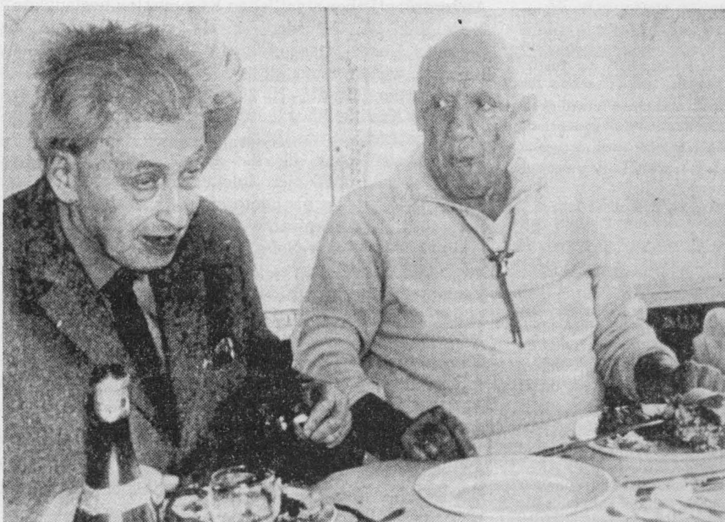
Der sowjetische Mordhetzer Ilja Ehrenburg, während des Krieges haßblind vom Tötungswahn gegen alle Deutschen, auch Frauen und Kinder, die er sämtlich als Tiere verschrie, nach dem von ihm miterrungenen "Sieg" bei seinem (r.i.B.) "alten Freund Picasso" in Nizza/Frankreich.