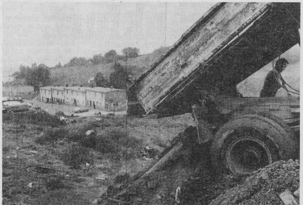
"Zigeunersiedlung, Müllkippe Kistnersgrund: 'Noch ein halbes Jahr ...

"Drei Jahre später legte das dritte und letzte Entschädigungsgesetz fest, daß Roma und Sinti zur Berechtigung einer Wiedergutmachung nicht den Nachweis zu erbringen hätten,