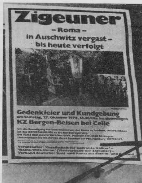
Zigeuner-Plakat 500 000 umgebracht

So "Der Spiegel" in Wahrnehmung seiner Meinungsfreiheit am 6. Okt. 1980, Nr. 41, Seite 98