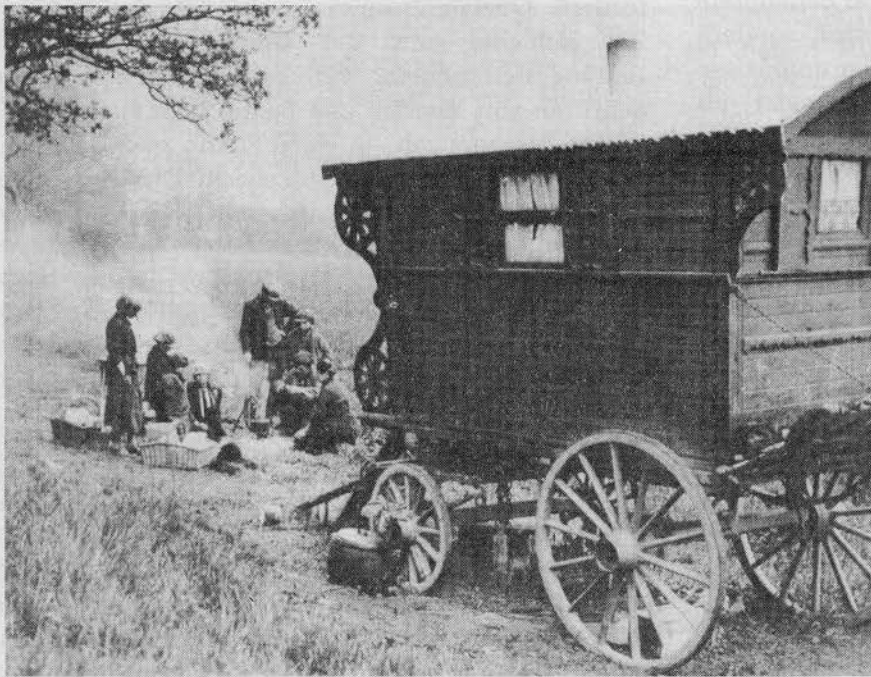
— Zigeuner um 1909 — Lebensweise schon damals problematisch

Ogleich es uns selbst widerlich aufstößt, immer wieder gleichartig unpräzise und sadistisch untermalte Greuelgeschichten lesen zu müssen, kann es dem Leser nicht erspart bleiben, wenigstens beispielhaft jene Art der "Beweisführung" zur Kenntnis zu nehmen, wie jene Leute Mordpolitik in die deutsche Geschichte festschreiben wollen. Ganze Bücher sind zu Tausenden in dieser Diktion in nicht endenwollendem Federfluß geschrieben worden und vergiften die internationale Verständigung. Denn das, was in derartigen Büchern zur Darstellung gebracht wird, kennzeichnet allgemein das Agitationsniveau auch gegenüber anderen politischen Gegnern. Lediglich der Grad der Unverfrorenheit richtet sich nach den Perspektiven der Machtverhältnisse, je nachdem, ob es riskant oder nicht riskant erscheint, ein anderes Volk oder Regime für "vogelfrei" zu erklären, um auf den Ausdruck von Ronald Reagan zurückzukommen.