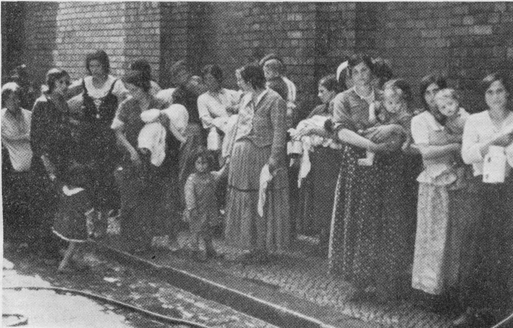
Zigeneraussiedlung aus dem Rheinland im Sommer 1938 und lagermäßige Unterbringung in Berlin

Die polizeiliche Vorbeugungshaft wurde nur offiziell in Besserungs- und Arbeitslagern vollzogen. Zum Bau dieser Lager ist es jedoch nie gekommen. Offiziell bemühte man sich jedoch bis in die Kriegszeit, den Anschein zu erwecken, daß Vorbeugungshäftlinge nicht mit den Konzentrationslagern in Berührung kamen.... (S. 53)