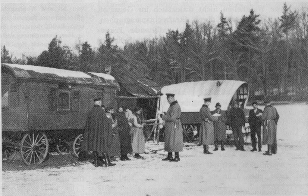
Polizei kontrolliert Wanderzigeuner in Oberschwaben (um 1925)

Noch 1942 wurden die deutschen Zigeuner verhaftet und in KZ geschleppt, die meisten nach Auschwitz. Dort trat ein RKPA-Kommando (RKPA = Reichskriminalpolizeiamt) zusammen, um