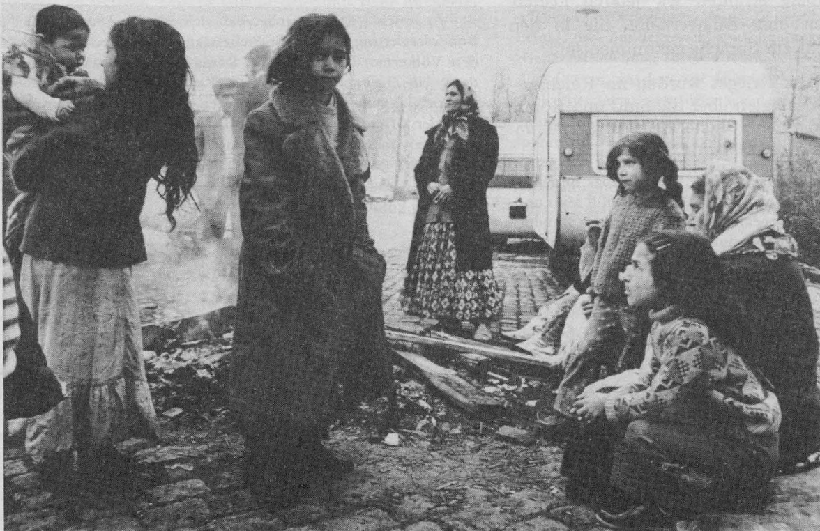
Zigeuner (bei Köln): „Wohin wir sollen, sagt uns niemand“

Solches ist keine Geschichtsschreibung, ist nicht seriös. Es ist schlicht gesagt: Volksverhetzung! Gleichermaßen einzustufen sind jene Behauptungen ähnlichen oder gleichlautenden Inhalts anderer Autoren, die sich auf solche Ausführungen des „Spiegel“ als Beweis-Beleg berufen.