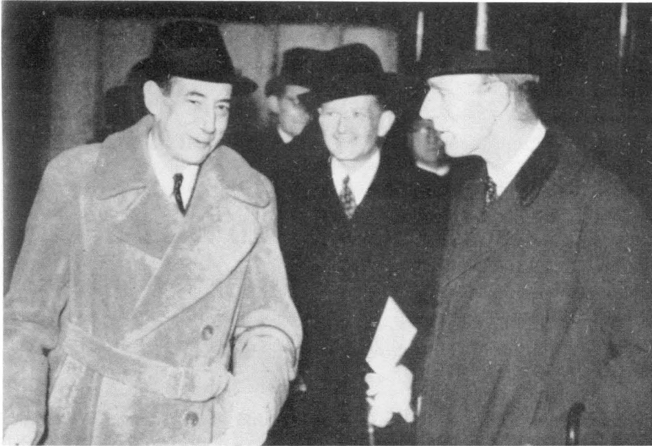
Der polnische Außenminister Oberst Beck (links) bei seiner Ankunft in London im März 1939, sichtlich erfreut über das plötzlich aufdringliche Werben Großbritanniens um Polens Allianzbereitschaft zur Kompromittierung Deutschlands. Rechts der britische Außenminister Lord Halifax, einer der Hauptintraganten zur Erreichung dieses Zieles. In der Mitte der polnische Botschafter in London, Raczynski.

Ergänzt werden sollte, daß das Foreign Office nicht nur durch den Reisebericht von Strang und Jebb über die Lage in Polen unterrichtet wurde, sondern auch durch seine Botschaft in Warschau, die britischen Konsulate in Polen, die polnische und internationale Presse, die diplomatischen Sondergespräche auch auf dem Umweg über die Franzosen. So war natürlich in England unverzüglich bekannt geworden, daß Polens Kriegsminister Kasprzycki am 18. Mai 1939 gegenüber französischen Generalstabsoffizieren die Auffassung zum besten gegeben hat :