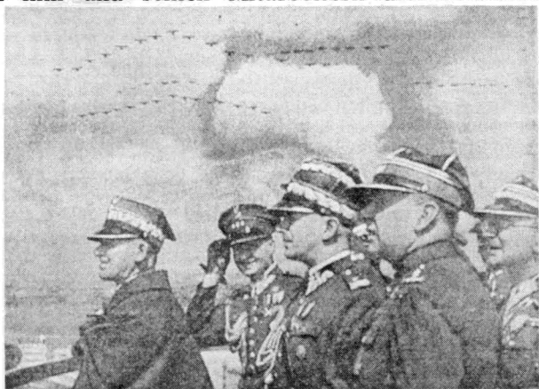
Sie wollten das Deutsche Reich allein besiegen Marschall Edward Rydz-Smigly wollte binnen 14 Tagen in Berlin einmarschieren. Die Flugzeugformationen — deutsche Verbände anlässlich des Nürnberger Parteitages 1937 — montierten polnische Propagandisten in dieses Bild hinein.

Deutsche Wochenzeitung, Rosenheim 5. Oktober 1979 S. 8