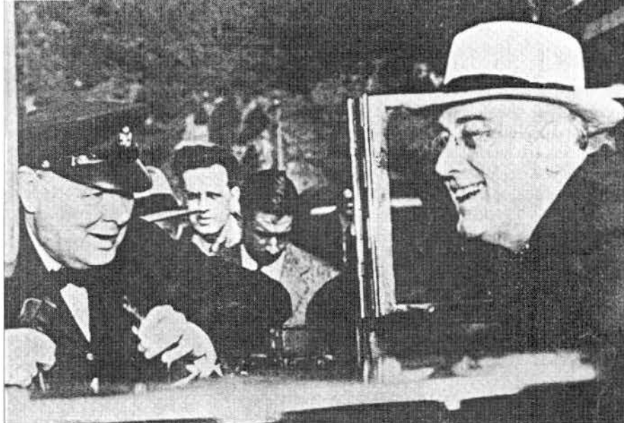
Winston Churchill (li.) 1939 in einer geheimen Botschaft an US-Präsident F. D. Roosevelt (re.): „Wenn ich Premierminister werden sollte, könnten wir die Welt kontrollieren.“ — Wer also wollte die Weltherrschaft?

Die aufdringliche Politik Großbritanniens, Polen gegen Deutschland aufzuwiegen, hatte sich — natürlich