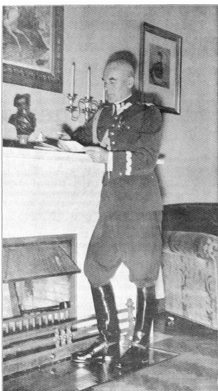
"Joseph Pilsudskis Nachfolger, Polens neuer Marschall: General Rydz-Smigly in seinem Heim.

Das einzig "Beunruhigende" für diese gentlemen war, "daß so viele einflußreiche Personen in diesem Lande immer noch erklären, daß nichts sie veranlassen könnte, auf Grund der Kurzsichtigkeit des Foreign Office für Danzig zu sterben".