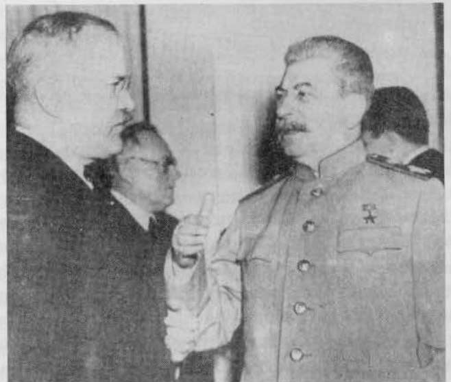
Molotow (li.) im Gespräch mit Stalin im Februar 1945. Der sowjetische Vormarsch rollt nach 4 Jahren Verspätung und mit Millionen Opfern, diesmal nur zur Mitte Europas.

Stalins Hinweis auf das Jahr 1942, da der Konflikt mit Deutschland "fast unvermeidlich ausgetragen wer-