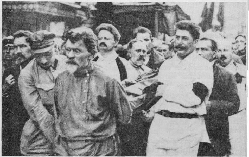
Beisetzung des am 20.6.1926 verstorbenen Massenmörders Felix E. Derschinsky, der 1917 die Tscheka – die spätere GPU – gegründet hat. Stalin + Trotzki treten zum letzten Mal gemeinsam in der Öffentlichkeit auf. Von li. n. r.: (3.v.li.) Rykow, Kalinin, Trotzki, Kamenew, Stalin, Tomski + Bucharin.

Weder hat Adolf Hitler in seinem Buch "Mein Kampf", noch seit 1923 oder 1933 anderen Völkern den Kampf angesagt, Raub- oder "Befreiungsfeldzüge" proklamiert, für Eroberungen gerüstet, Koalitionen zur Einkreisung anderer Staaten eingefädelt. Wenn er den Völkerbundmächten Unruhe bereitete, so nur deshalb, weil er sich mit ihren Unrechtsbedingungen von Versailles, aber auch mit weltrevolutionären Methoden nicht abzufinden gewillt war. Doch das ist legitim!