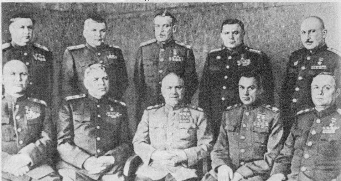
Rote Frontchefs 1945 (v. li. n. re. sitzend): I.S. Konew, A.M. Wassilewski, G.K. Schukow, K.K. Rokossowski, K.A. Merzekow, stehend: Tolbuchin, R.J. Malinowski, L.A. Goworow, A.I. Jerjomenko, C. Bagramjan.

Am 15.6.1941 wird in Moskau die Verordnung erlassen über "Anlagen von Staatsreserven und Vorräte für die Mobilmachung 1941" sowie eine über die Einberufung von Reservisten in den Grenzbereichen.