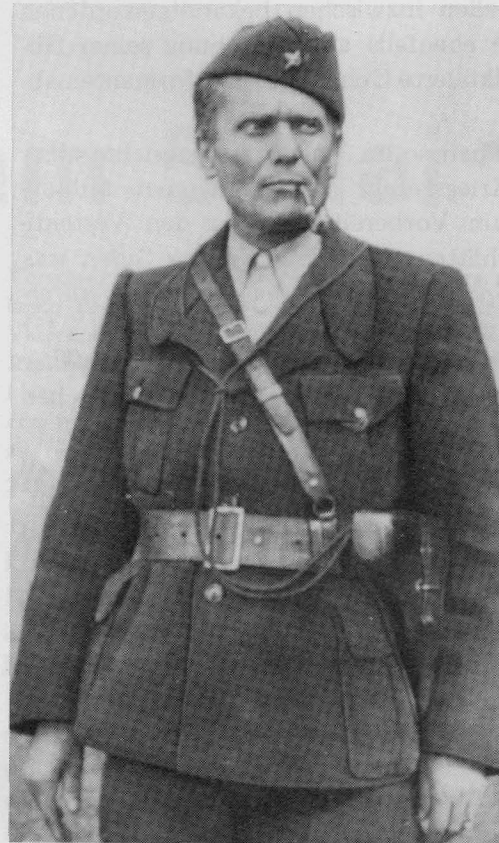
Josip Broz Tito (Tito = Tarnname)

Am 9. Mai 1941 erhielt der jugoslawische Partisanenführer Tito von der Komintern in Moskau folgenden