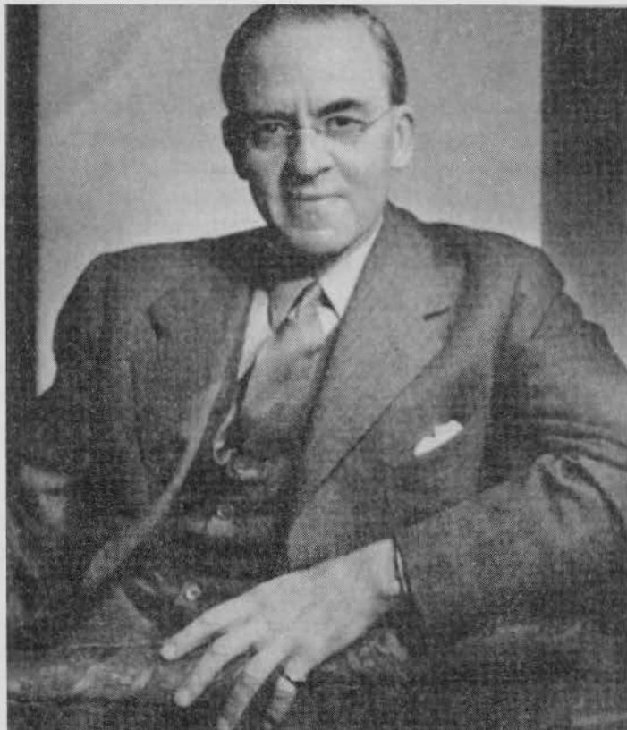
"Right honorable Sir" Stafford Cripps

Einer der eifrigsten Unterhändler in Moskau zugunsten des Kriegseintritts der UdSSR "im Interesse Großbritanniens". Bot den Sowjets das Baltikum und den Balkan zur Bolschewisierung an, leitete auch die Verhandlungen über britische Hilfslieferungen. Vor Kriegsbeginn machte er sich "um den Frieden" verdient als Minister für Kampfflugzeugproduktion (minister of air craft production).