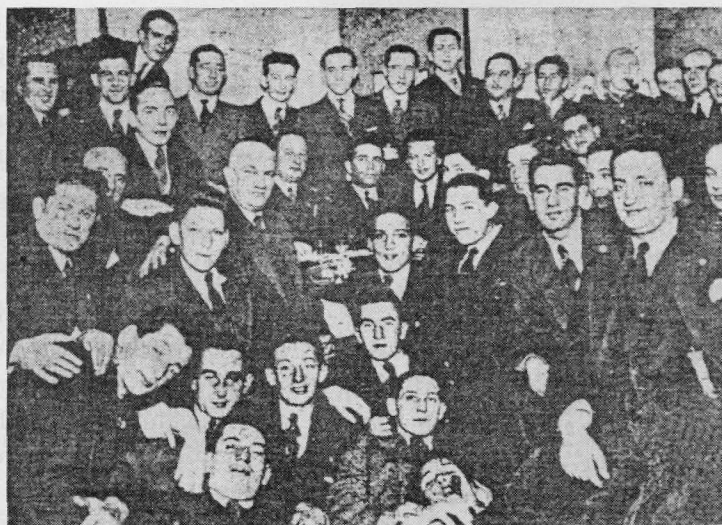
Bildtext der amerikanischen Zeitung The Thunderbolt vom Juni 1986, No. 311:

"Seltenes Foto einer Feier der kommunistischen Parteiführerschaft in Riga, Lettland 1940. Stalin hat soeben das Land besetzt und sie an die Macht gebracht. Die roten Parteien des Baltikums waren nahezu 100%ig jüdisch."