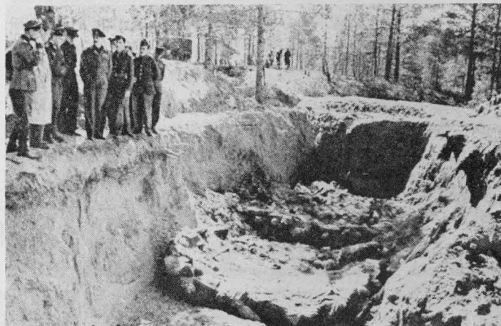
Im März/Mai 1940 ließ Stalin 14.500 gefangene polnische Offiziere mit Genickschuß erschießen. Im April 1943 wurden die Leichen von 4.253 dieser Opfer im Wald von Katyn westlich Smolensk entdeckt, exhumiert und der internationalen Öffentlichkeit zur Überprüfung zugänglich gemacht.