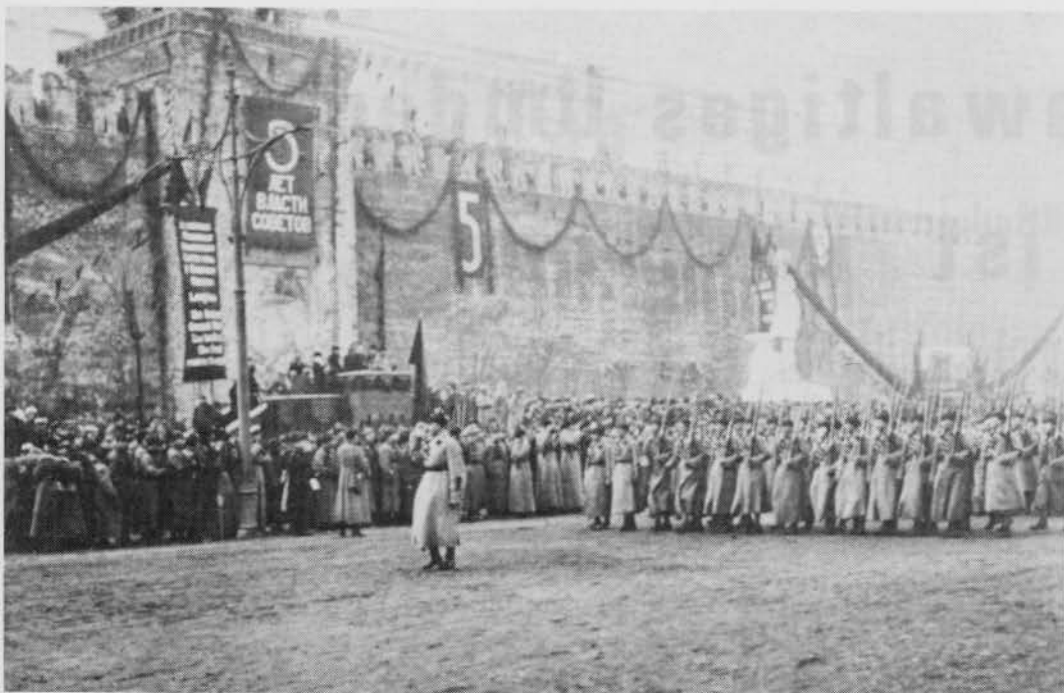
Militärparade auf dem Roten Platz in Moskau am 7. November 1922, dem 5. Jahrestag der Oktoberrevolution. — Schon damals marschierten die "Genossen Kämpfer" für die Eroberung der Weltherrschaft und für die Vernichtung aller derer, die sich dem entgegenstellen.

zur Zerschlagung des Reiches. Für sie gab es kein Bollwerk der Zivilisation gegen den Bolschewismus, das Deutschland hieß, obgleich Adolf Hitler gerade dieses geschaffen hatte. Für sie gab es nur überaltertes Imperialdenken, eigene Machterweiterung, Zerschlagung der europäischen Mitte, um ihr "Versailles von 1919" diesmal dauerhaft zu realisieren, — bei Inkaufnahme von Millionen Toten. 4)