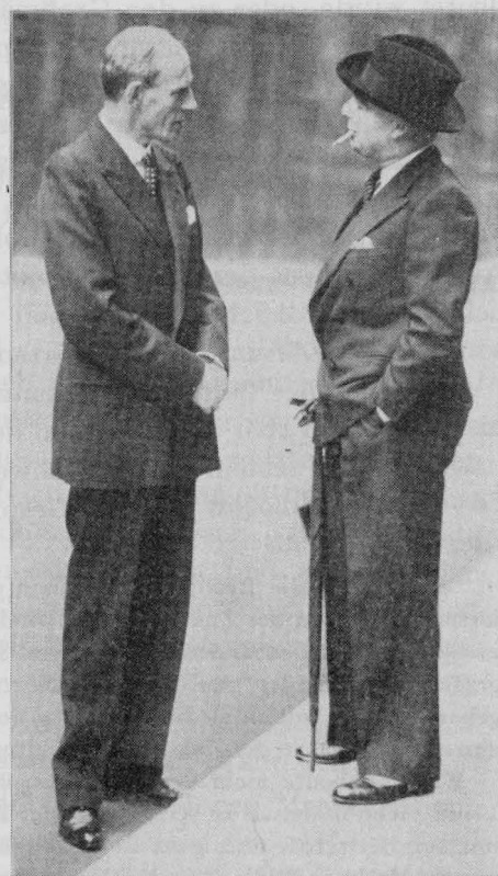
Der britische Außenminister Lord Halifax (li.), einer der Hauptintriganten zugunsten des Krieges gegen Deutschland, im Gespräch mit dem britisch-jüdischen Kriegsminister Hore Belisha (re.). Weder die Haltung noch offensichtlich der Inhalt des Gesprächs waren für die Lage Großbritanniens im Jahre 1939 angemessen.

von den "Schwächen der Roten Armee" sowie die Pläne der Engländer und Franzosen zur Invasion in Norwegen und sogar in Schweden zwecks "Hilfeleistung" für die Finnen begrüßte er als "Ausweitung der Kriegsbasis", abgesehen von seinem dennoch erzielten Territorialgewinn. Das schließliche Scheitern dieser Pläne infolge der zuvorkommenden Besetzung Norwegens durch deutsche Truppen konnte ihm gleichermaßen recht sein.