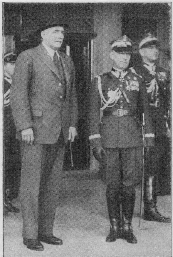
Der britische Generalstabschef Ironside in Warschau

In einem demonstrativen Besuch im Sommer 1939 versprach er Polen einen Millionenkredit und britische Militärausrüstung. Polen fühlte sich als Großmacht und hat gar nicht begriffen, in welcher Lage sich Kontinentaleuropa in Wirklichkeit befand.