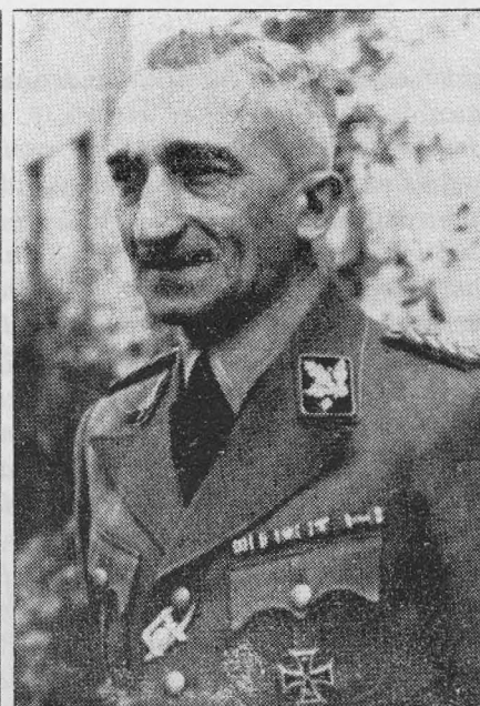
Arthur Nebe, Chef der Kriminalpolizei, General der Waffen-SS, Befehlshaber der Einsatzgruppe B bis Ende Okt. 1941