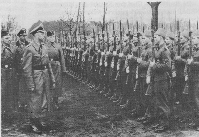
Himmler besucht 1943 Soldaten der Waffen-SS Gebirgs-Division "Handschar" (Kroaten)