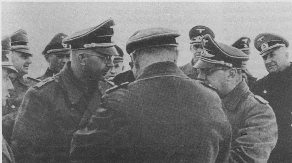
Der RF-SS im Gespräch mit höheren Luftwaffen-, Heeres- und Polizeioffizieren in Minsk 1942. Meinungsverschiedenheiten sind nicht erkennbar.

» 3 « "Wenn ein Ritterkreuzträger fällt,"