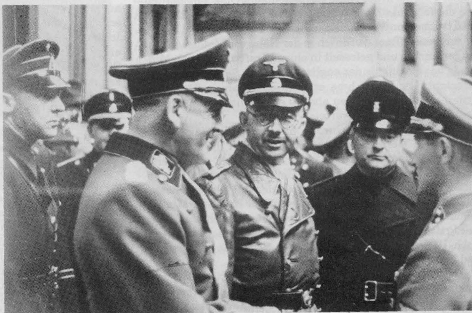
Heinrich Himmler im Gespräch mit Oswald Pohl und dem holländischen Führer der Nationaal Socialistischen Beweging (NSB), Anton A. Mussert