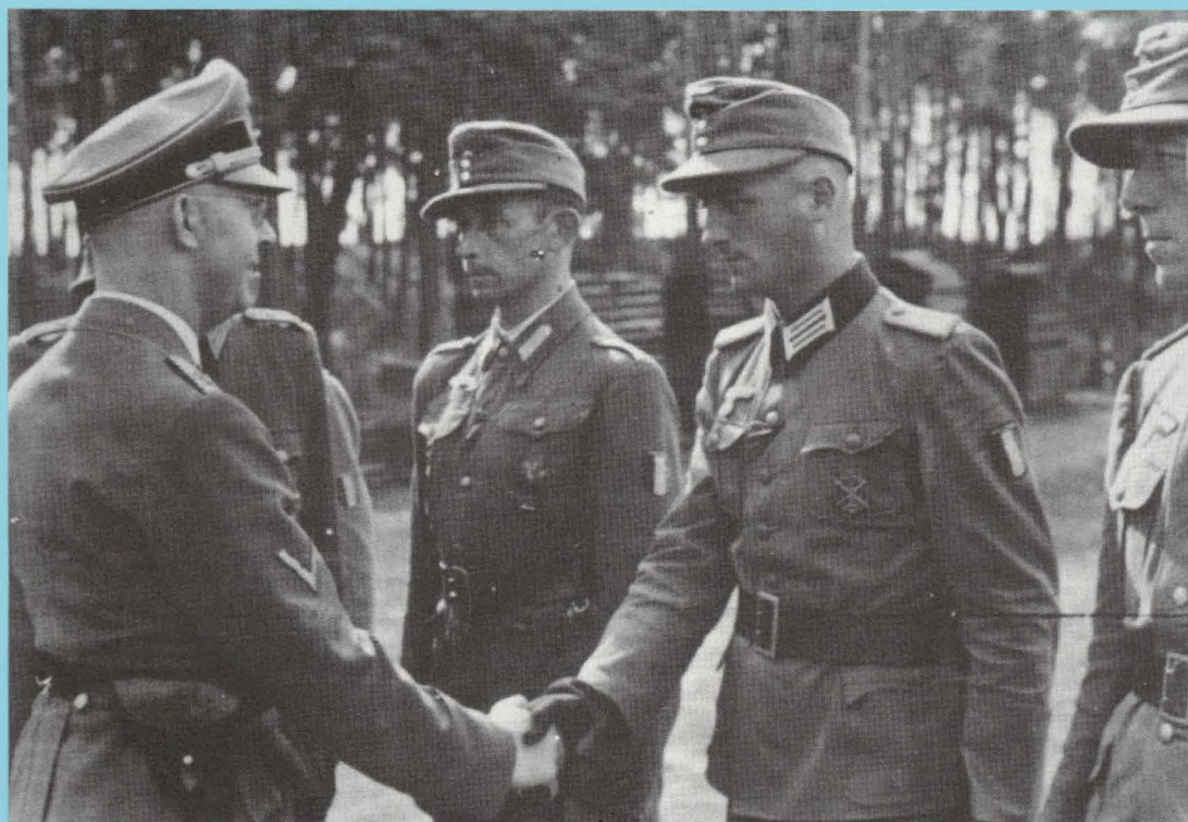
Heinrich Himmler begrüßt Offiziere europäischer Freiwilliger, die in der deutschen Wehrmacht gegen den Bolschewismus kämpfen.