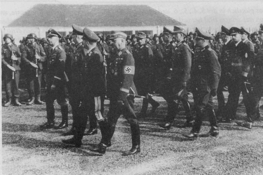
Staatsakt für Generaloberst Eduard Dietl in Kleßheim am 1. Juli 1944. Dietl war erster Eichenlaubträger der deutschen Wehrmacht (er erhielt diese Auszeichnung für seinen Kampfeinsatz 1940 in Norwegen/Narvik), seit Beginn des Rußlandfeldzuges Oberbefehlshaber der deutschen Truppen in Lappland/Finnland, am 23.6.1944 Flugzeugabsturz bei Salzburg.

Erfüllen Sie überall Ihre Aufgabe im Kleinen und Großen, dann haben Sie so gehandelt, wie das Gesetz es befahl."