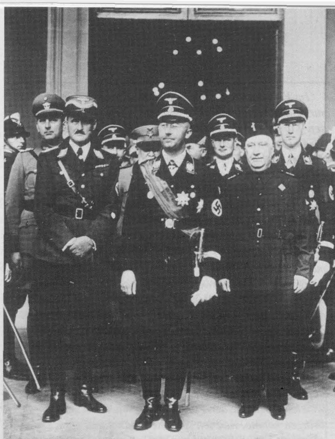
Ankunft des Reichsführers-SS und Chef der Deutschen Polizei, Heinrich Himmler, am 18.10.1937 in Rom. Er folgte einer Einladung des Duce zum "Tag der italienischen Polizei". In seiner Begleitung befinden sich die Chefs der Hauptämter Ordnungs- und Sicherheitspolizei, General Dalugue (li. i. B.), und SS-Gruppenführer Heydrich (re). Zur Rechten des RFSS beim Verlassen des Bahnhofs der deutsche Botschafter in Rom, von Hassell, auf der anderen Seite der Chef der italienischen Polizei, Bocchini.

Heinrich Himmler hat sicher versucht, im Frieden auf die kleine Verfügungstruppe einen Einfluß auszuüben. Im Kriege war das wenig oder gar nicht möglich. Truppenteile der Waffen-SS sprach er nicht. Er hat nur einige Male Kommandeure und Offiziere einzelner Divisionen im Felde gesprochen. Man