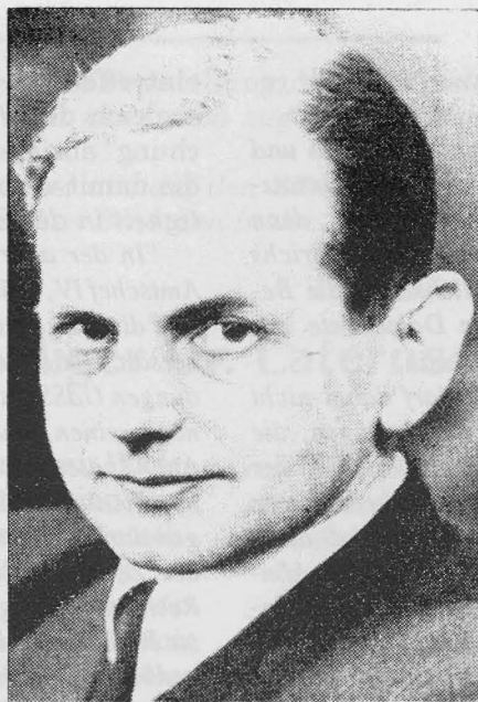
Otto Ohlendorf, Leiter der Einsatzgruppe D