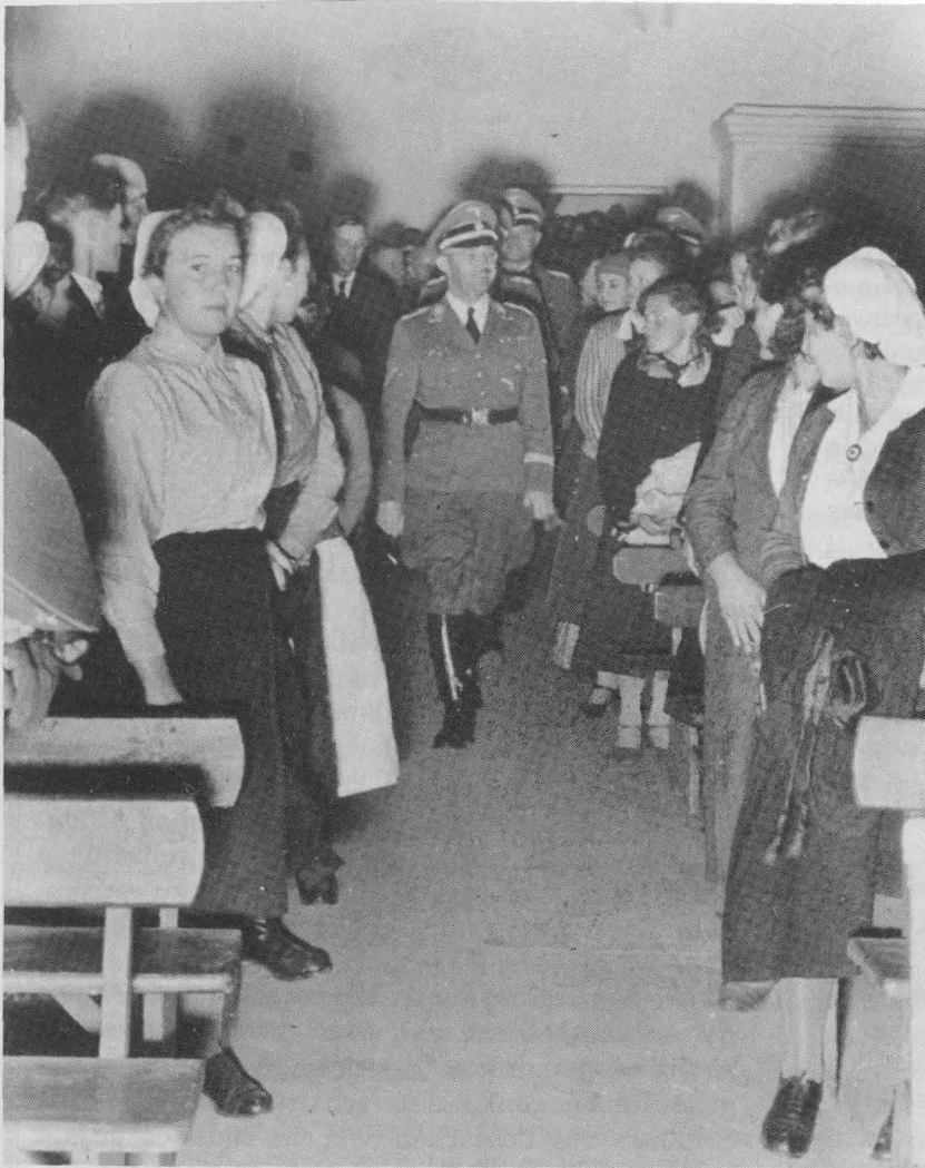
Himmler am 31.10.1942 beim Einzug in die Abendveranstaltung der Volksdeutschen in Halbstadt, im russischen Gouvernement Taurien nordöstlich der Krim am Ufer des Kaspischen Meeres, dem geistigen Zentrum der deutschen Ansiedlungen in Südrußland (neben dem am rechten Ufer der Molotschnaja gelegenen Prischib). Im Gebiet der Molotschnaja waren ca 84 DRK-Schwester zur Betreuung der Volksdeutschen eingesetzt.

In 71 Siedlungen im Gebiet um Halbstadt waren 17.679 Volksdeutsche verblieben, 2.728 waren schon vor Ausbruch des Rußlandfeldzuges deportiert worden, 12.741 (zumeist Männer) nach dem 22.6.1941, weitere 522 wurden in die Rote Armee eingezogen. Nähere Einzelheiten waren vom SS-Sonderkommando der Volksdeutschen Mittelstelle bis zum 15.3.1942 nicht ermittelt worden (US-Mikrofilm T 175, Roll 68). -- In jenem Gebiet einschließlich der Krim lebten einst 78.000 Rußlanddeutsche.