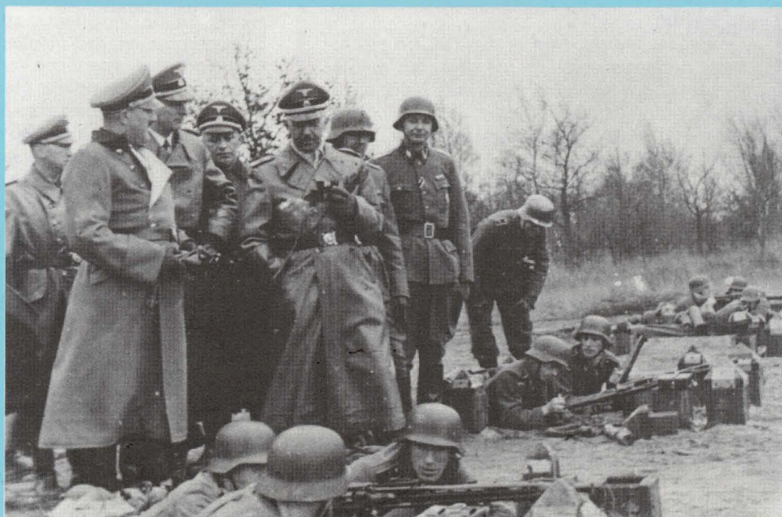
Heinrich Himmler inspiziert 1944 in den Niederlanden europäische Freiwillige der Waffen-SS während ihrer Kampfausbildung.