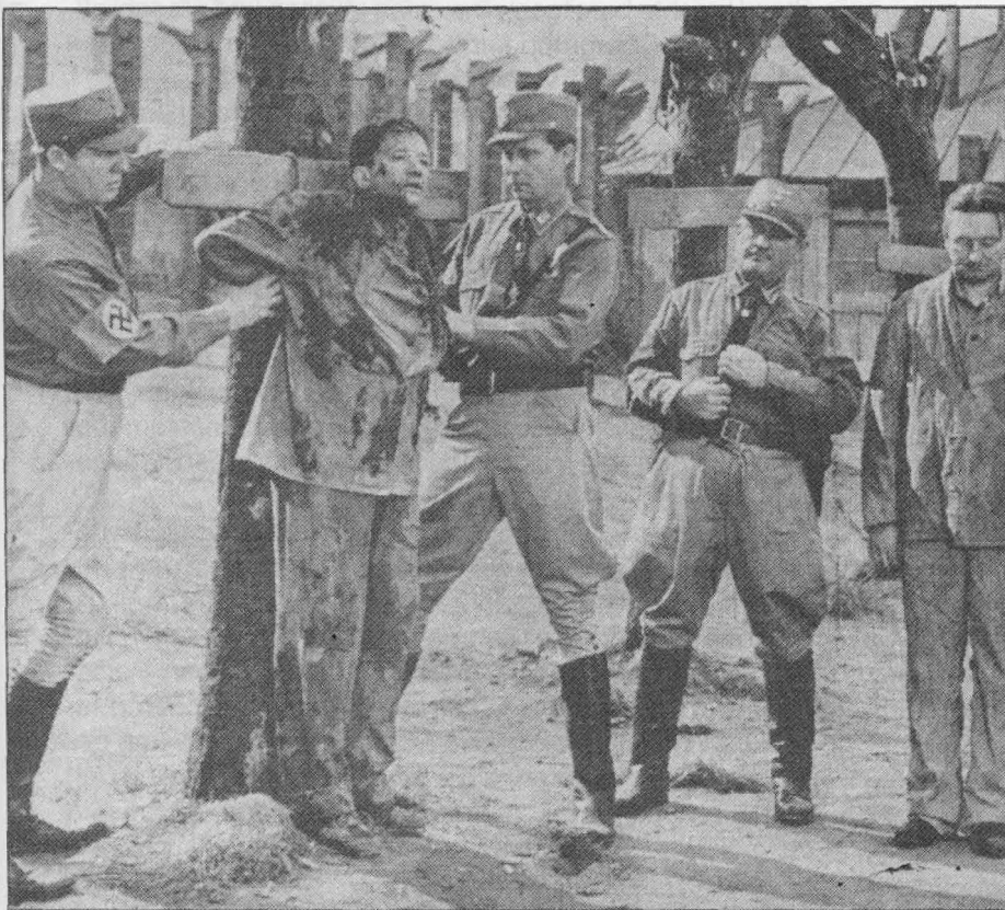
Kreuzigung – eine barbarische Todesstrafe, vollzogen an sechs KZ-Häftlingen, deren Flucht scheiterte. Ein weiterer Flüchtiger kommt durch; das siebte Kreuz bleibt leer

Das Hamburger Abendblatt serviert der Weltöffentlichkeit dieses Foto sowie den hier nachgedruckten Text am 6. November 1990 ohne sich zu schämen und ohne Furcht vor dem Staatsanwalt, der mit einer Strafanzeige wegen Volksverhetzung, Verunglimpfung des Andenkens Verstorbener, Beleidigung oder Verstoß gegen das Pressegesetz, das zur wahrheitsgemässen Berichterstattung verpflichtet, in die Redaktion zur Hausdurchsuchung kommen und zur Beschlagnahme aller möglichen Gegenstände und "Tatwaffen" (Druckstöcke, noch vorhandene Druckwerke, Schreibmaschinen, Computer usw.) schreiten könnte. Nein, keine Sorge, er kommt nicht! Solche verlogene Dauerhetze geht täglich in der Bundesrepublik, aber auch im Ausland über die Bühne!