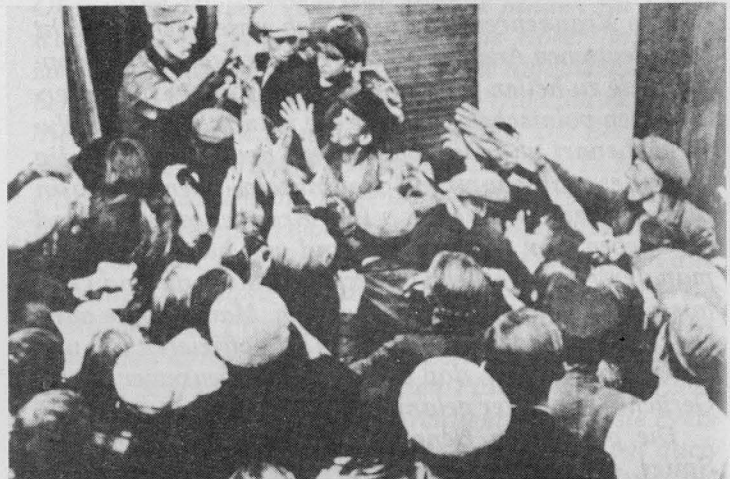
"Warschau 8.10.1939: Getreu den Kapitulationsabmachungen verteilen deutsche Truppen Lebensmittel an die hungernden Bewohner der Hauptstadt"

Janusz Piekalkiewicz "Polenfeldzug", Bergisch Gladbach 1982, S. 230.