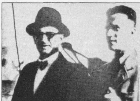
A. Eichmann (l.) auf dem Weg nach Argentinien