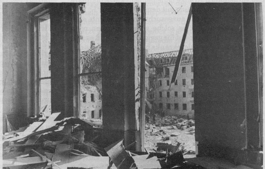
Das SS-Wirtschafts-Verwaltungs-Hauptamt 1943/1944 Berlin. Es wurde weitergearbeitet.

Alle diese Präparate wurden klinisch an Kranken geprüft; es wurde mit ihnen behandelt. Ihr Effekt und die Reaktion auf sie waren, ebenso wie der Krankheitsverlauf, schwer voraussehbar. Das allgemeine Streben ging dahin, ein Präparat zu schaffen, das möglichst wirksam war, aber möglichst geringe Nebenwirkungen / Reaktionen aufwies. Man machte Kuren, indem man unter sorgfältiger Beachtung der Reaktionen und des weiteren Krankheitsverlaufes in besonders graduierten Spritzen 0,1 ccm einer auf 1 : 100.000 verdünnten Tuberkulinlösung in oder unter die Haut spritzte und dies in Abständen (2-3 Injektionen je Woche) langsam verstärkte. Jedoch wurde nie mehr als 1 ccm einer Verdünnung 1 : 1000 injiziert. Sorgfältigste Beobach-