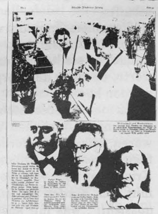
Kölnische Illustrierte Zeitung, 9. Jan. 1936