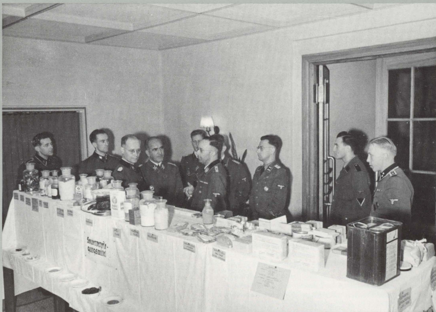
Vorstellung der Konzentratverpflegung der Waffen-SS.

Mitte: Heinrich Himmler, links von ihm vorn: SS-Obergruppenführer Oswald Pohl, links von ihm Prof. E.G. Schenck, 1943 in Hochwald bei Rastenburg/Ostpr.