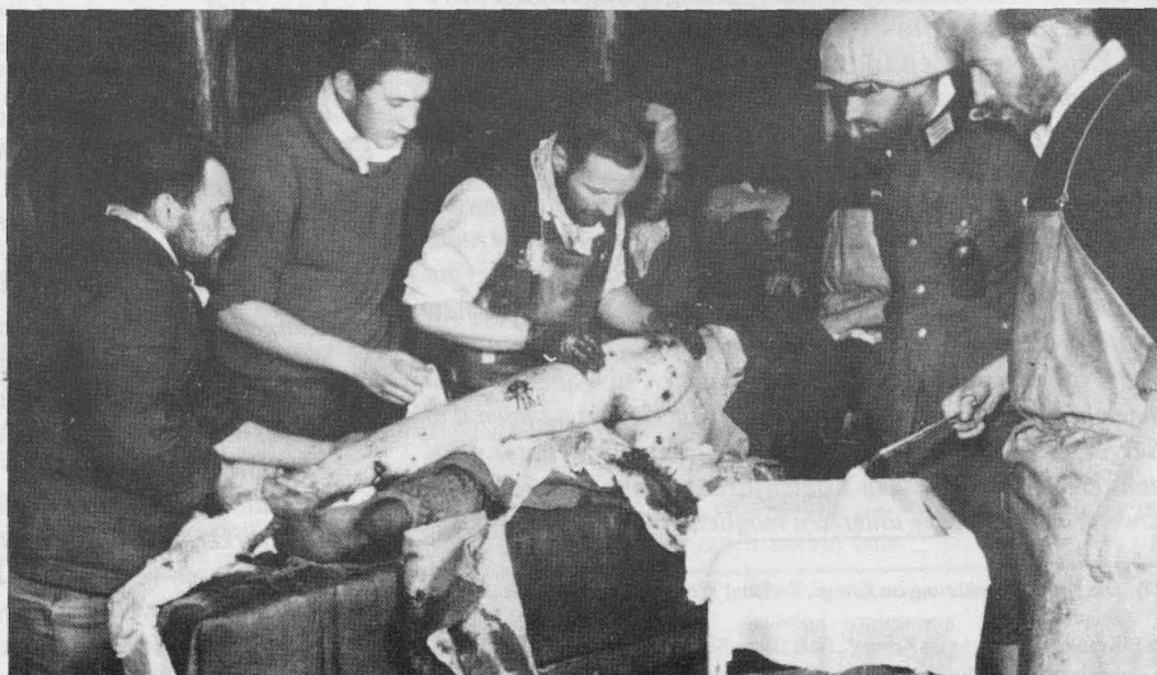
Auf einem deutschen Hauptverbandsplatz in Rußland. Die Ärzte waren ständig überfordert. Der Gegner dort achtete das Rote Kreuz ebensowenig wie die westlichen Luftgangster über den deutschen Städten.

Der Wert der zuckerkranken Menschen wurde keineswegs von den Ärzten, die sie während der Jahre 1939-1945 verantwortlich zu versorgen und zu behandeln hatten, in Frage gestellt!