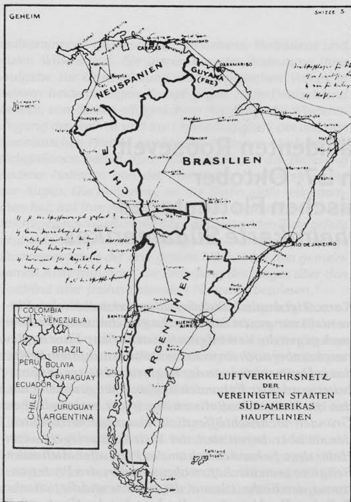
Die in England gefälschte Landkarte von Südamerika. Sie zeigt als angebliches Planungsziel der Reichsregierung ein vergrößertes Brasilien und Argentinien sowie die Beseitigung von Bolivien, Peru, Venezuela und Ecuador. Die verkleinert eingegebene Karte enthält die wirklichen Grenzen.

tenhaus hat bereits eine Abstimmung vorgenommen über die Revision eines Teils des Neutralitätsgesetzes (5233A), das heute durch die Umstände bereits überholt ist. Der Auswärtige Ausschuss des Senats hat ebenfalls die Ausschaltung gewisser lähmender Bestimmungen des Neutralitätsgesetzes empfohlen. Das ist der Weg der Offenheit und der Realität. Unsere Handelsschiffe müssen bewaffnet werden, um sich gegen die Schlangen der Meere verteidigen zu können. Unsere Handelsschiffe müssen die Freiheit haben, amerikanische Waren nach den Häfen unserer Freunde zu transportieren. Unsere Handelsschiffe müssen geschützt werden von unserer Kriegsmarine. Die Tradition unserer Kriegsmarine ist: 'Zum Teufel mit den Torpedos! Immer vorwärts!' Unsere Fabriken, unsere Schiffswerften dehnen sich immer mehr aus. Unsere Produktion muß vervielfacht werden. Sie darf nicht beeinträchtigt werden durch die egoistische Zersetzungsarbeit einer kleinen, aber gefährlichen Minderheit von Industriellen, die in der Hoffnung auf höhere Gewinne Starrköpfigkeit beweisen. Sie darf aber auch nicht beeinträchtigt werden durch die Obstruktion einer kleinen Minderheit von Führern der Arbeiterorganisationen, die eine Gefahr für die wirkliche Sache der Arbeiter und für die ganze Nation bilden. Unsere Hauptverteidigungslinien erstrecken sich jetzt über alle Meere. Um den außerordentlichen Anforderungen von heute und morgen genügen zu können, ist unsere Kriegsmarine in einem Maße ausgebaut worden wie nie zuvor. Unsere