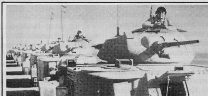
Britische Truppen in us-amerikanischen General-Grant-Panzern auf dem Weg zur Front in Ägypten

19.4.1941: Admiral Stark , Chef der Marineoperationen, teilte dem Flottenkommandeur in Hawaii, Admiral Kimmel , mit, daß 1 Flugzeugträger, 3 Schlachtschiffe, 4 Kreuzer und 18 Zerstörer aus dem Pazifik abgezogen und verlegt werden "als erste Staffel der Schlacht im Atlantik". 35)