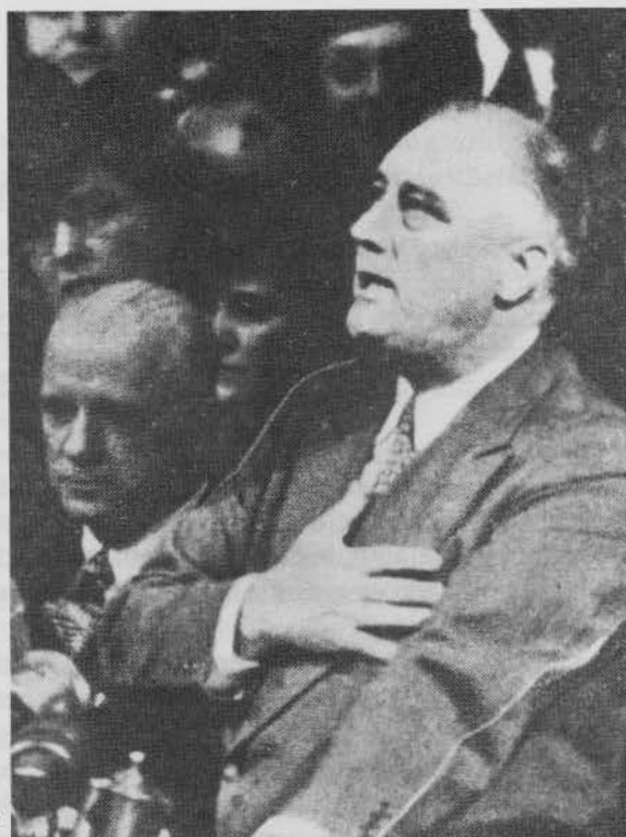
Eine seiner theatralischen Gesten