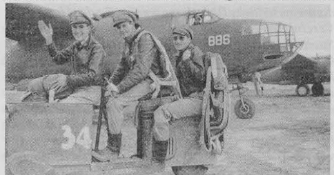
US-Piloten auf dem Weg nach Hause, nachdem sie im Iran Pacht- und Leih-Flugzeuge überprüft haben, bevor sie den Sowjets übergeben wurden.

Knox gab ferner bekannt, daß seit dem 7. Juli -- dem Tag des Einsatzes der Nordatlantikpatrouille -- die Schiffsverluste auf der Atlantikroute bedeutend gesunken und die