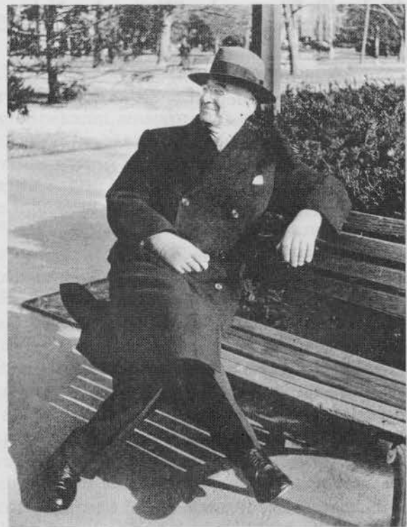
"Bernard Baruch beobachtet die Washingtoner Szene von der Bank im Lafayette Park gegenüber der Straße vom Weißen Haus mit Zuversicht. Er betätigte sich als inoffizieller Ratgeber der Kriegsverwalter und nutzte diese Bank als »outdoor office«. Sein neuer Job der industriellen Umstellung auf Kriegsproduktion hat ihn zum offiziellen Mitentscheider gemacht (has taken him indoors)."

Die Besetzung Islands oder der Stützpunkte Grönlands durch die Deutschen würde den Krieg in die Nähe unserer kontinentalen Küsten bringen. Desgleichen wäre, wenn die Azoren oder die Kapverdischen Inseln von den Deutschen besetzt oder kontrolliert sein sollten, die Freiheit auf dem Atlantik durch die Unterseeboote in direkter Weise bedroht und unsere eigene Freiheit gefährdet. Ich habe bei vielen Gelegenheiten gesagt, daß die USA ihre Volkskraft und ihre Hilfsmittel nur für Zwecke der Verteidigung mustern, nur um einen Angriff zurückzuweisen. Ich wiederhole jetzt diese Feststellung. Wir müssen uns jedoch darüber klar werden, daß, wenn wir das Wort 'Angriff' gebrauchen, dann müssen wir es in ein Verhältnis bringen zu der Blitzgeschwindigkeit moderner Kriegführung. Manche Leute denken, daß wir solange nicht angegriffen sind, als die Bomben nicht tatsächlich auf