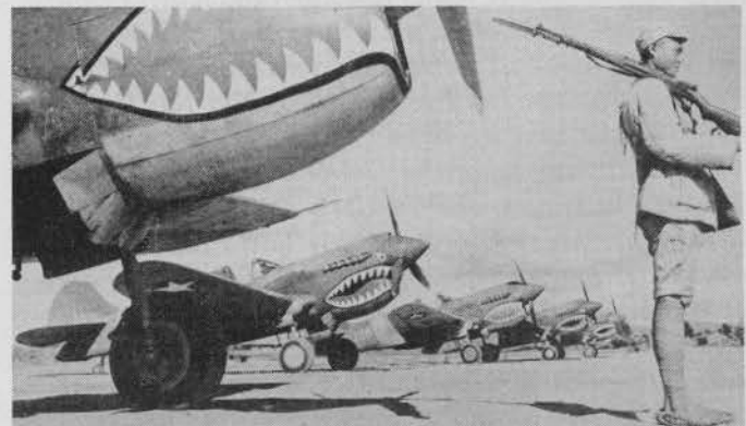
Ein chinesischer Soldat bewacht P-40-Flugzeuge der "Fliegenden Tiger" des Generals Chennault.

war Raub! Die Reichsregierung reagierte darauf nicht.