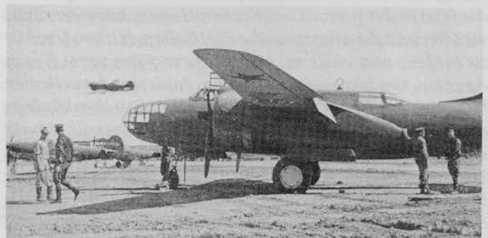
Sowjetische Flieger übernehmen im Iran us-amerikanische Kampfflugzeuge.