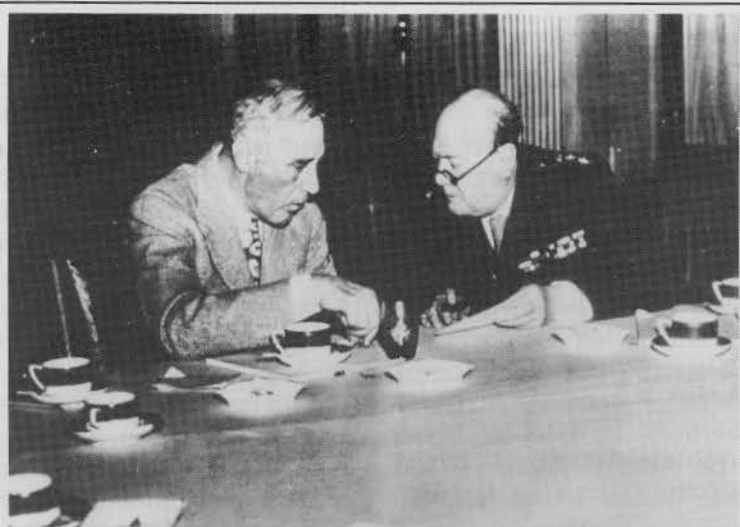
F.D. Roosevelt und der britische Premierminister 1944 auf dem Höhepunkt ihrer Macht. Der linke ein körperliches Wrack, der rechte ein Alkoholiker. Der dritte im Bunde dieser Massenmörder -- Josef Stalin -- eroberte inzwischen mit Hilfe dieser beiden Osteuropa.

Aber nehmen wir die 2. Fälschung, wir wollten alle