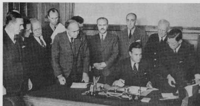
Averell Harriman, der amerikanische Verhandlungsleiter, unterzeichnet am 1. Oktober 1941 das Moskauer Protokoll. 3.v.li. Litvinow, dann Lord Beaverbrook, Sowjet-Außenkommissar Molotow, Botschafter Steinhardt und Admiral Standley.

Von deutscher Seite wurde dazu erklärt, daß Knox damit