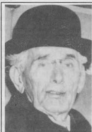
LOUIS BRANDEIS ... Power behind president.

Bedauerlicherweise gibt es sogar Staaten, die den Aufbau einer neuen Ordnung in Großasien durch Japan mittelbar oder unmittelbar zu stören suchen, oder noch weiter gehen und die Entwicklung Japans unter Anwendung aller Mittel zu verhindern suchen. Die japanische Regierung ist stets bestrebt gewesen, diesen Zustand der Dinge zu verbessern, doch ist diesem Streben bisher nicht nur kein rechter Erfolg beschieden gewesen, vielmehr ist mancherorts der Druck gegen Japan immer offener zuta-