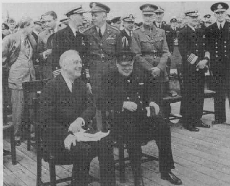
Churchill und Roosevelt auf der Prince of Wales. An der äußersten Linken: zwei Zivilisten: Harry Hopkins im Gespräch mit Averell Harriman. In der ersten Reihe stehend von links: Admiral King, General Marshall, General Sir John Dill, Admiral Stark und Admiral Sir Dudley Pound.

vivendi mit den USA zu erreichen. Ohne die japanischen Vorschläge für ein Übereinkommen mit den USA überhaupt geprüft zu haben, forderte er die Respektierung von 4 abstrakten Grundsätzen: