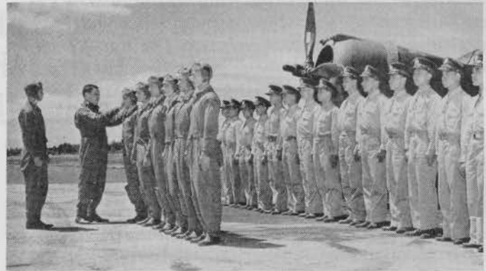
Chinesische Piloten werden auf einem Flugplatz in den USA ausgebildet, um anschließend gegen Japan eingesetzt zu werden.

6.6.1941: FDR ließ sämtliche deutsche, italienische, französische, rumänische, spanische und baltische Schiffe, die sich in nordamerikanischen Häfen befanden, beschlagnahmen und unter dem Sternbanner in Dienst stellen. -- Das