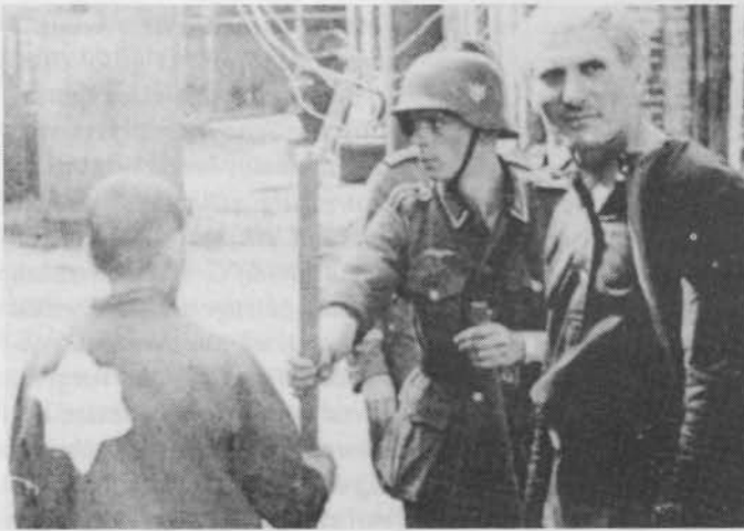
Begonnen hat es mit dieser Aufnahme in der Jüdischen Allgemeinen Wochenzeitung am 6.4.1995.