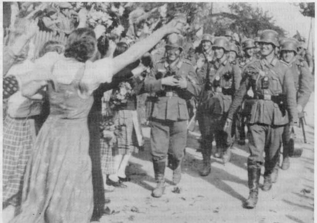
Empfang deutscher Truppen im Sudetenland im Oktober 1938. Man achte auf die Kragenspiegel der Unteroffiziere und die klaren Lichtverhältnisse.

Doch zur Sache: Wehrmachtsoldaten hatten mit jüdischem Arbeitseinsatz kaum zu tun, und wenn, dann würden Unteroffiziere nicht unbeteiligt daherschauen und beim Vorbeigehen einen Besen, Stock, eine Stange oder was immer das auf dem Bild sein soll, halten, den/die auch ein völlig unmotiviert