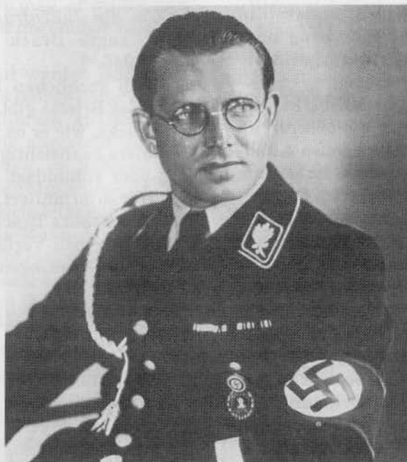
Reichsleiter der NSDAP Philipp Bouhler

"Wenn das der Führer wüßte" müßte man da sicher fragen. Für wen war Brack eigentlich tätig? Doch nicht für Himmler! Brack wußte, daß