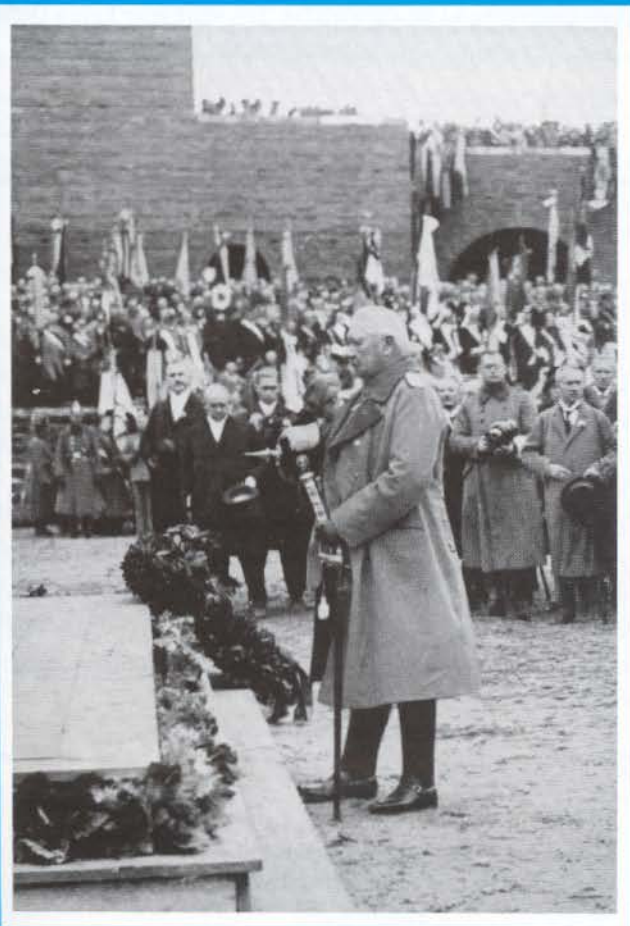
Reichspräsident Paul v. Hindenburg

Zwei ganz unterschiedliche Repräsentanten deutscher Politik