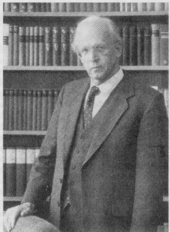
Prof. Dr. Ernst Nolte

"Jeder Überlebende hat mehr zu sagen, als alle Historiker zusammen, was geschehen war." 9)