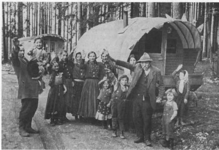
"Sogar Zigeuner begrüßten das Dritte Reich"