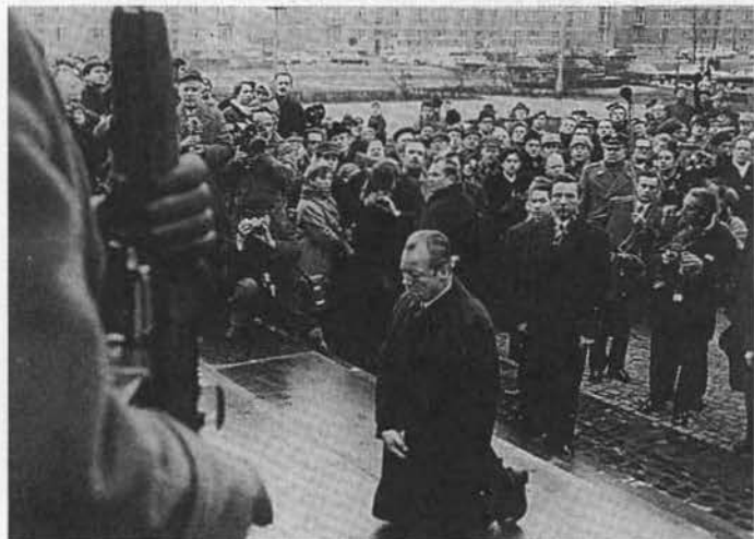
Der berühmte Kniefall des Bundeskanzlers Willy Brandt am 7.12.1970 vor seinen gefallenen polnischen Partisanen-Kampfgefährten in Warschau. -- Vergl. Kommentar zum gleichartigen Gedenken seines SPD-Nachfolgers Gerhard Schröder an derselben Stelle Jahre später (S. 26).

eine Million Schurken, nun, auch einige tausend Kreisleiter und darüber von ihren eigenen Landsleuten ins Jenseits expediert worden wären. Statt dessen kam Gerechtigkeit, Ordnung, Abrechnung und Entnazifizierung zu uns von draußen. Deshalb hatte der Nürnberger Prozeß niemals eine heilende Wirkung. Viel vom Gerechtigkeitsgefühl wurde auch verdorben, weil vie-