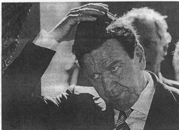
Bundeskanzler Gerhard Schröder bereitet sich zum Gedenken der anderen vor.

Stalin hatte den Auschwitz-Lager- und Industrie-Komplex nach seiner Eroberung 1945 ein halbes Jahr hermetisch abriegeln lassen, um der internationalen Weltöffentlichkeit keinerlei Möglichkeit zur Überprüfung der über Auschwitz bereits in den westlichen Medien seit Ende 1944 verstärkt verbreiteten Schreckens-Nachrichten zu geben. Auch beantworteten die Sowjets dringende Anfragen der britischen Regierung nicht, darüber wenigstens auf diplomatischen Kanälen Auskünfte zu geben, was sie denn nun wirklich in Auschwitz vorgefunden hätten. Nachdem dann die Sowjets am 7. Mai 1945 ihren seltsamen "Untersuchungskommissions-Bericht" herausgebracht hatten, 88) interessierte sich die in-