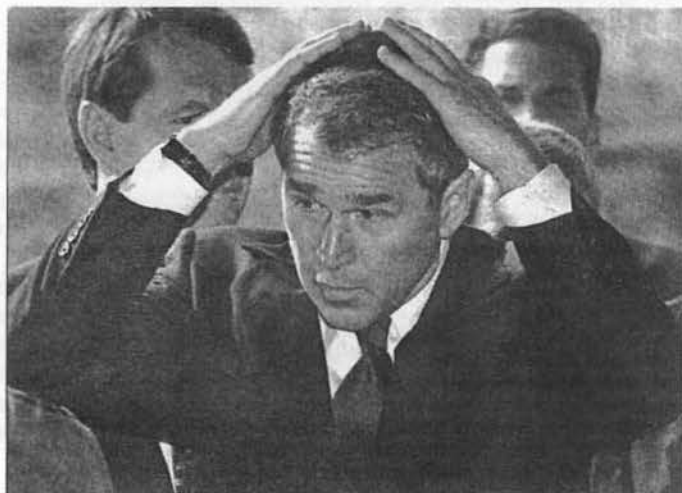
US-Präsident George W. Bush in Vorbereitung auf das Gedenken spezifischer Opfer.

Als Ernst Bevin, Englands Außenminister, sah, was die Alliierten mit den 12 Millionen heimatvertriebenen Deutschen taten, ..., rief er im Parlament aus: »Wahrhaftigen Gottes, das ist die Höhe des menschlichen Wahnsinns. ... Es war ein fürchterliches Schauspiel!« -- Es ist ein Verbrechen, kein Wahnsinn." 63)