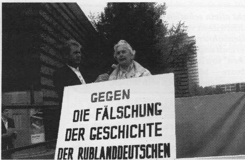
Auf der Demonstration der Rußlanddeutschen vor dem Landtag in Düsseldorf im Mai 2009

"kein Wort davon steht, daß dies der Ort der Judenvernichtung war." 52)