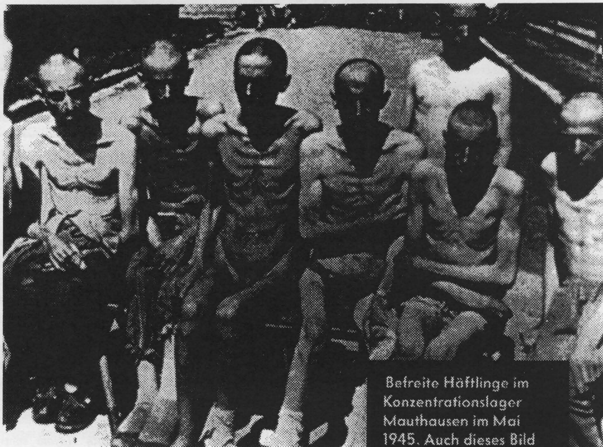
Befreite Häftlinge im Konzentrationslager Mauthausen im Mai 1945. Auch dieses Bild wurde Mahler gezeigt**

Unter dem Titel : "So spricht man mit Nazis -- die Demaskierung eines Staatsfeindes" verwendete Michel Friedman in seinem Interview mit Horst Mahler -- veröffentlicht in der Zeitschrift Vanity Fair , Nr. 45, November 2007, S. 87 das obere, mit Retusche zusammengestellte "Foto" angeblicher -- seltsam ähnlich aussehender -- "Häftlinge aus Mauthausen". Der Vergleich mit einem Originalfoto (unten) enthüllt auch ohne viel Erklärungen die plumpe Machart der Fälschung: Alle Köpfe sind "kunstvoll" mit gleichartig schwarzem "Schatten"-Dreieck aufgesetzt, die Augen durchgängig schwarz, schwarze scharfe Schattenabgrenzungen, überall, unterschiedliche Schattenführungen an den Beinen, unwirklich schwarze Hintergrundpartien.