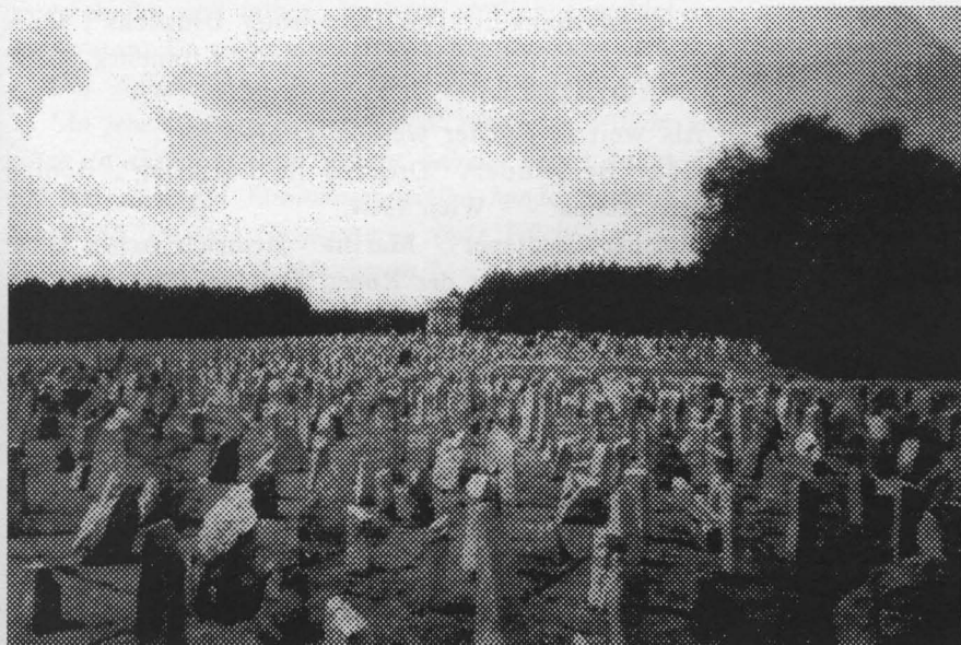
Betonierter Lagerteil Treblinka, versetzt mit 17.000 Gedenkstelen. -- Foto Carlo Mattogno 1997.

Ein in dieser Form von der Süddeutschen Zeitung vorgestelltes Buch hat mit wissenschaftlicher Forschung nichts zu tun! Die Historischen Tatsachen hätten sich hiermit nicht befaßt, wäre nicht der Desinformationscharakter des hier von einem Priester geschriebenen und seitens der Presse angepriesenen Buches so dick und schamlos zusammenfassend vorgetragen und wäre nicht besonders auf die enge Verbindung zum protegierenden Jüdischen Weltkongreß hingewiesen worden.