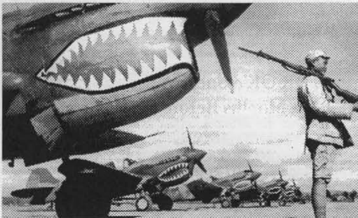
"Flying Tigers" in China im Sommer 1941, bewacht von einem nationalchinesischen Soldaten. 50 B-17-Bomber wären zum Einsatz gekommen, falls die Absicht des Holocausts auf Nagasaki, Osaka und Tokio ausgeführt worden wäre. 10)

Zwar versuchten die japanischen Politiker bis zuletzt, auf diplomatischem Wege die wirtschaftliche Existenzbedrohung wieder aufzuheben, doch mußten sie sich auch Gedanken machen, sich militärisch Zugang zu für sie lebenswichtige Rohstoffquellen im Fernen Osten zu erschließen, auch gegen den Willen der USA und Großbritanniens. Roosevelt zwang sie mit umfassenden