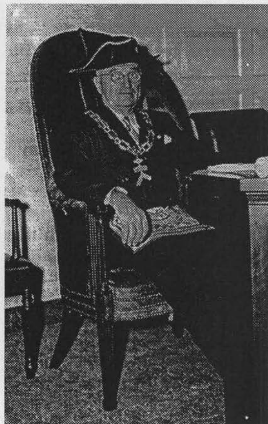
US-Präsident Harry S. Truman im Freimaurerlook am 6. Juni 1951 in Alexandria/Virginia.

Als er Anfang August 1945 befohlen hatte, Hiroshima und Nagasaki mit Atombomben zu belegen, war ihm bekannt, daß Japan bereits seine Bereitschaft zur Kapitulation bekundet hatte. Der Mord an hunderttausenden Zivilisten ist offenkundig. Man braucht kein Gesetz zur Abstrafung von "Leugnern". Weder ist dieser Massenmord gesühnt, noch hat er das Gemüt des "Täters" beeinträchtigt, noch wurde die US-amerikanische Bevölkerung dafür in unbegrenzte Kollektivverantwortung genommen.