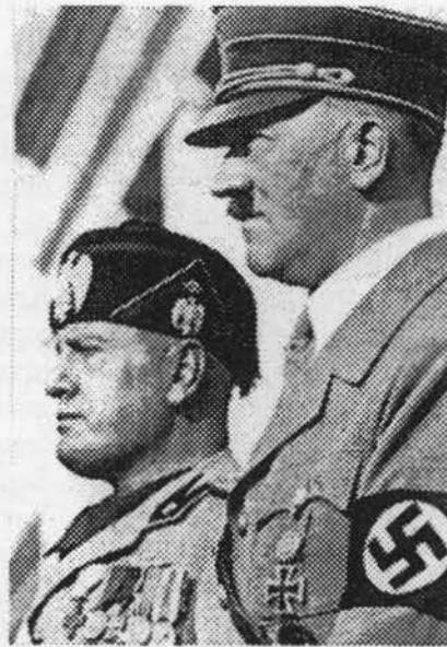
Adolf Hitler und Benito Mussolini

Wir wissen, welche Kraft hinter Roosevelt steht. Es ist jener ewige Jude, der seine Zeit als gekommen erachtet, um das auch an uns zu vollstrecken, was wir in Sowjetrußland alle schauernd sehen und erleben muß-