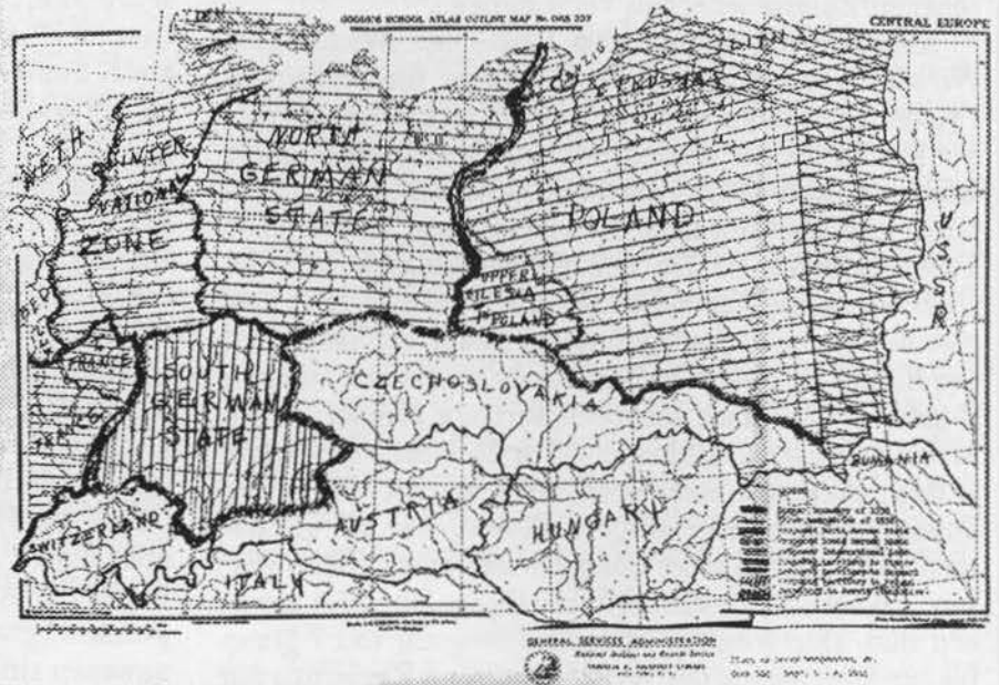
Morgenthau's Deutschland-Plan, abgedruckt in: "Morgenthau Diary (Germany)", US Government Printing Office, Washington 1967, Volume I. p. 555.

für den Holocaust von Berlin nicht mit irgendwelchen Untaten der Deutschen begründet! Von einem erst nach dem Krieg bekanntgemachten "Deutschen Holocaust gegen die europäischen Juden" hatte er nichts gewußt! Seine begründungslose Volksmord-Zielsetzung entsprach genau jenen, die bereits vom britischen und US-amerikanischen Boden aus 1933 Deutschland den Krieg bis zur Existenzvernichtung erklärt hatten.