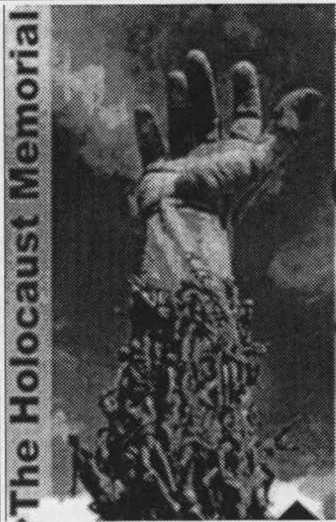
Das Denkmal in Miami/Florida/USA ohne Sachnachweis haben BRD-Wiedergutmachungsbeflissene "zum ewigen Gedenken" errichten geholfen.

Walker schloß seinen Bericht ab: Die Beute an deutschen Kriegsgeheimnissen sei berghoch, niemals in der menschlichen Geschichte habe es Vergleichbares gegeben.