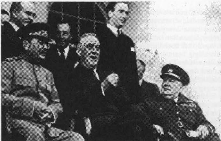
Auf der Konferenz von Teheran (27.11. - 2.12.1943) empfahl Stalin die Erschießung von 50.000 deutschen Offizieren. F.D. Roosevelt schlug 49.500 vor, -- als "Kompromiß", um Winston Churchills Unmut zu dämpfen. Einig waren sich "die Drei Großen" auch bei der Auslieferung ganz Osteuropas an den Bolschewismus, Vertreibung der ostdeutschen Bevölkerung aus ihrer Heimat und Zerstückelung Deutschlands.

in Washington Constantin Umansky (am 6. November 1941 wurde er durch den Juden Maxim Litwinow-Finkelstein ersetzt) eine Unterredung hatte, seinen Beauftragten für die Englandhilfe Harry Hopkins von London nach Moskau, um Stalin ein amerikanisches Unterstützungsangebot zu machen. In diesem Zusammenhang spielte eine besondere Rolle die auf Roosevelts und Churchills Vorschlag abgehaltene Moskauer Konferenz vom 29. September bis 1. Oktober 1941 auf der amerikanische und britische Vertreter mit den Bolschewisten über die Regelung der Hilfeleistung an die Sowjetunion verhandelten. Aus diesem Anlaß richtete Roosevelt an seinen "lieben Freund Stalin " eine persönliche Botschaft, in der er u. a. erklärte: