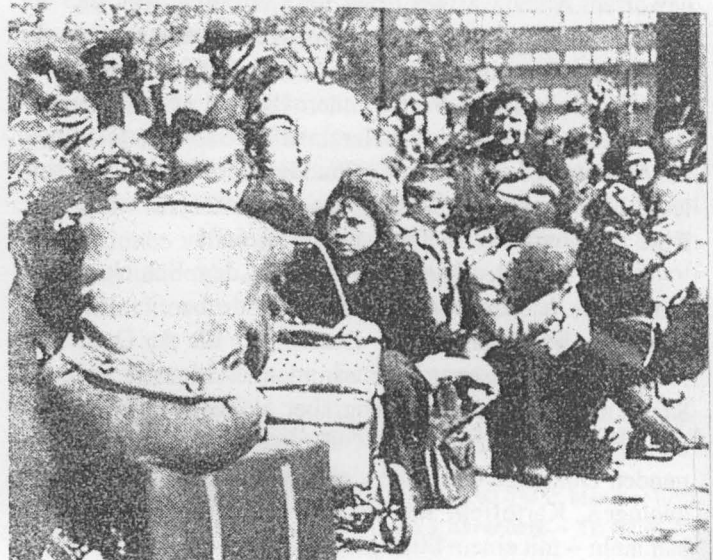
Film: "Töten auf tschechische Art"