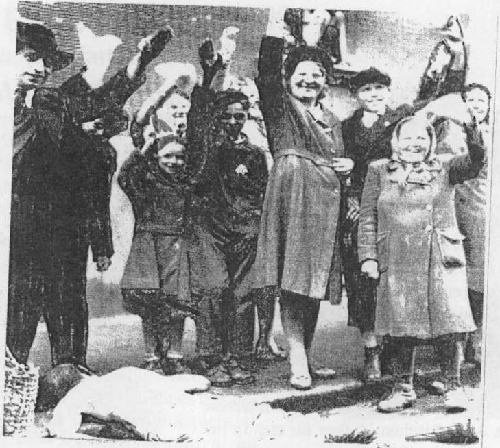
Tschechische Mörderbanden wüteten im Mai 1945 in dieser ehemaligen österreichischen Kavalleriekaserne in Postelberg, Sudetenland.

Am nächsten Morgen durften wir die Toten aus dem Stall entfernen. Dadurch entstand etwas mehr Platz. Für die Notdurft stand im Stall ein großes Faß, das aber schon voll war, als wir hinkamen. Also machte jeder unter sich. Von