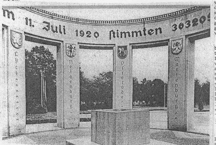
Abstimmungsdenkmal in Allenstein. Das von Polen in Versailles 1919 aus reiner Willkür beanspruchte Südostpreußen blieb dank der Abstimmung seiner deutschen Bevölkerung beim Deutschen Reich.