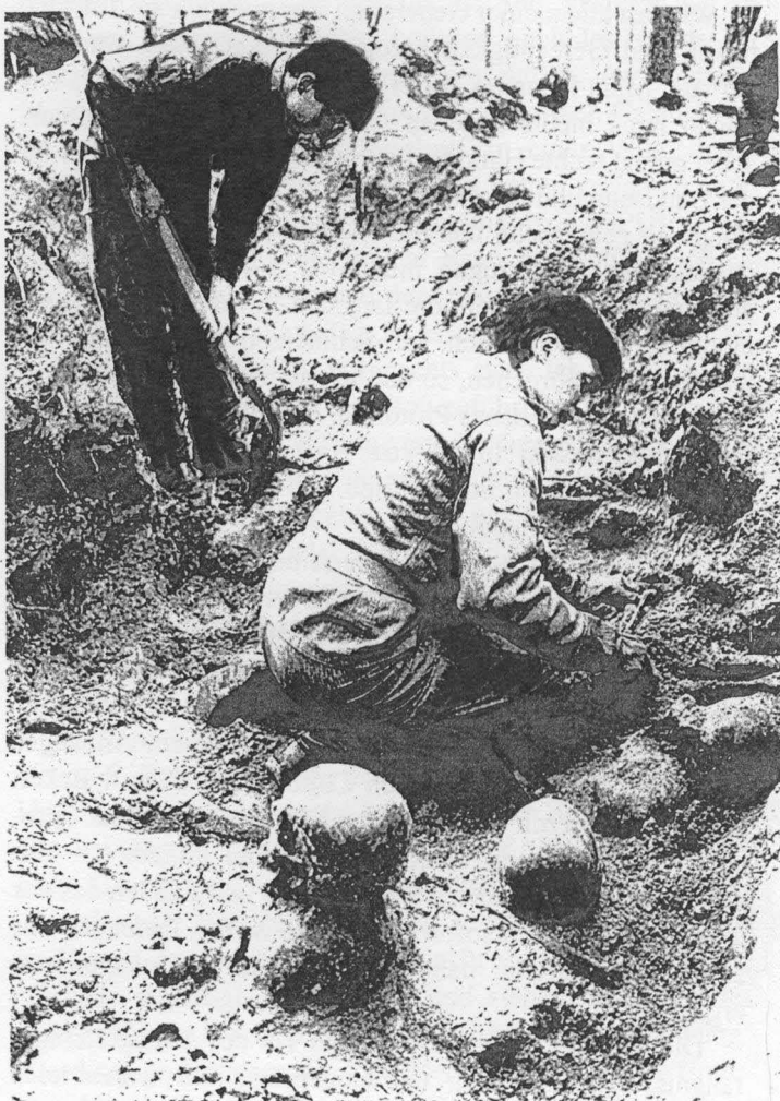
Soldaten der kommunistischen "Volksarmee" (NVA) exhumieren im Jahr 1990 Leichen des NKWD-Lagers Sachsenhausen.

Für die Notdurft gab es den 'Donnerbalken' über einer langgestreckten Grube. Der Anmarsch erfolgte in Gruppen. Papier zum Abwischen gab es nicht. Der nächtliche Toilet-