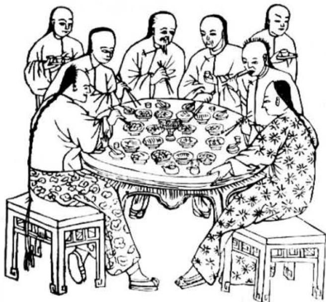
Un repas d'amis