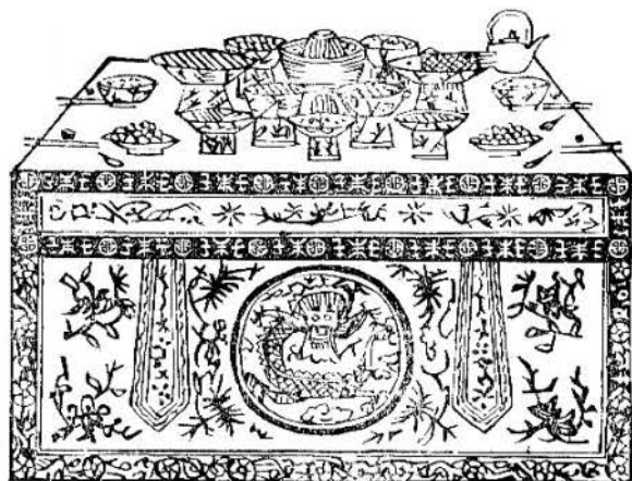
Un dîner de cérémonie. La table