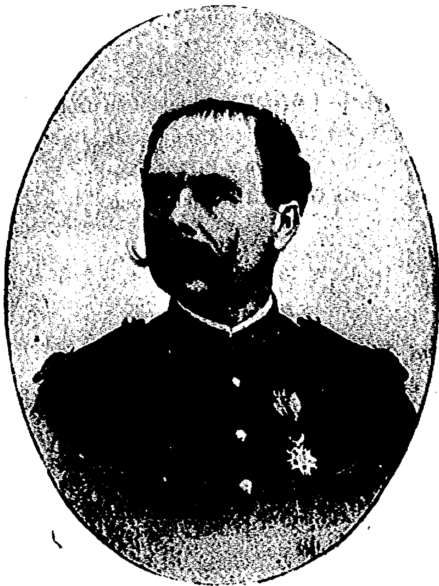
LE COLONEL DE VILBOIS-MAREUIL.