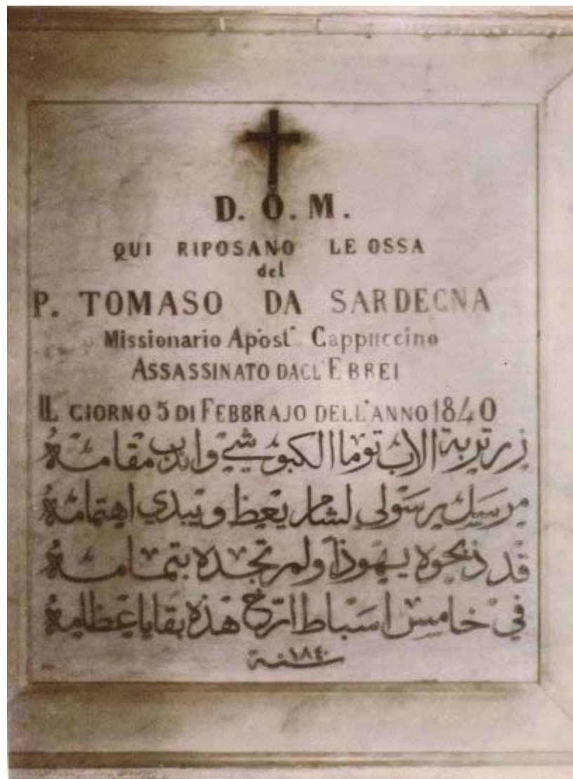
Lápida de la tumba del Padre Tomás