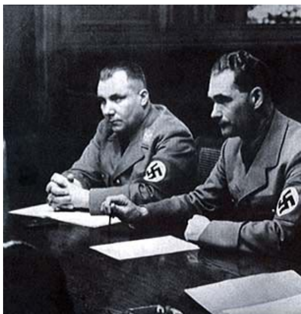
Martin Bormann i Rudolf Hess

“Kada u budućnosti naša mladež više ništa ne čuje