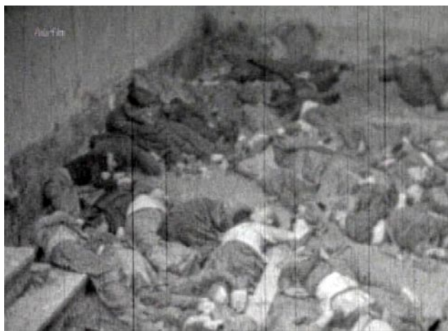
Boljševički zatvori puni izmasakriranih leševa Ukrajinskih civila