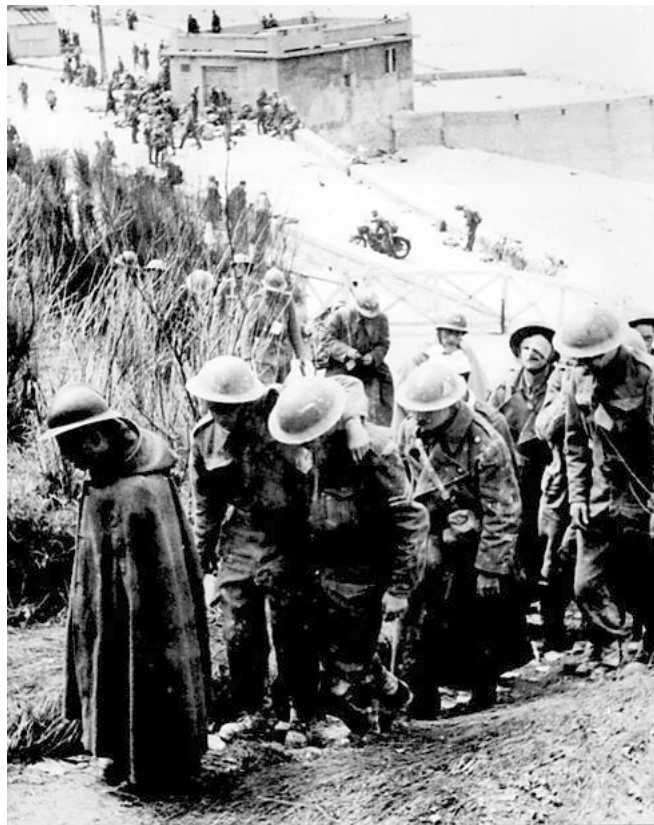
Britanski zarobljenici kod Dunkirka (Francuska)

O: Izdajnički časnici, koji su znali za Njemački plan invazije na Britaniju znan kao operacija “Morski lav” obavijestili su Hitlera da pomorska invazija na Englesku nije moguća. Napravili su to izvješće, iako su znali da to nije istina, zbog sprječavanja invazije iz političkih razloga. Sve to je izašlo na vidjelo nakon