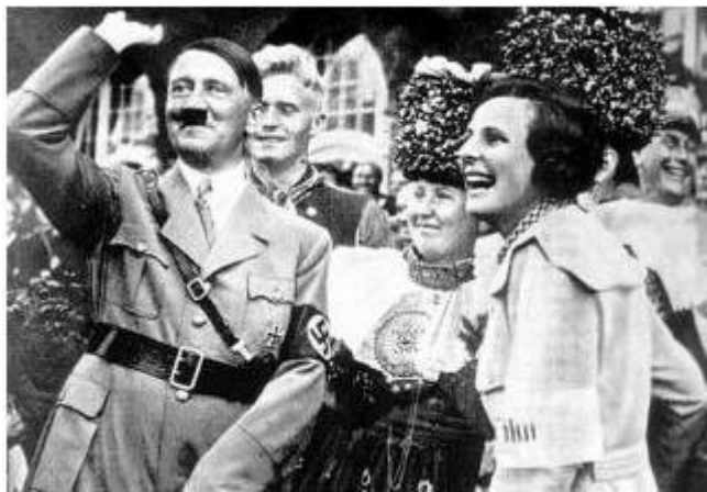
Hitler i Unity Mitford (Churchillova nećakinja)

O: Ne, ovi anti - židovski pogromi su bili izraz bijesa ljudi. Oni su mrzili Židove.