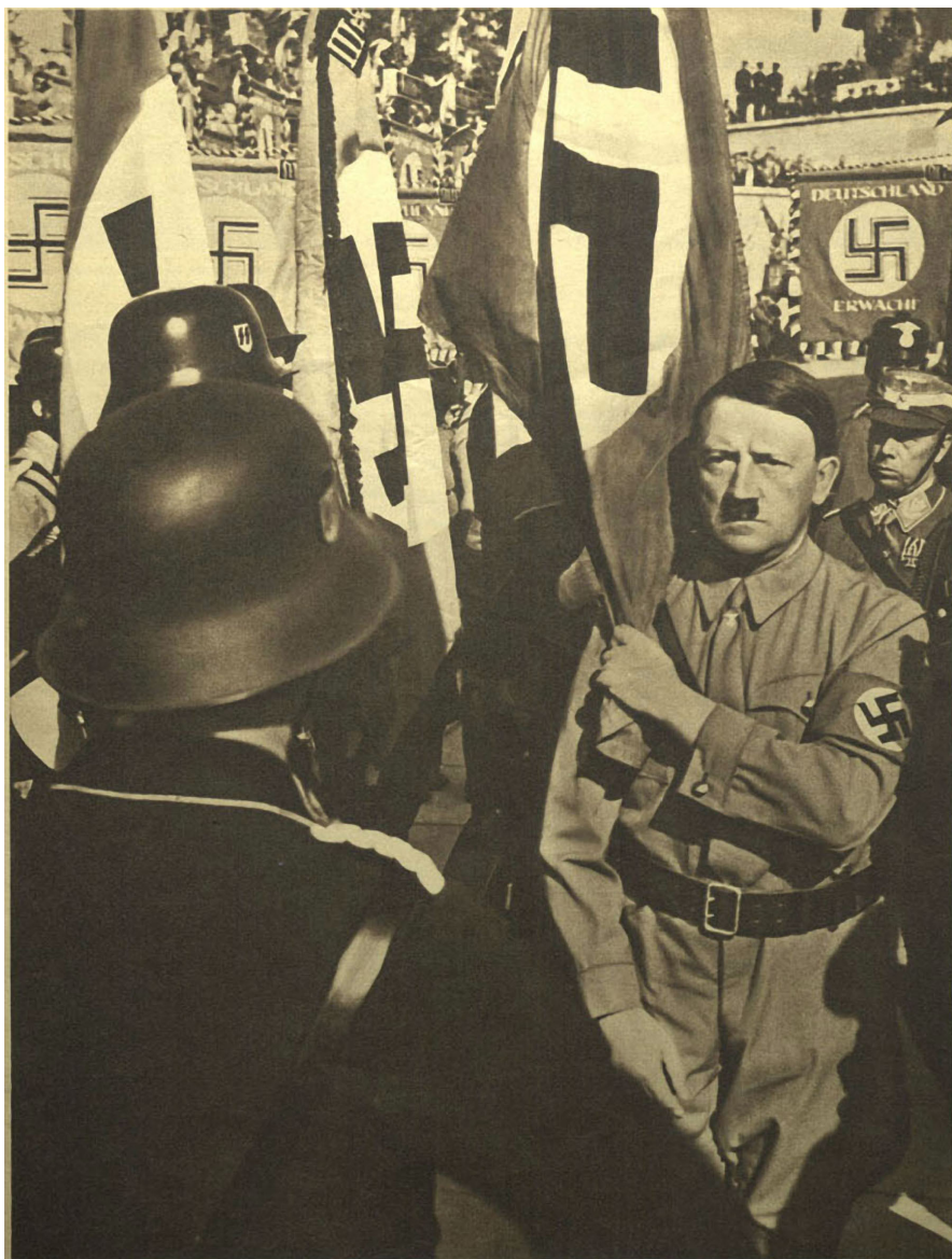
ADOLF HITLER SA ZASTAVOM KRVI U NÜRNBERGU 1936.

Na stranačkom skupu održanom u Weimaru 4.6.1926., Adolf Hitler je članstvu prezentirao zastavu i otada je ona poznata pod imenom Blutfahne. Nakon toga Hitler je zastavu koristio za posvećivanje svih novih stranačkih zastava, tako što bi ih dodirnuo jednom rukom, dok bi u drugoj ruci držao Blutfahne.