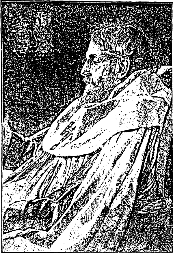
Nach einer Federzeichnung von Sigand F. Widholm.

„Und mögen auch die Wassermogen brüllen, Und Berge stürzen und die Täler füllen, Kein feind, kein Hunger kann die Burg bezwingen, In der des Grales ew'ge Brunnen springen.“