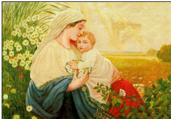
Adolf Hitler (1889 – 1945)

A de tels chrétiens, nous pouvons donner le nom de camarades, et nous pouvons être fiers de les avoir dans nos rangs.