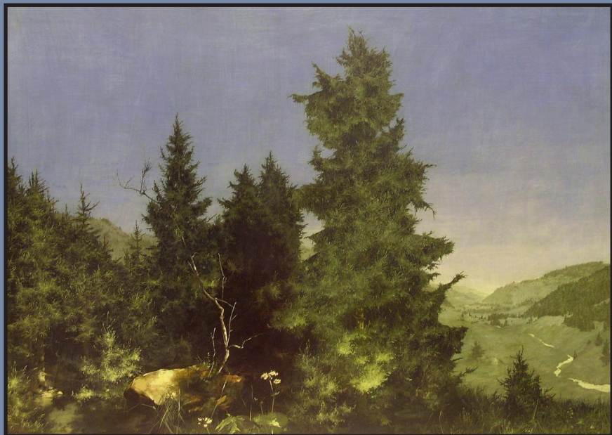
Willy Krieger ; Am Rande des Waldes 1944