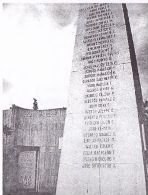
Monumento en el Cementerio General, levantado en homenaje a los mártires nacionalsocialistas chilenos, con los nombres de todos ellos. Simbólicamente, o por un “azar lleno de sentido” (como diría Nietzsche), justo atrás aparece el mausoleo de la familia Valech.

me reveló que pensaba escribir la Historia del Nazismo , para lo que había recibido la autorización de la Iglesia. Me pedía que le facilitara una colección de mi revista La Nueva Edad , para completar sus recuerdos, junto con lo publicado en Acción Chilena . Acepté complacido y se la hice llegar a través de un amigo. Después de un tiempo, “religiosamente” me la devolvió. Estoy seguro que terminó su libro, el cual tendrá un valor muy grande y que ya nunca nadie conocerá en Chile, fuera de la más alta jerarquía eclesiástica, de aquí, o del Vaticano.