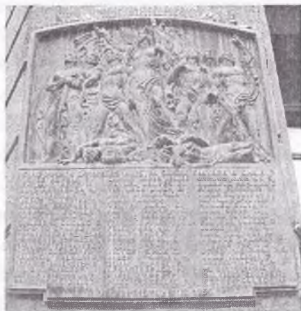
Placa recordatoria a un costado del edificio donde se asesinó a los jóvenes nazistas chilenos, el 5 de septiembre de 1938. Aún se encuentra.