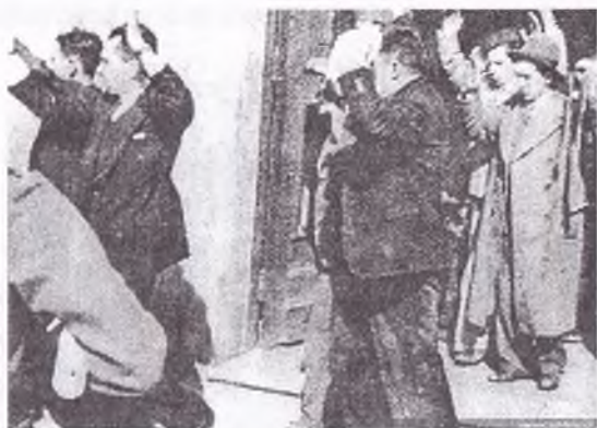
Brazos en alto, rendidos, los masacraron a todos.