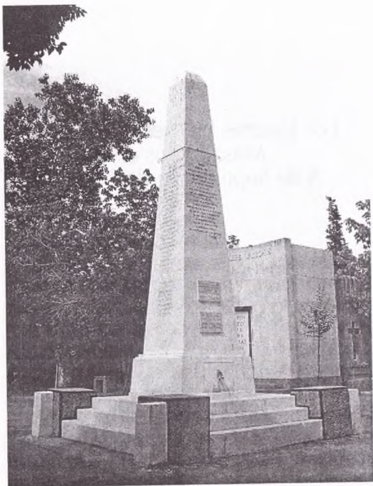
El monumento recordatorio, a la luz del atardecer.