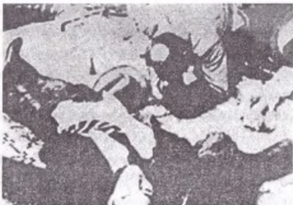
Los jóvenes nazistas, muertos y masacrados, dentro del edificio del Seguro Obrero.

cortaron sus dedos para quedarse con los anillos; sus manos, para llevarse los relojes de pulsera. Fue una increíble masacre. El Auditor Bravo cuenta que cuando entró y trató de subir por las escaleras se lo impedían los cadáveres mutilados y la sangre que corría por los escalones. Todos los cadáveres tenían los brazos abiertos, lo que prueba que se hallaban rendidos cuando fueron masacrados. En la Universidad de Chile también vio muertos y charcos de sangre.