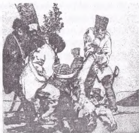
Grabado de Goya que ilustra las torturas en España durante la Guerra de la Independencia del dominio de Napoleón.

los grabados de Goya sobre la Guerra de la Independencia... El asesinato de Mussolini y Clara Petacci... El asesinato de Rudolf Hess, tras años de tortura en la prisión... Entonces, ¿qué?, ¿por qué? ¿Y los guardaespaldas de Indira Gandhi, que la asesinan a ella, tan frágil, tan indefensa? Los "Derechos Humanos"... ¡Qué risibles! Son una hipocresía y tienen un límite incruzable: la condición humana. Es más, el Demonio en lo Humano, pues el animal, salvo el gato, no mata por crueldad sino por necesidad. El hombre no. Como si hubiera un Demonio que entra y sale de él. Porque aun el gato, cuando juega con el ratón, lo haría porque la carne es más blanda y sabrosa a causa de la sustancia que la rata exuda por el terror. Hay ahí una