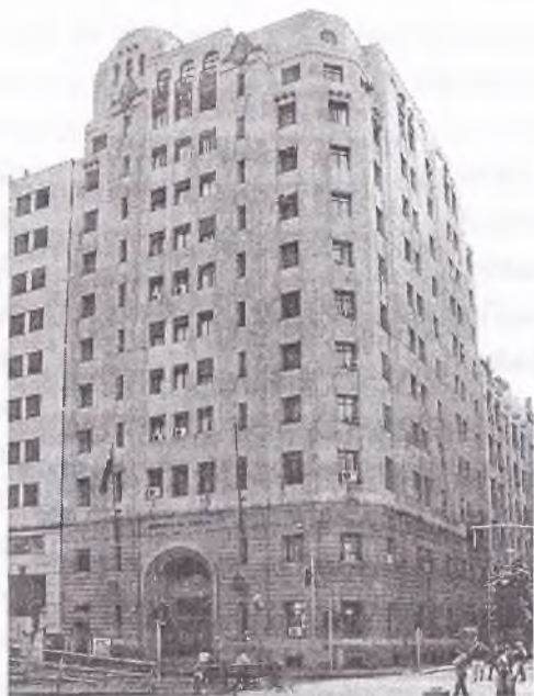
La Torre del Seguro Obrero, hoy sede del Ministerio de Justicia, la "Torre de la Sangre".