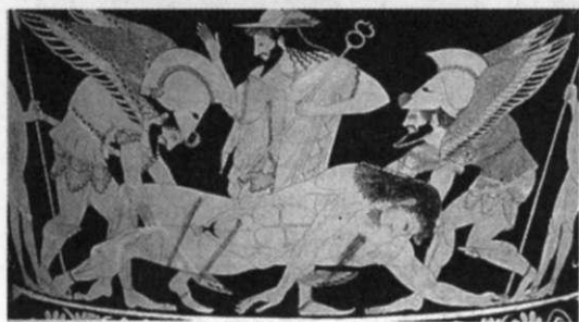
4. kép: Hüpnosz, Hermész, Thanatosz és Sarpedon teste

Thanatoszt fekete, szárnyas, sötét szemű géniusznak is ábrázolják, aki áldozati késével levágja a haldokló egy hajtincset. Thanatosz később Gaia és Tartarosz fiaként jelenik meg, hétalvóként, általában szép fiatal férfi vagy fiú alakjában, kezében lobogó, de már lefelé néző, vagy éppenséggel eloltott fáklyával.