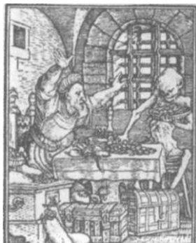
8. kép: ... a gazdagot...

A századok során valamelyest változott a halál ábrázolása is. A 18. században a memento-mori gondolat további képi megfogalmazásaival találkozunk. Ilyen például az „élet-lépcső” szerkezet. Ez a férfi és a nő korfokozatait mutatja be tíz lépcső formájában, ahol a bölcsővel a korporsót állítja szembe: „10 éves a gyermekség, 20 éves a fiatalság, 30 éves a virágzás, 40 éves a meglegeedettség, 50 a leállás, 60 az öregkor, 70 az aggkor, 80 az őszfej, 90 a második gyermekkor, 100 év isteni kegyelem.”