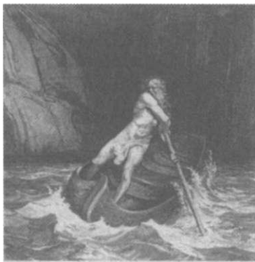
3. kép: Kharón, a révész, aki az elhunytak alvilágba érkező lelkeit átviszi a Sztüx folyón

A görögöknél Thanatos volt a halál képi megszemélyesítője, aki az elhunytakat elviszi Hádész birodalmába. Thanatos t gyakran összetévesztik Kharónnal is, az alvilág révészével, aki az elhunytak lelkeit átviszi a Sztüx folyón. Kharórt t fukar, mogorva, de élénk öregnek ábrázolják. Erebosz és Nüx fia Hádészt szolgálja. A révészkedésnek árat is szabott. A fizetség, az obolosz, egy érme volt. Ezt a görögök halottaik nyelve alá (más források szerint, így a római időkben is, szemekre) helyezték. A legendák szerint Kharón nem szállított át olyan holt lelket, akit nem temettek el tisztességesen. Azoknak a folyó partján kellett bolyonganiuk, mint azoknak is, akik nem adtak oboloszt, és várniuk kellett, míg Kharón megszánja és átviszi őket „ingyen”.