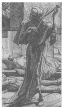
6. kép: A halál tánca

A pestis következtében, melynek 1347 és a 15. század vége között Európában rengetegen estek áldozatul, ezekkel az eleinte kézzel írt, később képekkel ellátott útbaigazítókkal a halál mindenkor jelen volt.