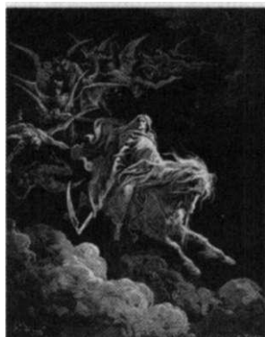
10. kép: Gustave Doré „Megnyilvánulás”

Véleményem szerint fejlődést csak tudásszomj és ötletesség tesz lehetővé, az anyagban, ahol új elképzelések vezetnek új fejleményekhez, a szellemi téren pedig a látókör tágítása és megnyitása, a kísérletezés új gondolatmenetekkel.