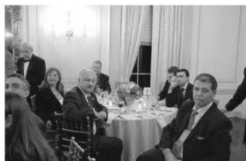
GUILLERMO TELLIER PRESIDENTE DEL PC

El ambiente estaba especialmente tenso en las afueras del edificio del Council of the Americas la poderosa institución norteamericana fundada por David Rockefeller, ubicada en el centro financiero de Nueva York ya que un grupo de manifestantes chilenos estaba con baldes con agua y hielo esperando a la comitiva de la Presidenta Bachelet para lanzárselos como señal de protesta por participar de una comida que estuviera coauspiciada por la empresa minera Barrick Gold responsables en Chile de Pascua Lama, pero la situación se evitó debido a que el ingreso fue por una zona estratégica y los más de cien exclusivos invitados representantes de las empresas más grandes de Estados Unidos tales como Citibank, JPMorgan, Nestle entre otras pudieron escuchar a la Presidenta Michelle Bachelet apoyar a su Ministro estrella Andrés Velasco por la exitosa gestión económica que este lideró en estos años y que le dio estabilidad y solidez económica al país. ■