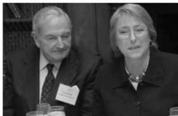
DAVID ROCKEFELLER Y MICHELLE BACHELET