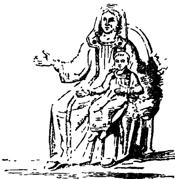
La Sainte Vierge et l'Enfant Jésus, Fresque du Cimetière de Domitille. (V. Martigny, p. 658.)