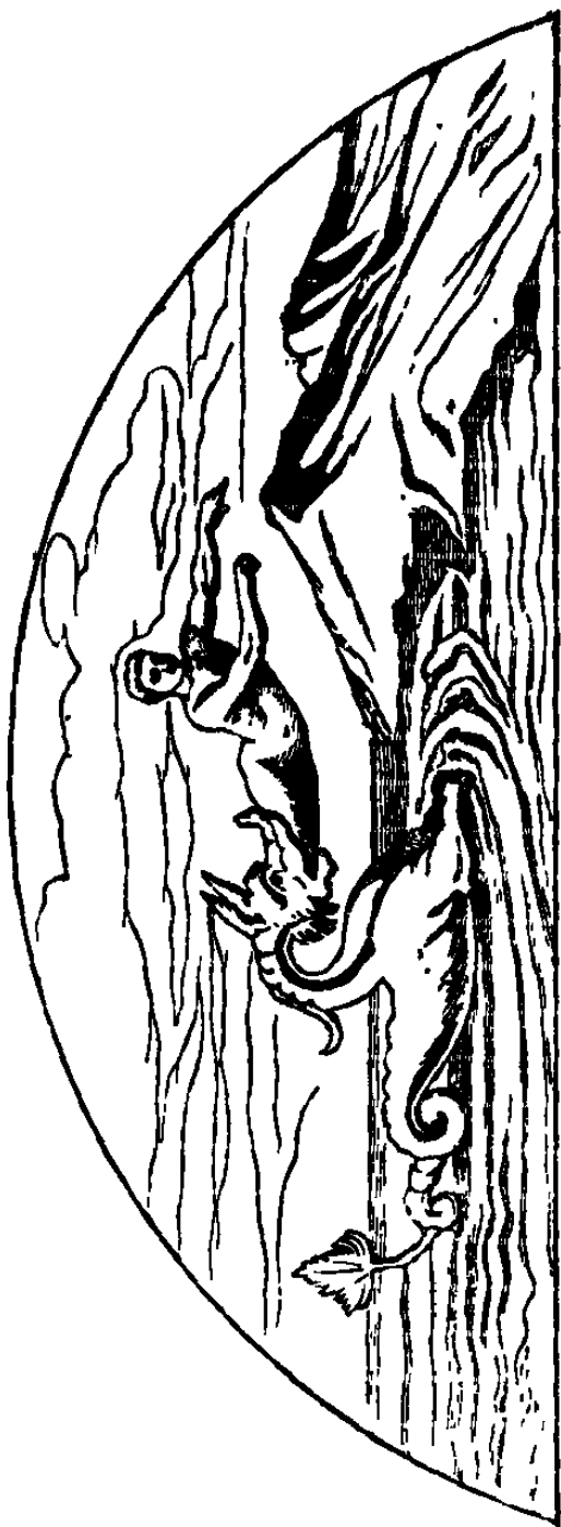
Le prophète JONAS, figure de la Résurrection de Notre-Seigneur Jésus-Christ. (Matt., XII, 40.) Fresque du cimetière de Saint-Calliste. (Martigny, p. 344.)