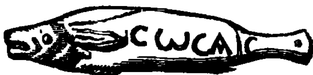
Poisson de bronze destiné à être porté au cou, et sur lequel est écrit le mot ICWCALC , Salsa ; ce qui, hiéroglyphe et inscription réunis, compose cette invocation : « JÉSUS-CHRIST, FILS DE DIEU, SAUVE-NOUS. » (Martigny, p. 545.)

païenne que l'on ne trouve que dans les plus anciennes inscriptions des Catacombes, et qu'il faut attribuer à l'atelier païen où la plaque de marbre a été achetée, et quelquefois à l'ignorance d'un fossoyeur. Cette dernière supposition peut s'appuyer sur l'exemple suivant. Il y a une remarquable épitaphe d'un certain Licinius sur laquelle on voit en haut le mot IXΘYC suivi de D.M., pardessus une ancre et de chaque côté un poisson avec l'inscription importante, poisson des