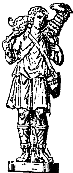
JÉSUS-CHRIST sous la figure du BON PASTEUR. Statue de marbre blanc. (Martigny, p. 515.)