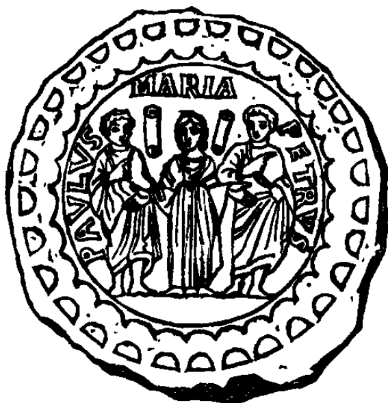
Fond de verre doré représentant la sainte Vierge entre saint Pierre et saint Paul ; dans le champ, deux volumes symboles de la loi divine. (Martigny, p. 660.)