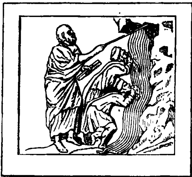
Môse frappant le rocher : figure de saint Pierre qui, établi guide du peuple chrétien, fait jaillir de la pierre, qui est Jésus Christ, les eaux de la vie éternelle. (V. Dict. des antiquités chrétiennes, p. 412.)

admirablement tous les rayons resplendissants de la prérogative pontificale et son triple pouvoir de suprême docteur, de suprême pasteur et de chef suprême dans toute l'Église.