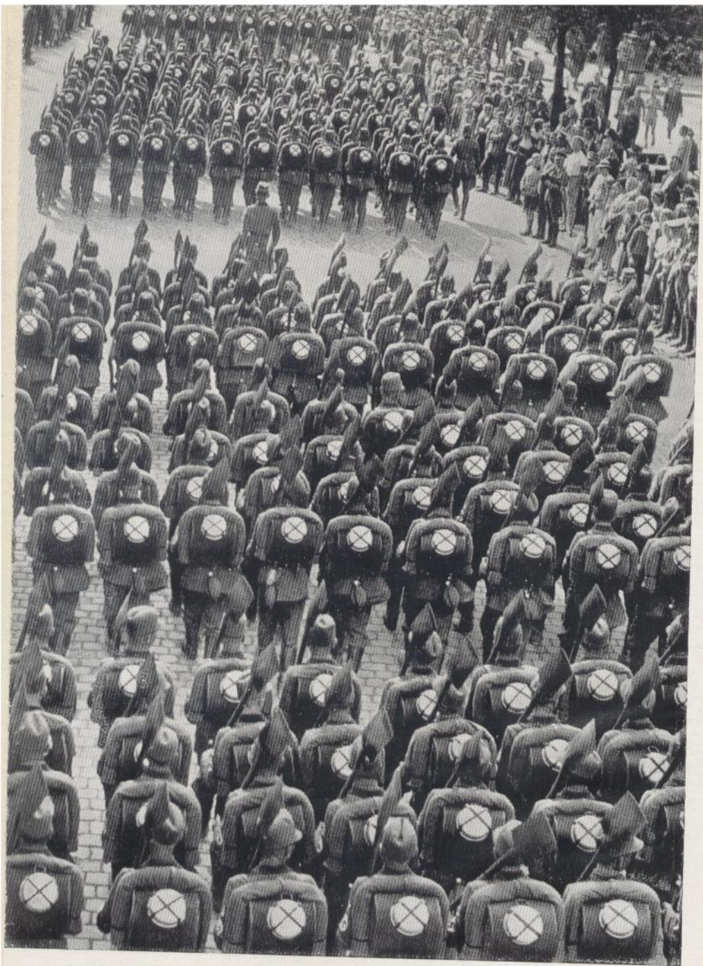
Dorbeimarsch des Arbeitsdienstes vor dem Führer in Nürnberg 1934