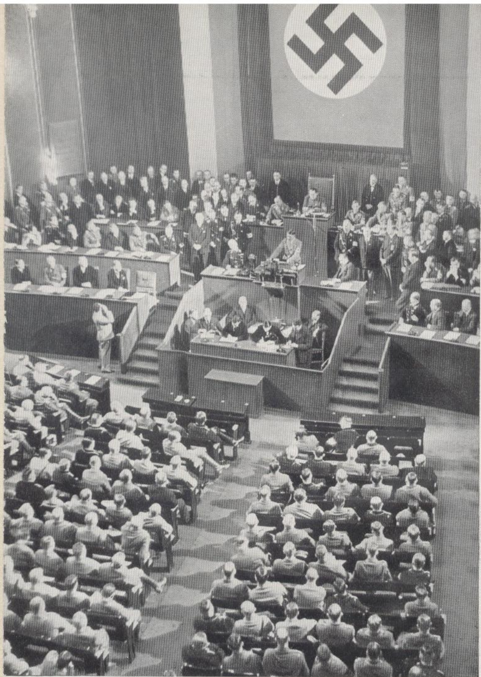
Die Reichstagsitzung anlässlich des 1. Jahrestages der nationalen Erhebung am 30. Januar 1934