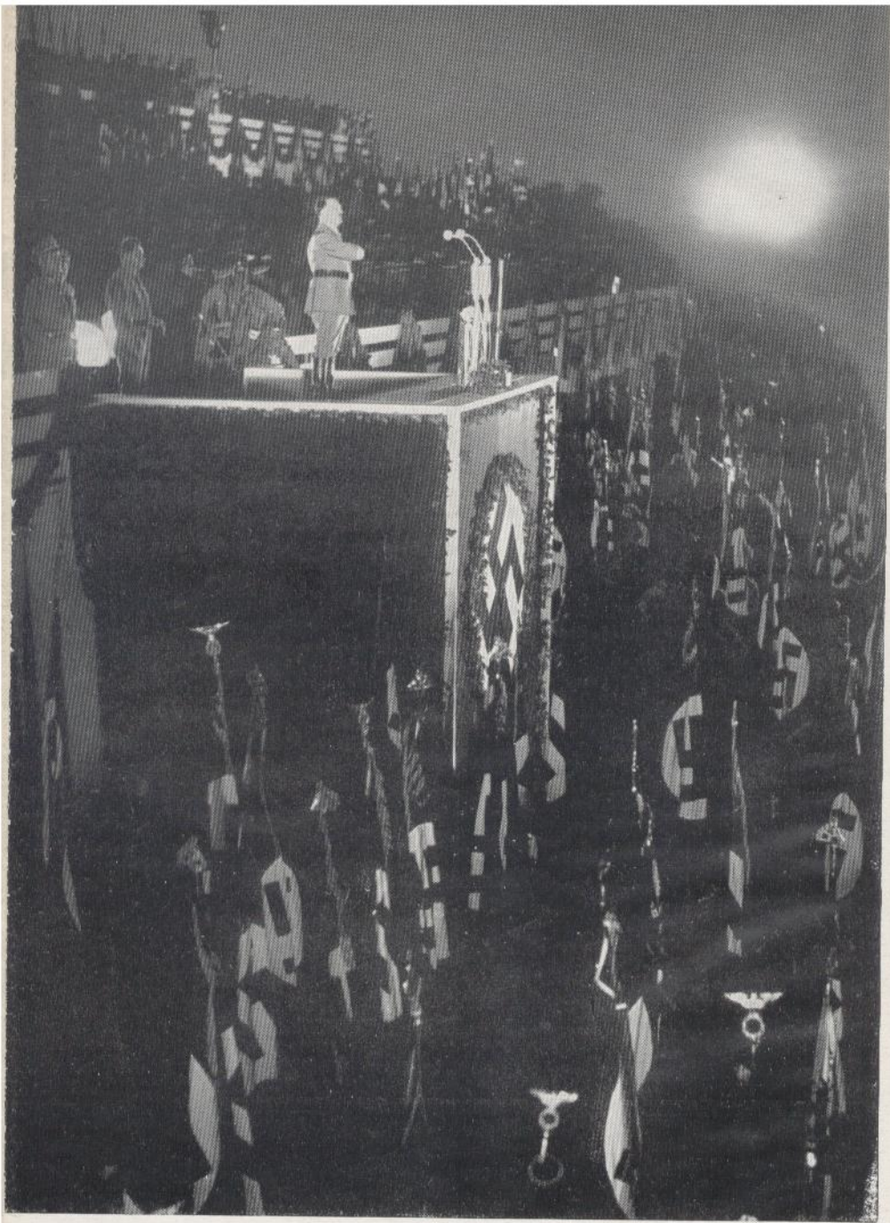
Der Führer spricht zu 180 000 Amtswaltern der PD. in Nürnberg 1934