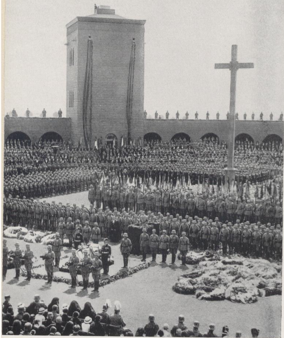
Der Führer hält die Gedenkrede auf den toten Generalfeldmarschall