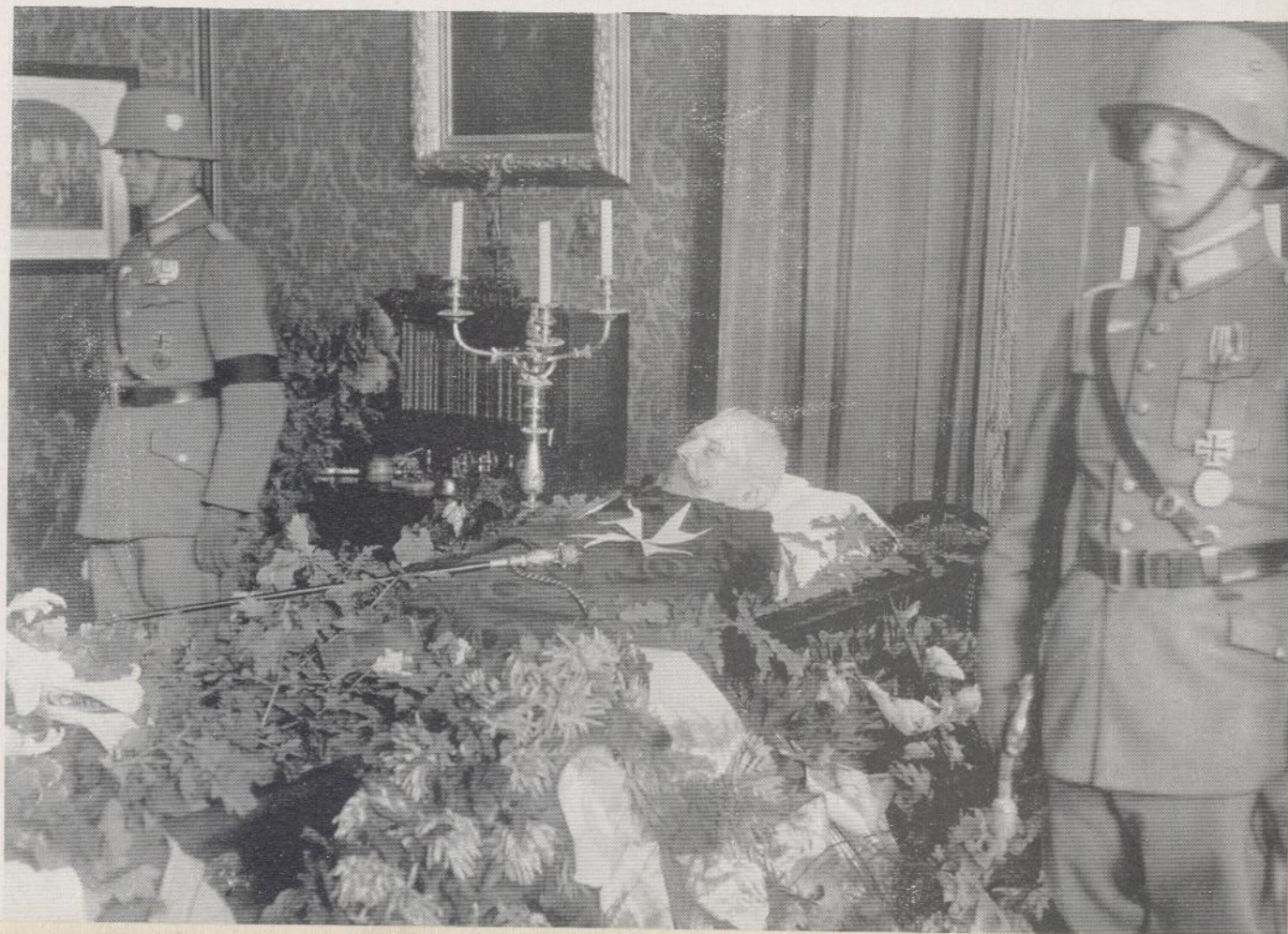
Reichs- präsident und General- feldmarschall Paul von Hindenburg †