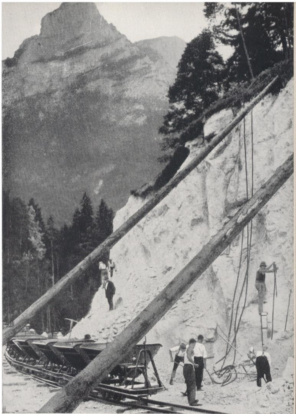
Deutschlands gewaltiges Aufbauwerk: Die Reichsautobahnen Die Alpenstraße im Berchtesgadener Land