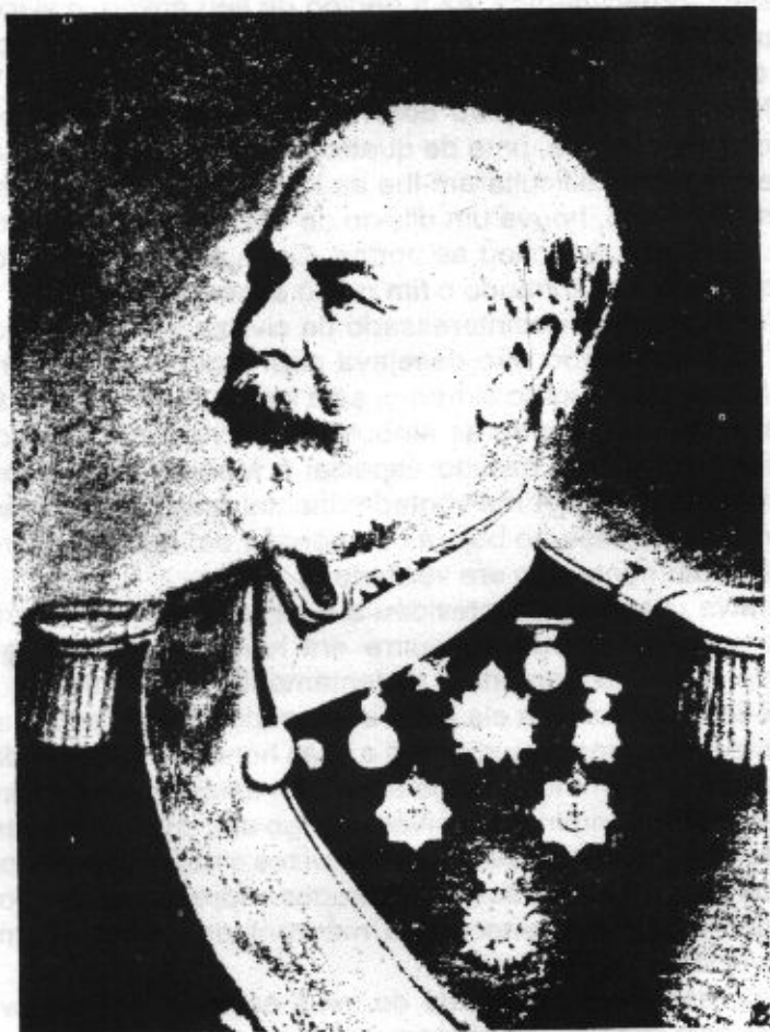
General Osório, marquês de Herval

A 2 de dezembro de 1864, o visconde do Rio Branco substituiu o conselheiro Saraiva no Prata. A incógnita que existia por trás do governo de Aguirre era o Paraguai. Daí os desafios ao Brasil. Logo