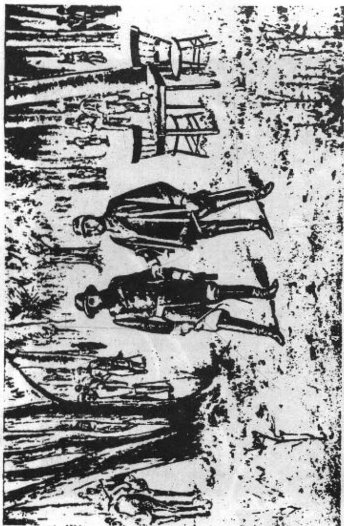
Mitre e Lopez na entrevista de Itaiti-Coru em 11 de setembro de 1866.