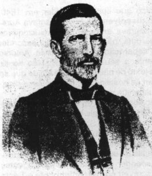
Teófilo Benedito Ottoni

Este mandou ao Rio Grande do Sul seu amigo e confrade das lojas, um dos propugnadores da Maioridade, Álvares Machado, na qualidade de agente secreto . Tudo isso é admirável e não se explica sem aquela Fraternidade Maçônica a que nos referimos. Um ministro