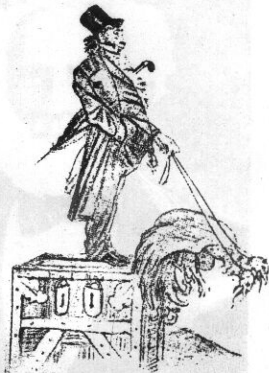
Caricatura de Rothschild (1840). Trepado no seu cofre, o barão assinalado dirige por uns cordéis a águia bicéfala do Império Austro-Húngaro; do mesmo modo dirigia o leopardo inglês...

Pondo de parte a veracidade das teorias de uma origem judaica do povo inglês, a história mostra contudo a lenta e segura conquista da Grã-Bretanha pelo judaísmo através dos tempos, desde Oliveira Cromwell, protetor dos judeus, ligado secretamente aos hebreus da Holanda e de Portugal. Essa conquista arrancou aos reinos católicos da Ibéria o domínio do mundo, sua realza econômica, passando-a às mãos de uma emporocracia talassocrática protestante-judaica, primeiro instala-