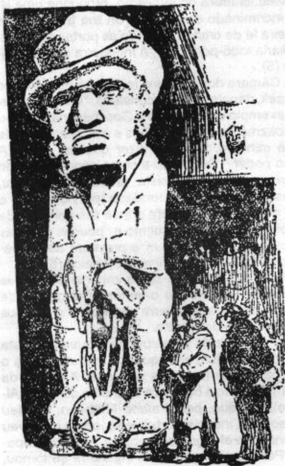
John Bull acorrentado por Israel (Caricatura inglesa)

ce ação preponderante nas revoluções internas do nosso país através de agentes de toda a casta, inclusive o general Miranda. Imiscui-se no Prata, onde desembarca tropas. Intervém na questão da Cisplatina e na guerra de Corso de 1825 a 1828. Pelo tratado comercial que