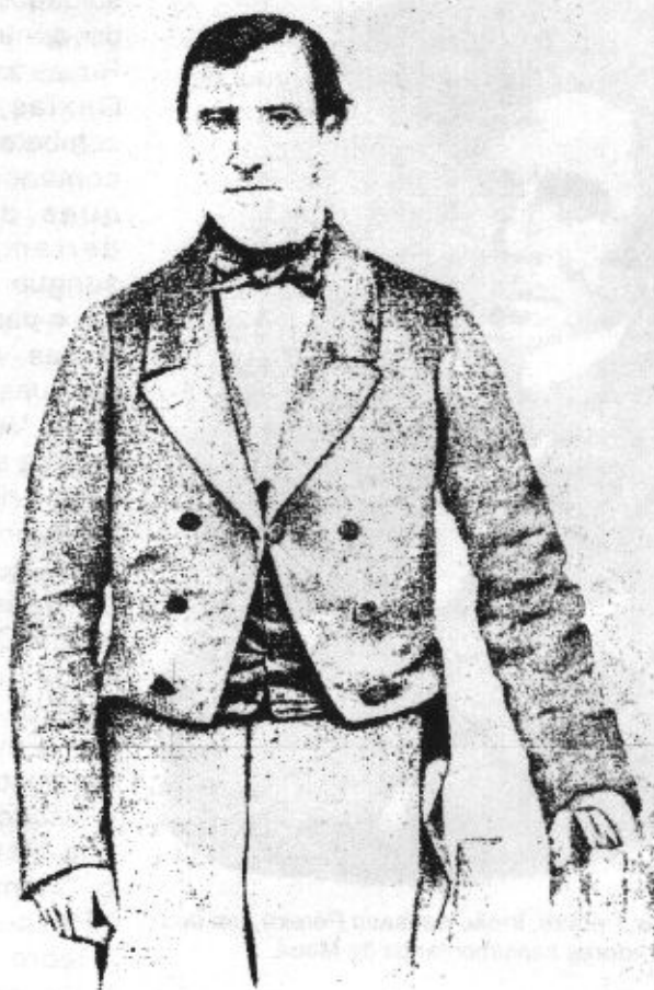
O Barão de Mauá 1858 (Sisson. Galeria de brasileiros ilustres)