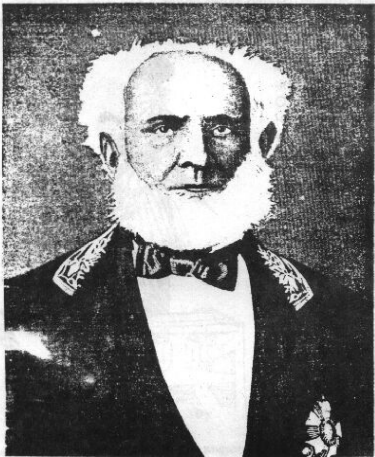
O Almirante Joaquim Marques Lisboa, marquês de Tamandaré.

A conquista revela-se a olho nu em 1830, quando os judeus iniciam a luta pela abrogação do juramento cristão que lhes impedia o