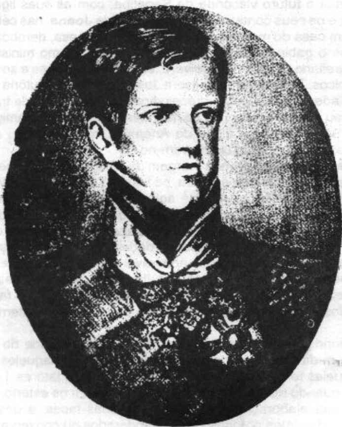
D. Pedro II, imperador do Brasil em 1840

liberais de todos os tempos. No seu artigo 121, a Constituição (e estava-se em cheio no período áureo das Cartas, cujo respeito feiticista era pregado no mundo inteiro pelo maçonismo) declarava textual e clarissimamente: "O Imperador é menor até a idade de dezoito anos completos." Os conservadores desejavam a antecipação da Maioridade.