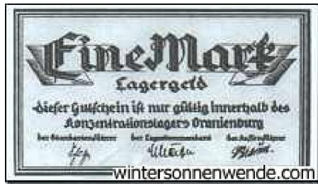
Bonos utilizados en Oranienburg