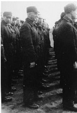
Policía judía de los KZ