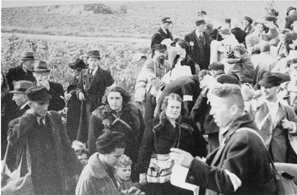
Judíos llegan al campo de Westerbork, Holanda en 1942.