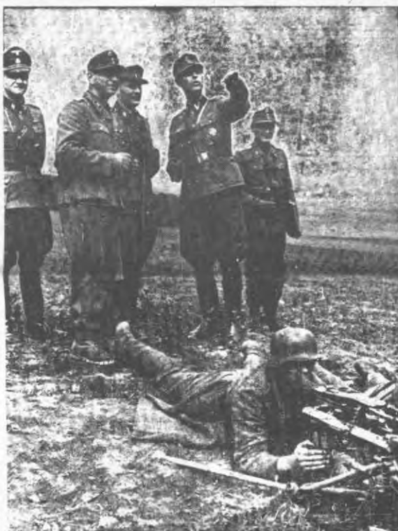
LA « H-BRIGADE D'ASSAULT DES VOLONTAIRES FRANÇAIS » A L'INSTRUCTION PENDANT L'EXERCICE DE COMBAT

Mais le courage moral de Philippe Henriot aura été plus rare encore. Il faut dire que sa formation politique, dans les rangs de la vieille droite conservatrice et catholique, ne le destinait point au rôle qu'il devait si glorieusement remplir. Nous avons vu se débattre lâchement presque tous ses amis de l'ancienne Chambre des députés. Certes, son patriotisme était trop pur et profond pour que Henriot soit asservi dans la dissidence d'un ennemi huruberlu comme Louis Marin. Ceux qui ne connaissent Philippe Henriot que par ouï-dire n'auraient cependant pas été très surpris, l'imagine, qu'il se fût cantonné dans une « ligne » neutralité. Mais Henriot trahissait sur la droite bourgeoise et mensongère par le caractère, par l'ampleur de ses vues non moins que par son immense talent. Antisémitisme, antisémitisme de plus en plus, pacifisme de 1936 à