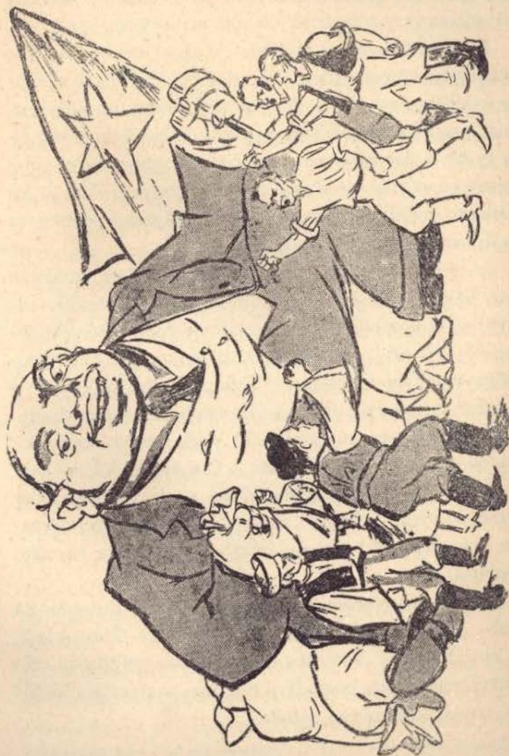
Všetkých proti všetkým hucká, aby mal vždy plné vrecká.

Po utvorení nezávislého slovenského štátu úrady vyme-