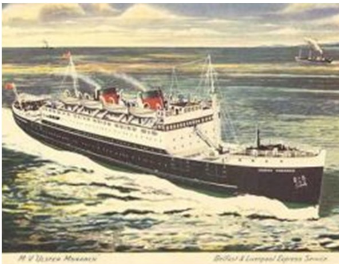
le ferry de la Monarch pour Belfast