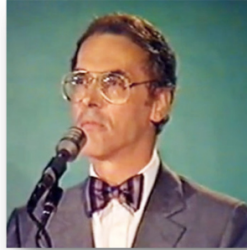
Bernard de Montréal