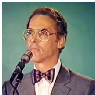
Bernard de Montréal