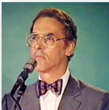
Bernard de Montréal