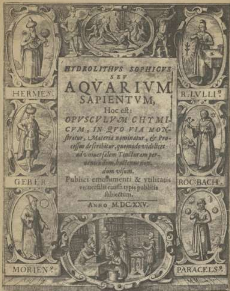
REPRODUCTION EXACTE (AVEC LES TACHES ET LES DEMI-TEINTES) DU FRONTISPICE D'UN VIEUX LIVRE D'ALCHIMIE.

(Procédé de la Maison POIREL, 38, rue de la Tour-d'Auvergne, à Paris)